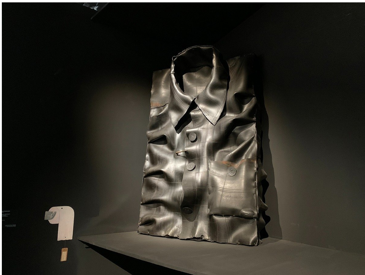
В музее современного искусства, черный зал.

«Свет — условие безопасности, роста, ясности и спокойствия. Бесплотность света открывает пространство. Белый содержит в себе все остальные цвета. Белый в европейской традиции, безусловно, положительный цвет. <...> Цвет управляет нашими эмоциями, причем всеми, не только позитивными. Часто цвет скрывает подмену, подделку, искусственность. Еще цвет может быть признаком измененного сознания, опьянения, галлюцинирования. Полноцветное, светлое и возвышенное может обернуться наивностью, идеализмом, соблазном, тщетными надеждами, самообманом, потерей лица в пространствах абстрактного и потому недостижимого добра», — читаю в белом зале.