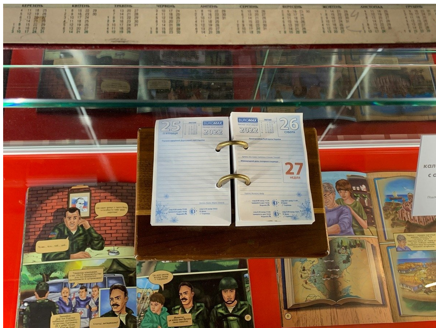
Блокнот — доказательство, что Украина собиралась напасть на Россию.

— Россия, конечно, до последнего не хотела начинать боевые действия. И даже когда признала независимость «ДНР» и «ЛНР» — рассчитывала, что этого хватит, чтобы остудить пыл националистов. Но в ответ обстрелы только усилились. Особенно сильно стреляли по Авдеевке, — говорит экскурсовод, видимо, даже не держа в голове, что к февралю 2022 года Авдеевка еще находилась под контролем Украины.