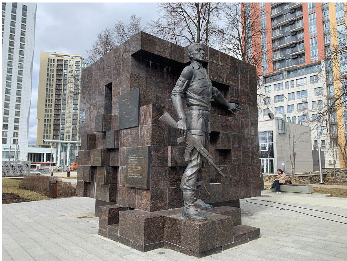
Памятник участникам войны в Чечне.

— В последнее время была сильная милитаризация, — говорит она. — Мы теперь, конечно, понимаем почему. Еще до 2022 года стало появляться очень много военных памятников. И все — на этом бульваре. И теперь получается так, что место, которое на самом деле все очень любили, — просто заставлено могильными плитами.