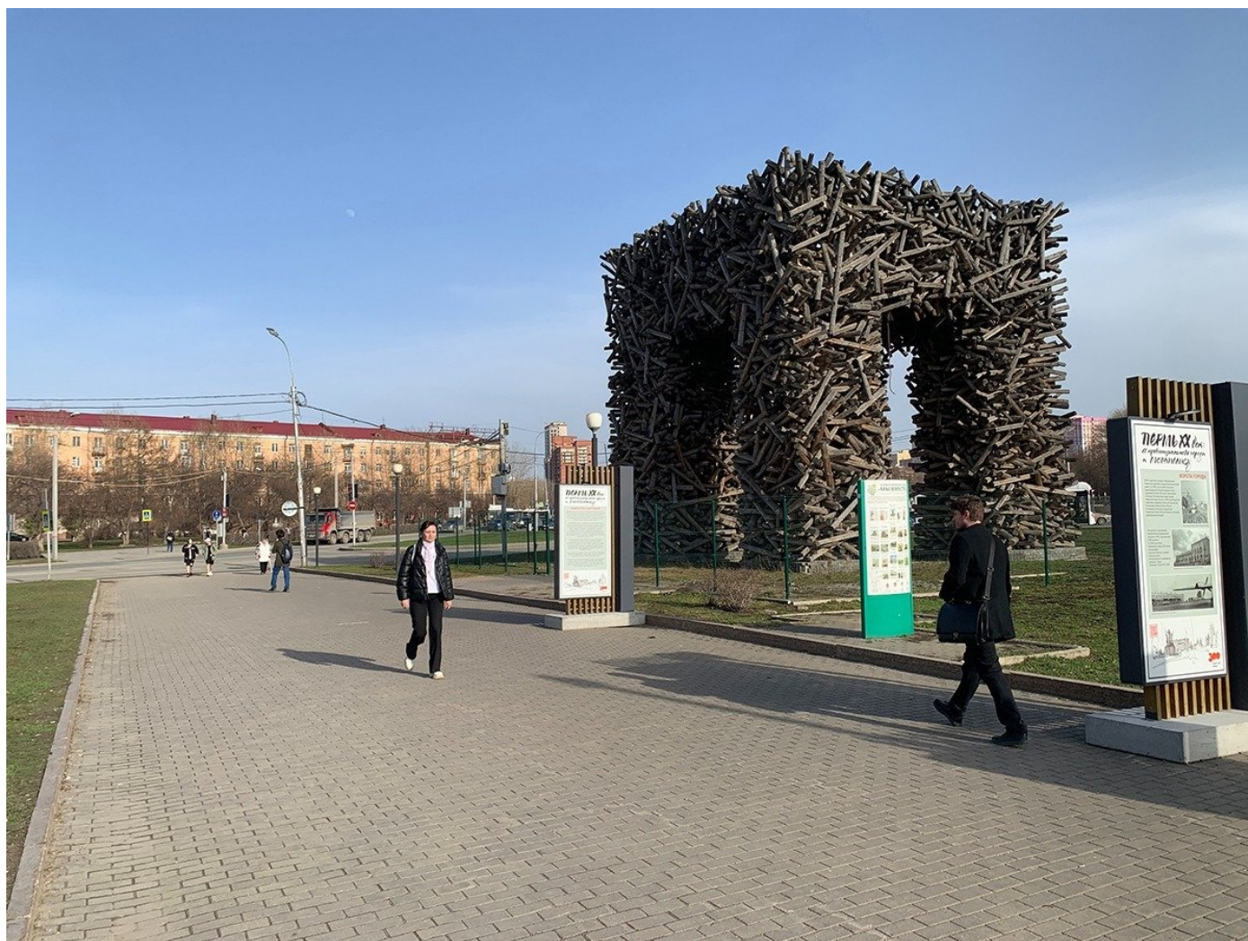
«Пермские ворота» (народное название «табуретка»).