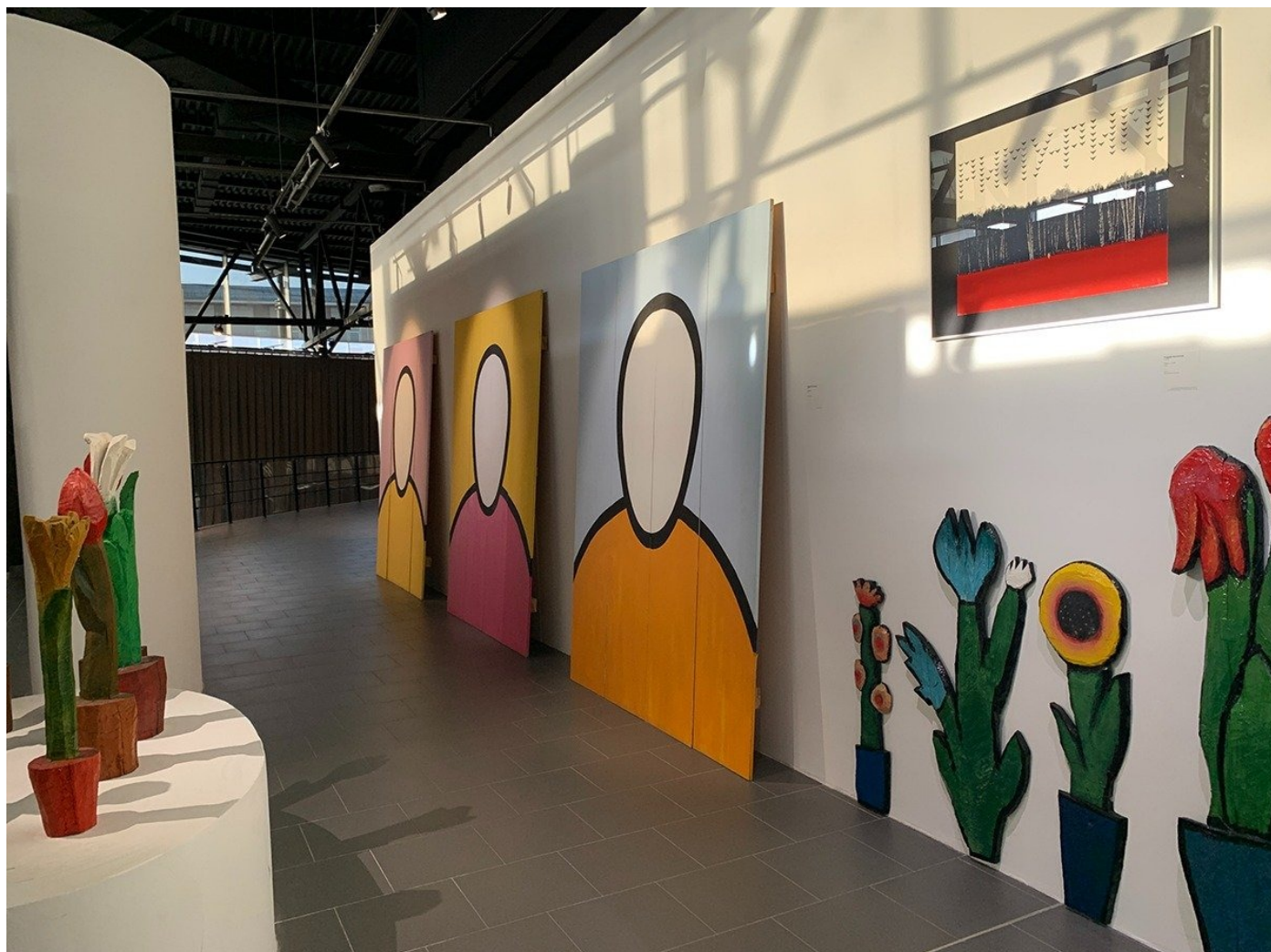
В музее современного искусства, белый зал.

Но эта мысль может быть ошибочной. Ведь современное искусство требует большого осмысления. А город сегодня, как я пойму позже, стремится к простоте.