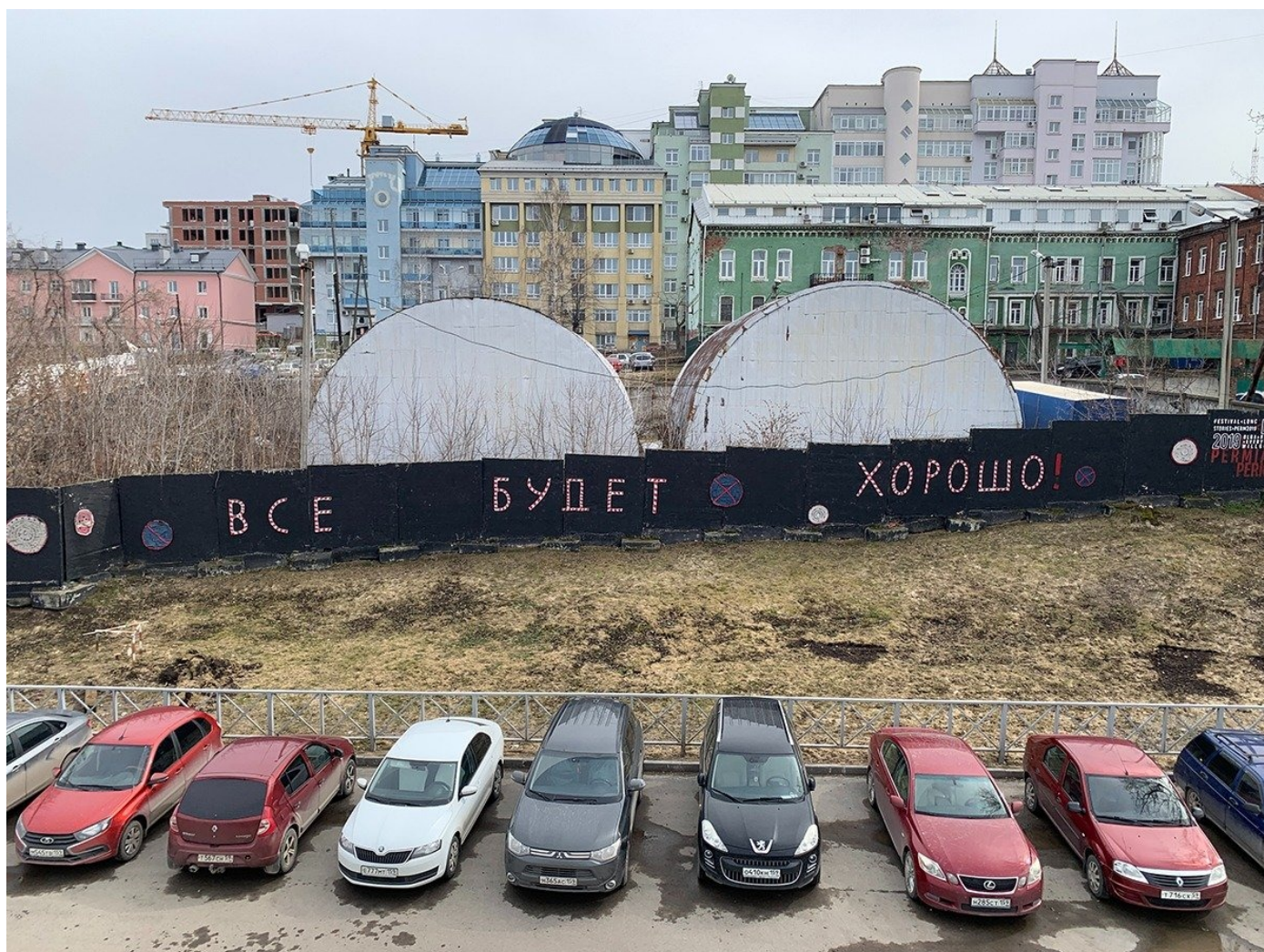
Наследие культурной революции.

страны. Вот только смотреть на них миллионы туристов не приезжают.