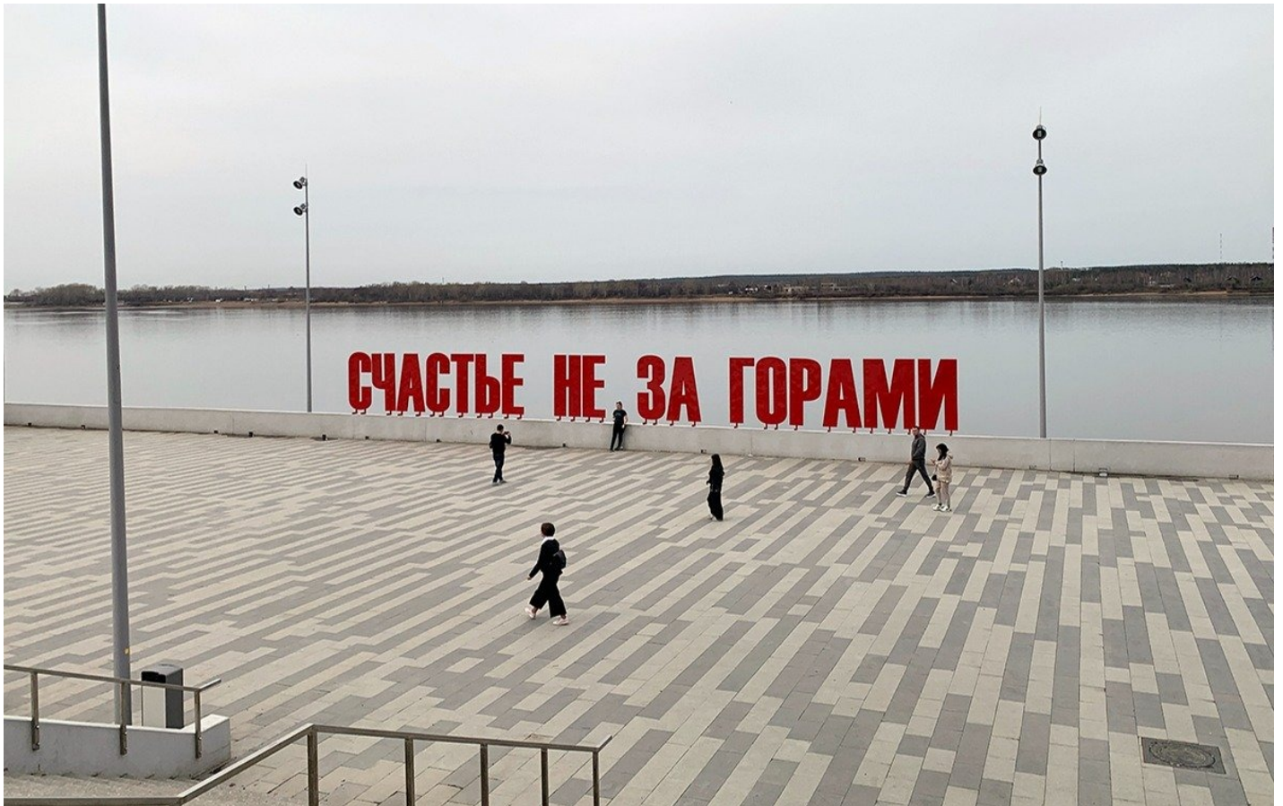
Инсталляция «Счастье не за горами».

Пространство вокруг речного вокзала действительно стало общим: для интеллигенции — музей, для тех, кому искусство не особо интересно, — прогулочная зона и... тоже искусство: «Счастье не за горами» установили прямо за вокзалом.