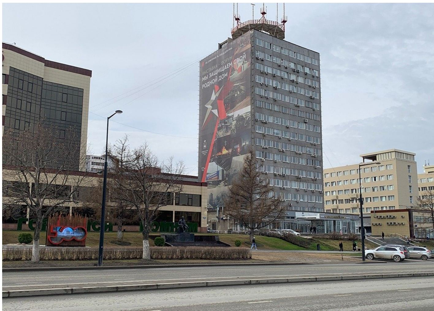
Афиша патриотической выставки.

Прямо напротив бывшего Музея современного искусства (а теперь патриотического центра «Россия — моя история»), в помещении Завода Шпагина, два больших зала выделены под выставку о событиях в Украине. На входе — двое парней в военной форме. Тщательно досматривают мой рюкзак и впускают внутрь. Стены павильонов расписаны информацией о Майдане, «анти-России», «нацистах», «бандеровцах».