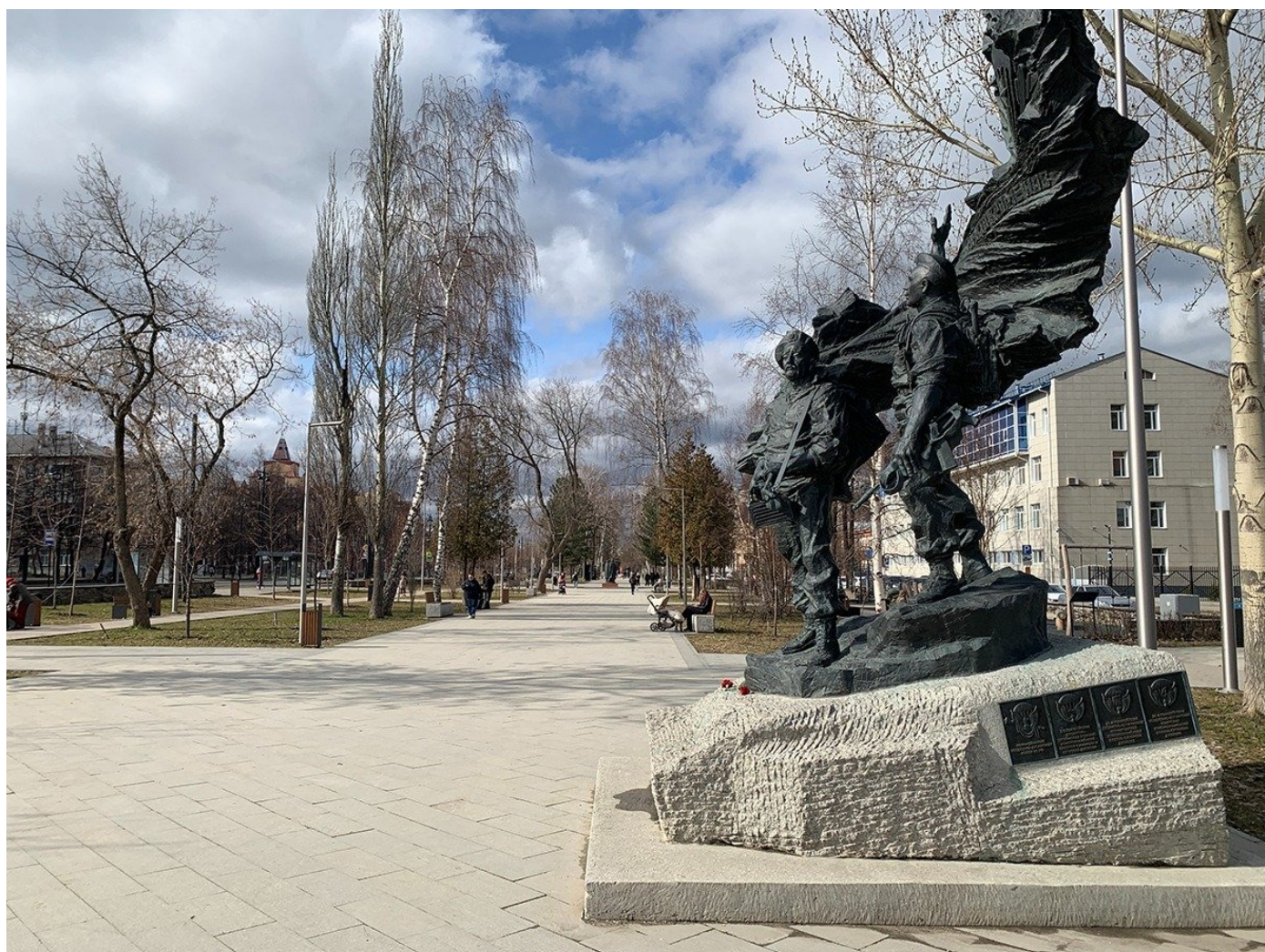
Памятник десанникам.