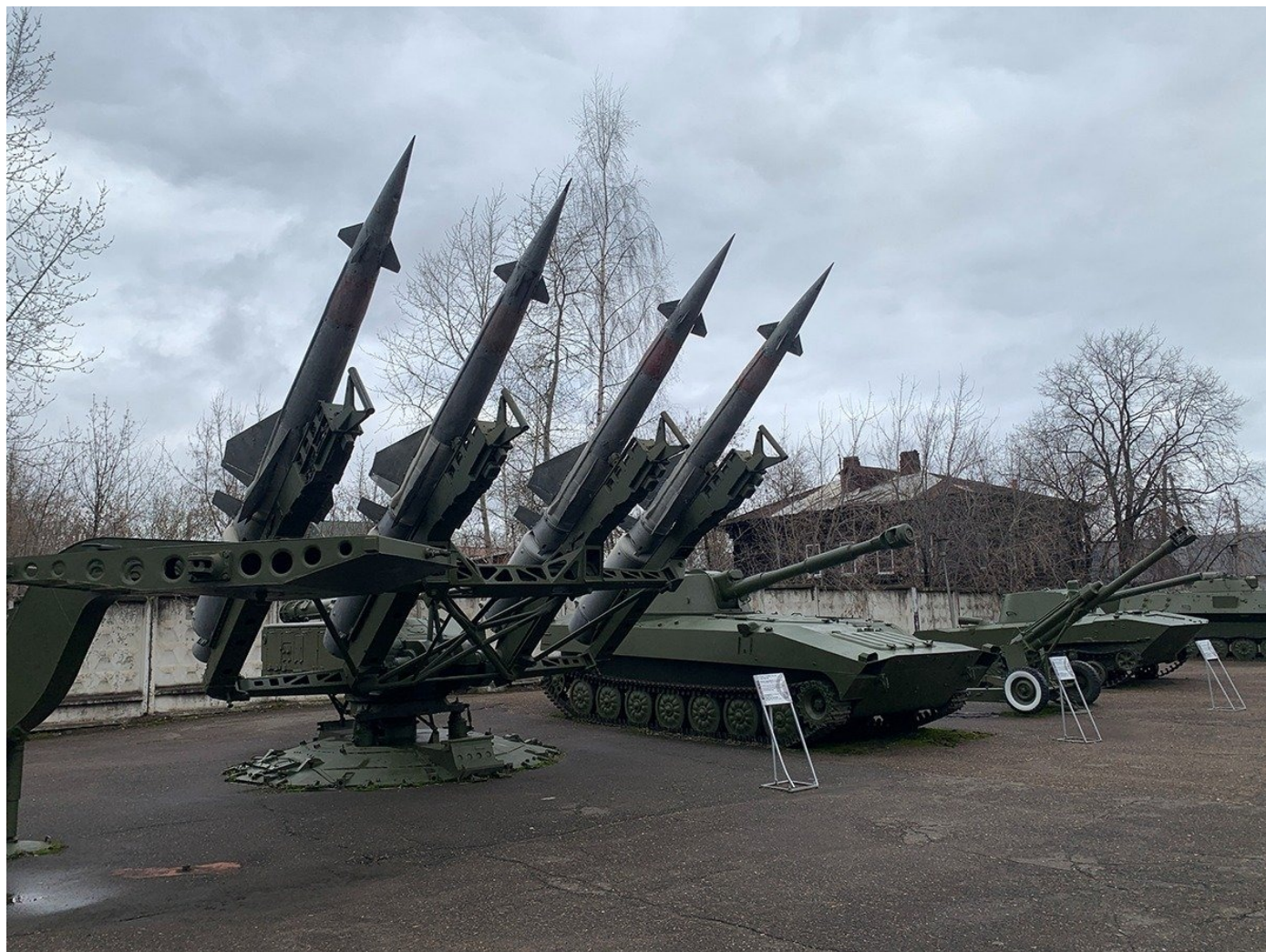
Музей артиллерии.