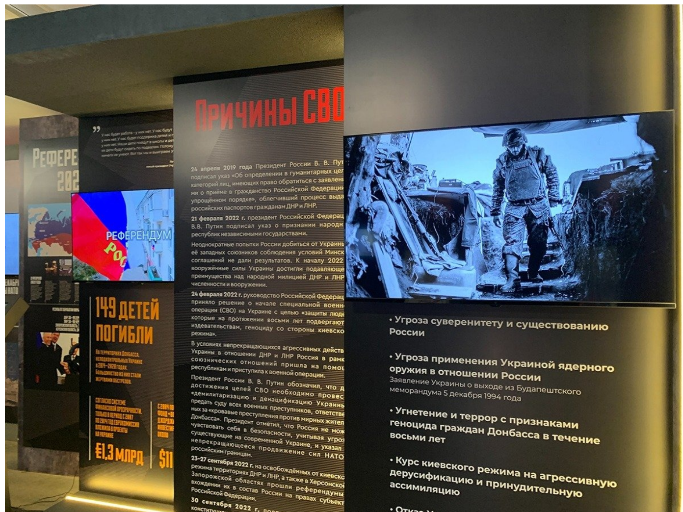
Выставка о событиях в Украине.

Иващенко, главы администрации Мариуполя от ДНР, в апреле 2022 года в городе находилось до 250 тысяч жителей — примерно половина от того количества, что было до боевых действий».