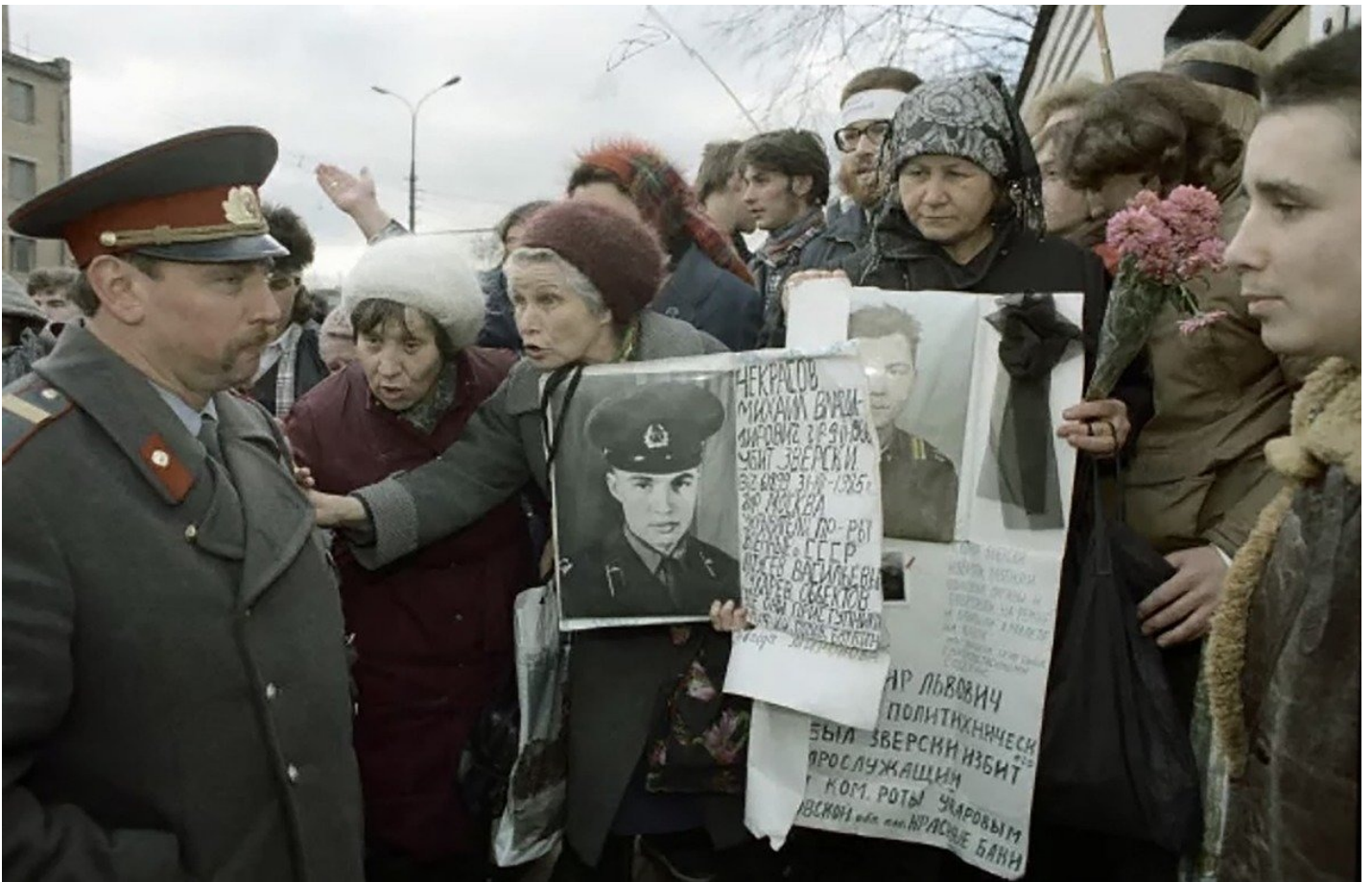
Солдатские матери на улицах Москвы.

Вот митинг у метро «ВДНХ»: «Материнство — высшее предназначение женщины, но даже оно эксплуатируется государством. Государство должно знать, что для матери нет ничего дороже своих детей, и если государство отбирает и убивает их, матери объявляют неповиновение такому государству». «Этот съезд выше всех съездов в стране». «Поклонимся матерям Афганистана, раз правительство СССР не может. Покажем ему пример. Съезд просит прощения перед всеми матерями за 10 лет афганской войны».