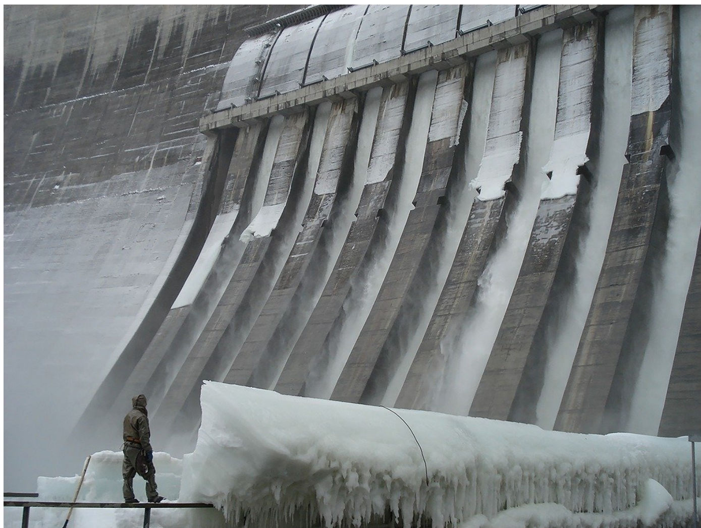
Саяно-Шушенская ГЭС. Ноябрь 2009. Ликвидация последствий катастрофы.

Если составлять рейтинг бесчеловечности крупнейших российских корпораций, всей той мерзости, что упаковывается в понятие корпоративной культуры, уничтожая человеческие честь и достоинство, безусловно, «РусГидро» далеко не в лидерах. Там все тоньше, изящнее. Но тетки — те же.