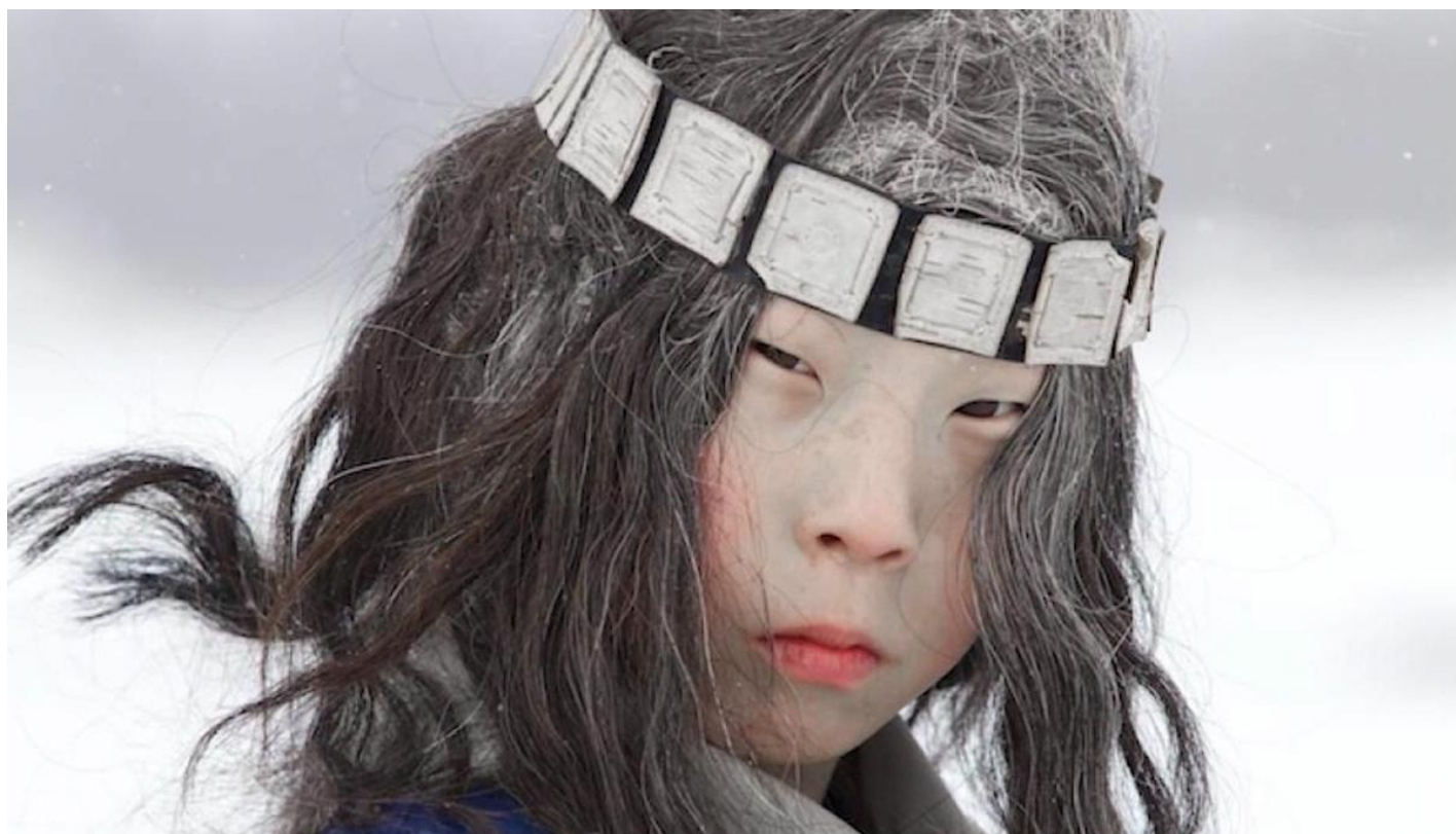
Кадр из фильма «Лицо»

В общем, замаячила тема. Что дальше? А дальше, по словам Ирины, фильм приснился режиссеру Догорову — буквально с поэпизодным планом: история реального парня с подставными персонажами. Началась игра в жмурки с коллективной импровизацией вокруг доверчивого героя, покоряющего Москву и покоренного ею.