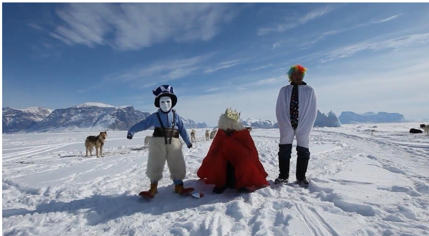
Кадр из фильма «Лицо»

...Почти накануне сдачи фильма «Лицо» в Минкульте выяснилось, что новые правила приема во главу угла ставят не художественность, не эксперимент, зрительский потенциал... Но только жесткое совпадение с заявкой. Никакие форс-мажорные исторические реалии в расчет не принимали: авторам следовало вернуть пять миллионов сразу, а не ввязываться в наполеоновскую авантюру.