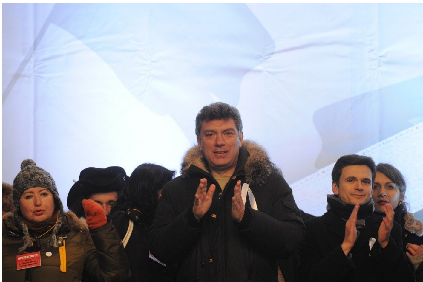
Митинг оппозиции «За честные выборы» на проспекте Сахарова 24 декабря 2011 года.