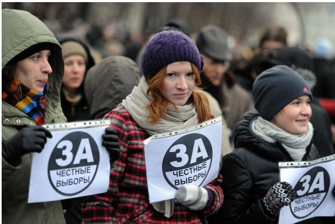
Митинг на Болотной площади 10 декабря 2011 года.