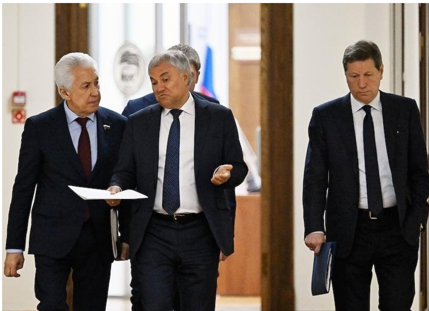
На заседании Госдумы ее спикер Вячеслав Володин назвал закон либеральным и демократическим.