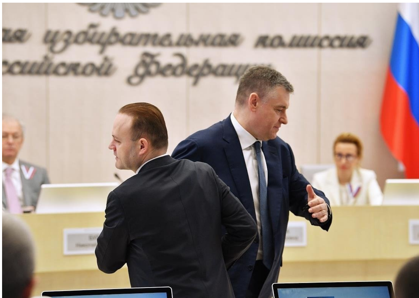
Владислав Даванков и Леонид Слуцкий.

После 2005 года законодательство о выборах менялось отдельными поправками, но до 8–10 раз в год. Это сделало его настолько запутанным, что роль практик ЦИК заметно возросла, а они складывались всегда в пользу «Единой России».