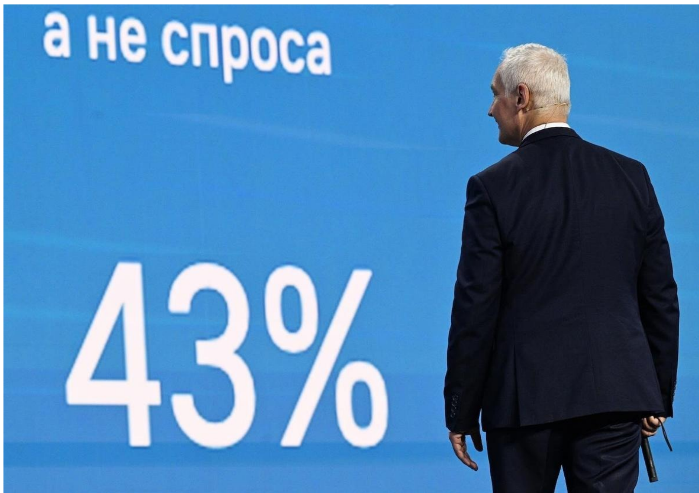
Андрей Белоусов.

И вообще, вся эта ваша перестройка и «реформы» — не при чем. Просто советская экономика не могла не развалиться — она и развалилась.