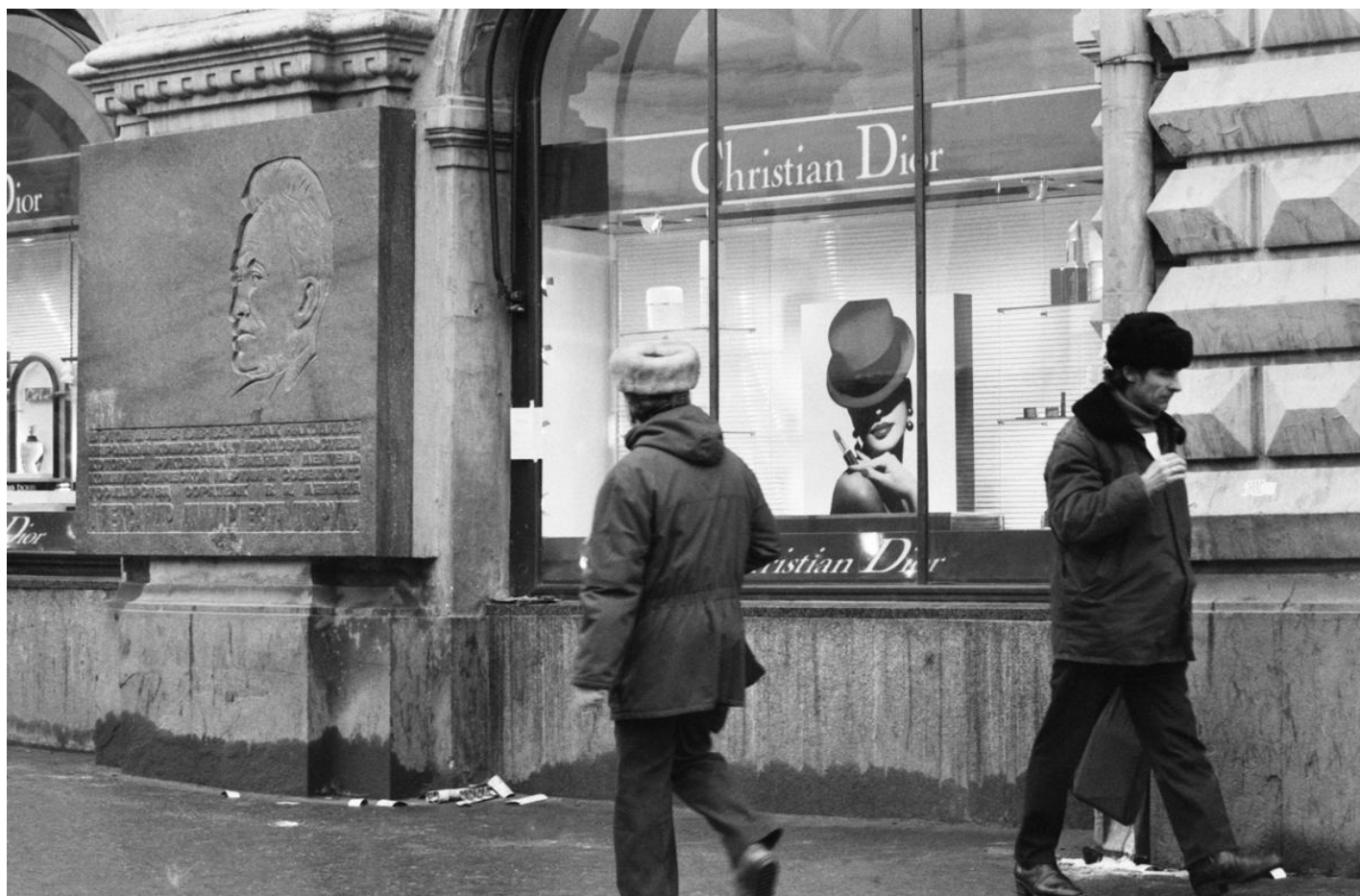
Москва, 1992 год. Витрина валютного магазина с рекламой фирмы Кристиан Диор.

— Институт народно-хозяйственного прогнозирования РАН). В 1991 году был назначен заведующим лабораторией анализа и прогнозирования макроэкономических процессов ИЭПНТП АН СССР и сохранял за собой эту должность до перехода на госслужбу.