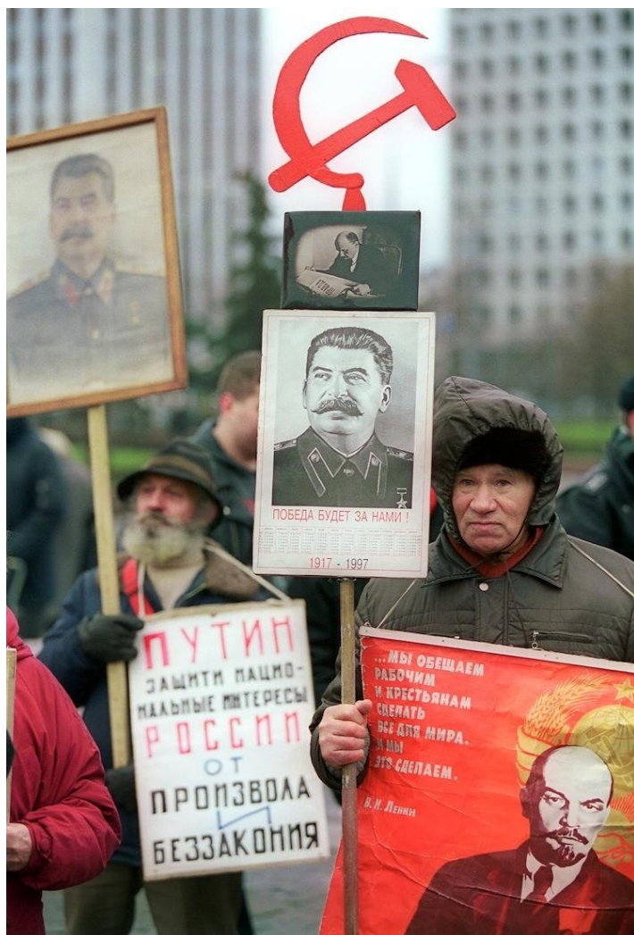
Демонстрация, посвященная годовщине Октябрьской революции. 2000 год.

«Сталинская индустриализация 1930-х годов была не про социализм, а про модернизацию индустриальной системы, доставшейся советской власти в наследство от Российской империи.