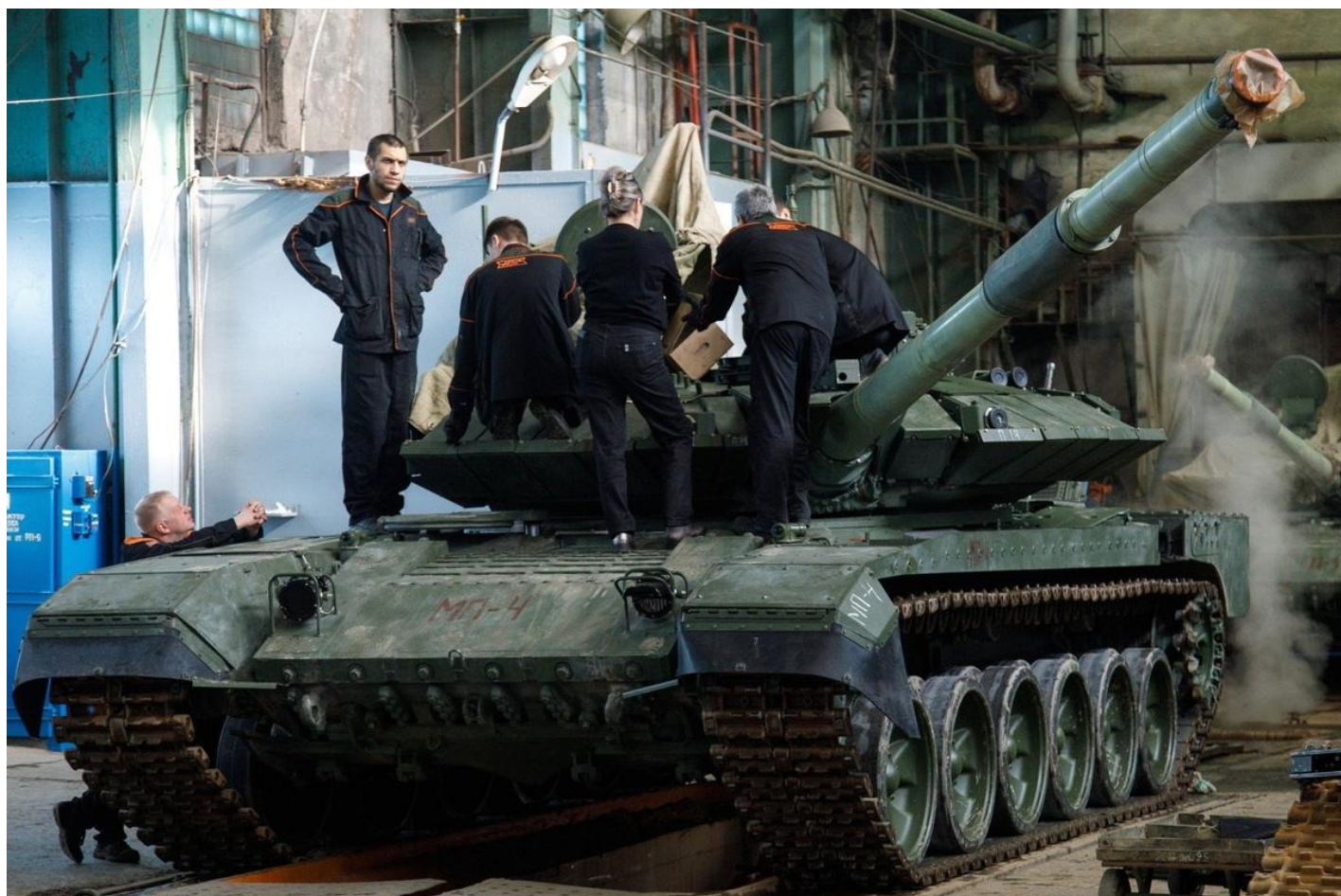
«Уралвагонзавод» готовит танки к параду Победы в Москве.

В общем, у Советского Союза было сырье, были трудовые ресурсы, а вот «своего машиностроения» — причем такого, которое могло бы обеспечить растущие потребности всех секторов промышленности и — заодно — потребности людей, — создать так и не получилось. Дальше вопрос экономического кризиса индустриальной системы СССР был вопросом времени.