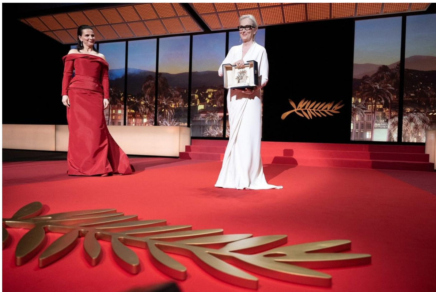
Жюльет Бинош и Мерил Стрип.