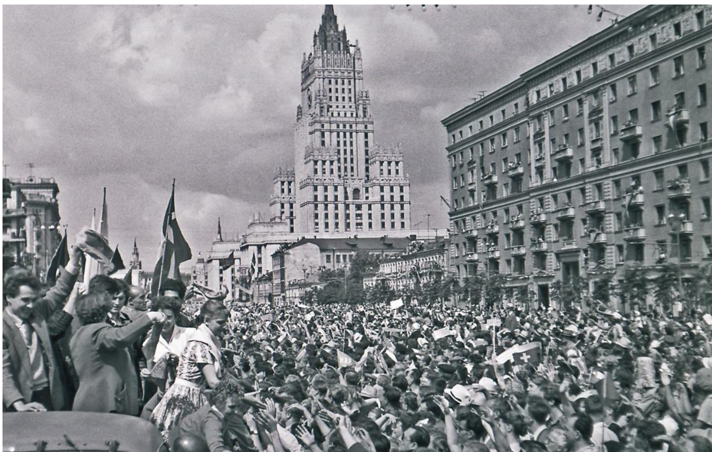
Шествие участников Фестиваля молодежи и студентов в Москве, 1957 год.

В 1957 году в Москве грянул Фестиваль молодежи и студентов в Москве.