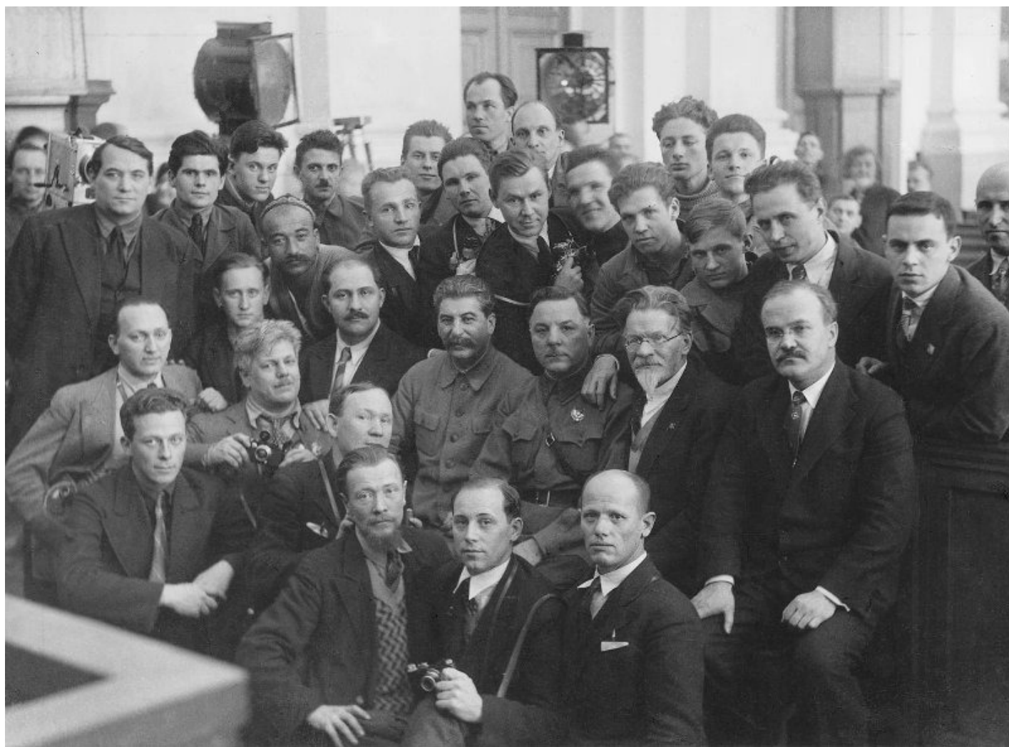
Члены Политбюро с группой кинооператоров и фотокорреспондентов, обслуживавших Съезд колхозников-ударников.