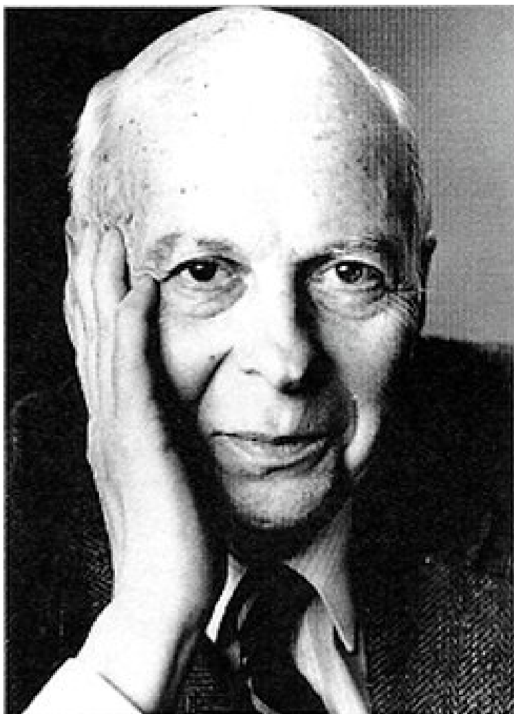
Роберт Такер.

Евгении Думновой, вышедшей замуж за работника уругвайского посольства, удалось уехать с мужем только после того, как лично министр иностранных дел Уругвая обратился с персональной просьбой к Молотову.