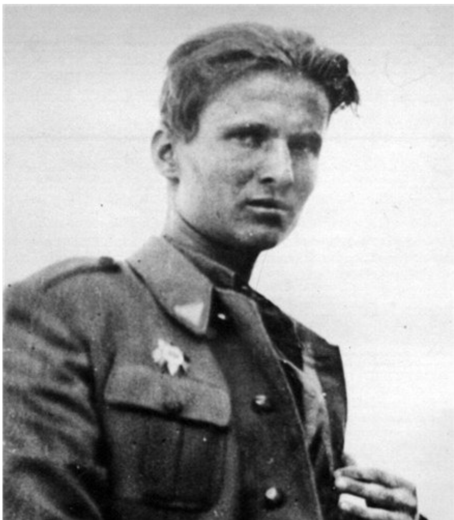
Жарко Броз.

премии на Политбюро) Президиум Верховного Совета СССР издал Указ, запрещающий браки советских людей с иностранцами, никак это решение не объясняя.