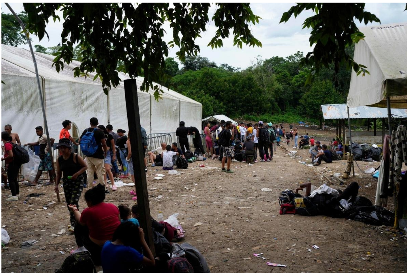
Мигранты, направляющиеся в США, в перевалочном пункте в провинции Дарьен.