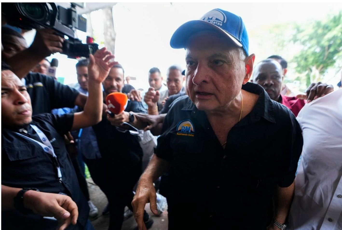
Бывший президент Панамы Рикардо Мартинелли.

Он устанавливал точки бесплатного интернета, поставлял в школы современные компьютеры и тратил бюджет на образование. При нем было заложено первое панамское метро, которым ежедневно пользуются 180 000 человек. Правительство Мартинелли субсидировало доступ к энергоресурсам более 50 000 домовладений, билеты на общественный транспорт и пенсии для тех панамцев, у кого ее не было. При нем к 2013 году в Панаме работали 103 международные компании, которые создавали рабочие места для панамцев.