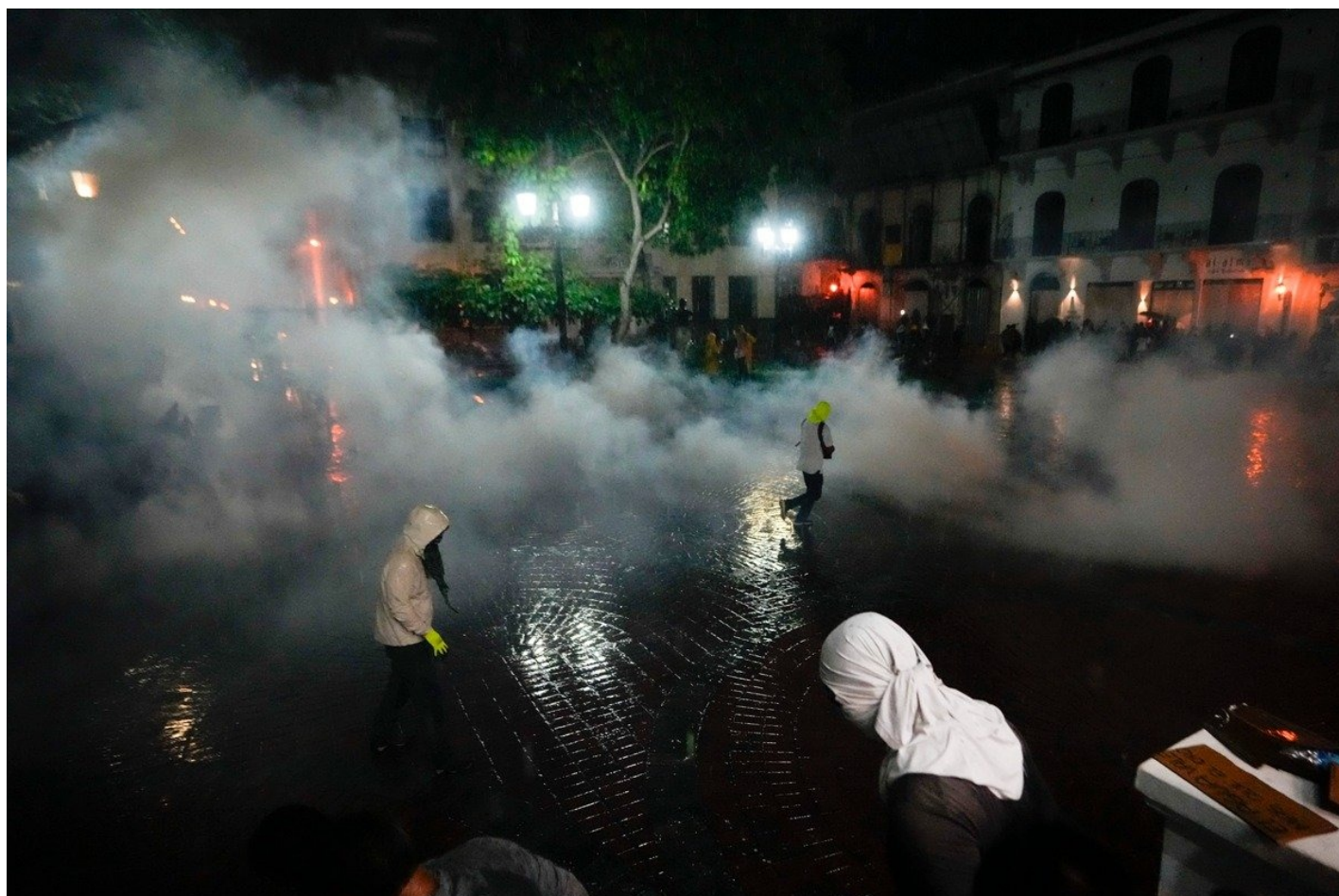
26 октября 2023 года. Акция протеста против одобренного контракта на добычу полезных ископаемых между правительством Панамы и канадской компанией First Quantum Minerals.

Страну ждали публичные дебаты и вывод канадской компании из тени; она впервые предстала перед обществом и вызвала противоречивые оценки. Молодые люди выходили на уличные акции против компании с лозунгом Panamá vale más sin minería — «Панама стоит большего и без добычи полезных ископаемых».