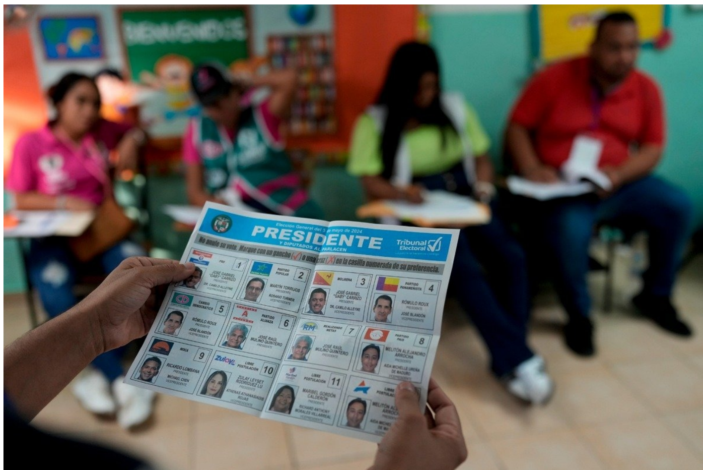
5 мая 2024 года. Всеобщие выборы в Панаме.

Среди них был Мартин Торрихос, бывший президент Панамы с 2004 по 2009 год. Он сын Омара Торрихоса, который возглавлял страну в конце 60-х и до начала 80-х. В гонке участвовал и бывший министр иностранных дел Ромуло Ру. Также попытали удачу вице-президент Хосе Габриэль Карризо и дипломат, юрист и политик Рикардо Ломбана. Карризо стал рекордсменом по антирейтингу, его не любит 80% избирателей. Действующий президент Лаурентино Кортисо не мог переизбираться из-за конституционных ограничений в один президентский срок подряд.