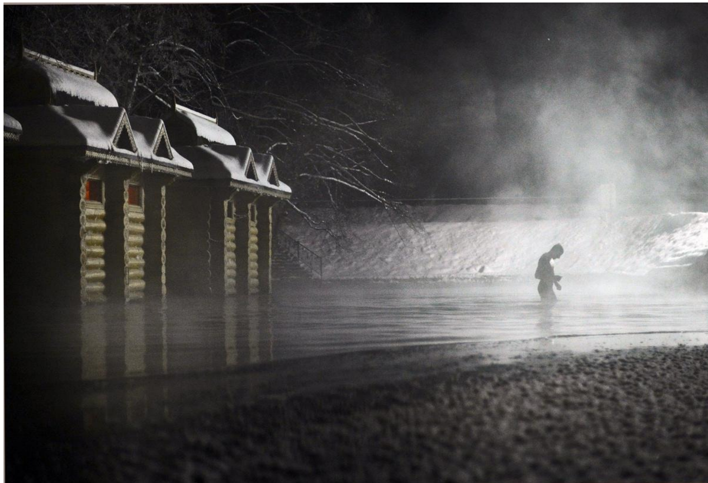
Праздник Крещения в Дивеево.

Вера в неприступность Канавки для Антихриста выглядит тем удивительнее, что даже советская безбожная власть смогла эту Канавку не просто переступить, но и полностью уничтожить, частично использовав для канализации.