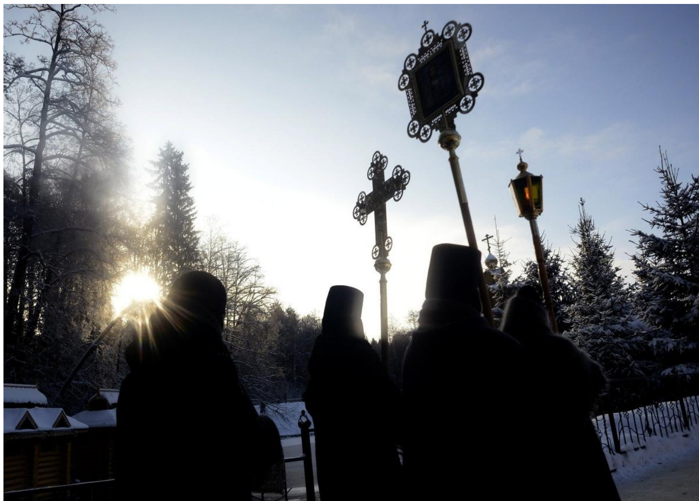
Праздник Крещения в Дивеево.