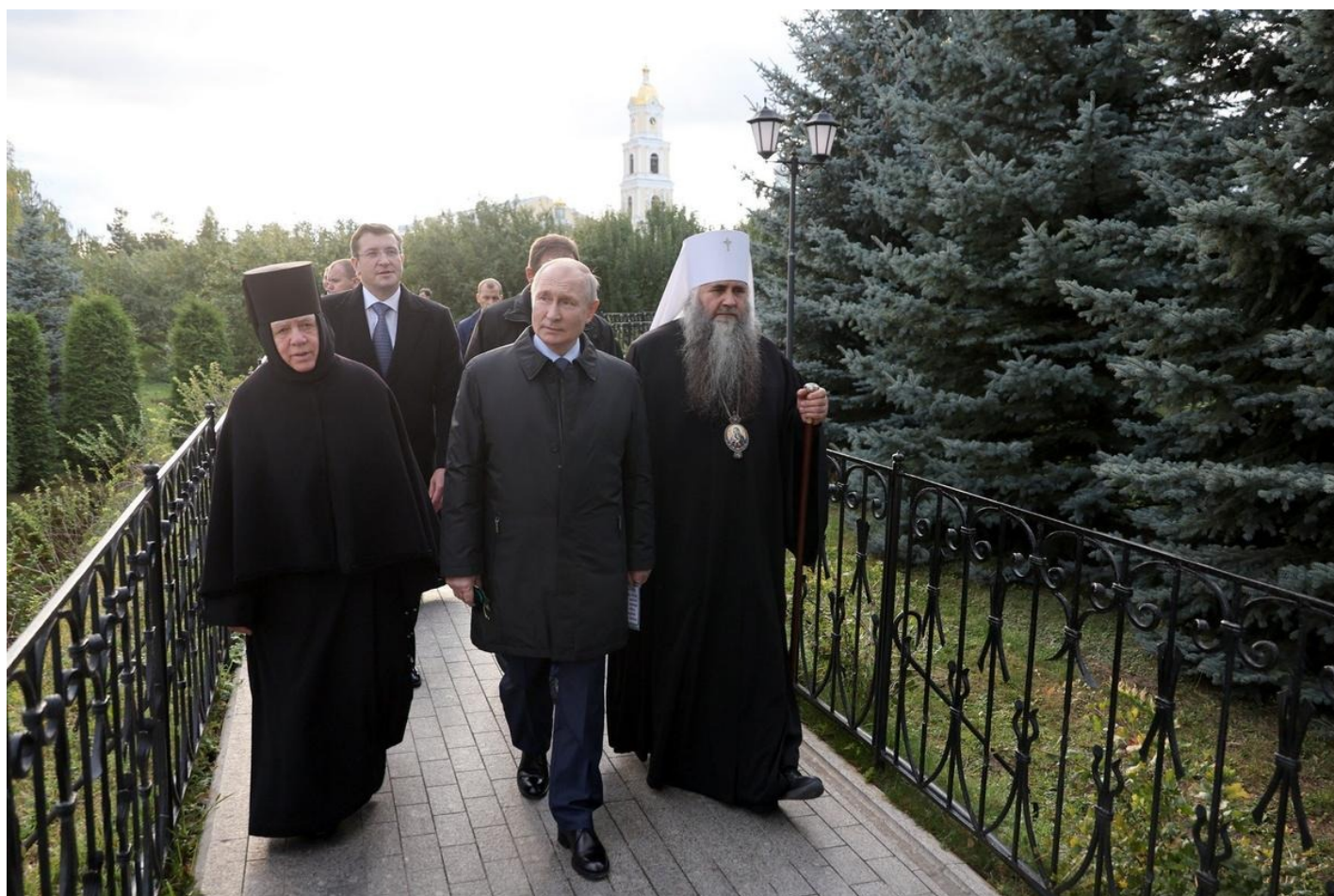
Владимир Путин во время посещения Свято-Троицкого Серафимо-Дивеевского женского монастыря.