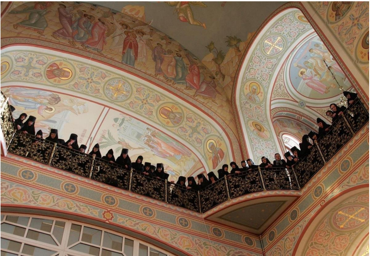
Монахини Серафимо-Дивеевского монастыря в Преображенском соборе во время визита Патриарха Московский и Всея Руси Кирилла.

что мировоззрение Михаила Ковальчука сочетает элементы православия с оккультизмом технаря: верой в «этническое оружие» (типа «боевых комаров избирательного действия»), создание американцами нового подвида Homo sapiens и в управление течением мысли из заокеанских лабораторий.