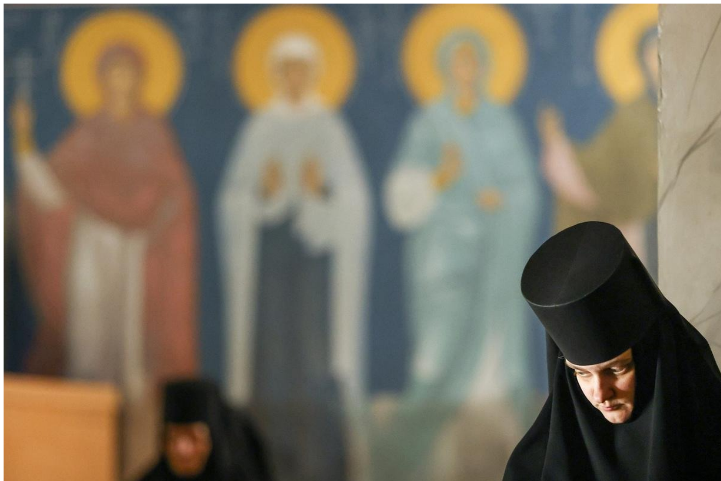
Монахиня во время праздничного богослужения по случаю Рождества Христова в Свято-Троицком Серафимо-Дивеевском монастыре.