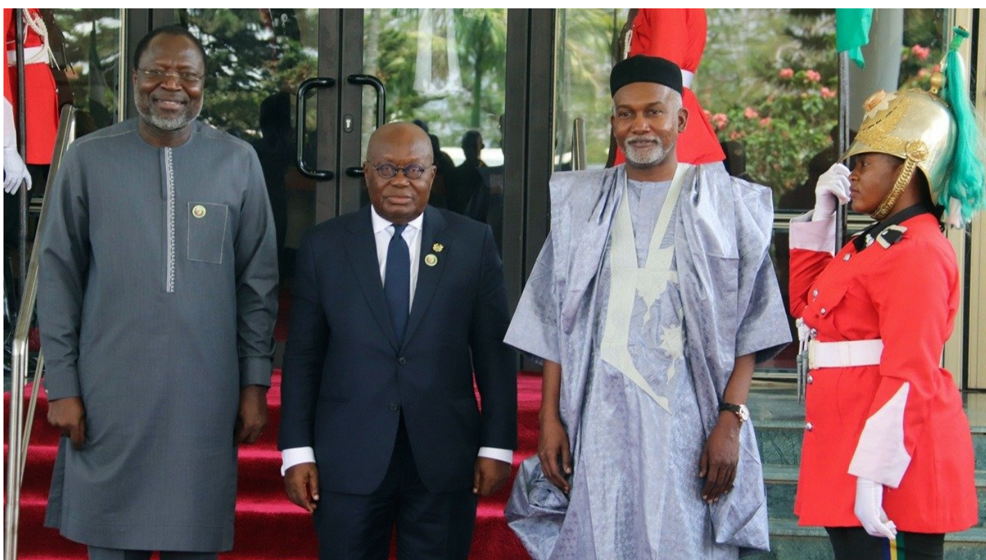
Омар Турей, президент Комиссии ЭКОВАС (слева), президент Ганы Нана Акуфо Аддо (в центре) и министр иностранных дел Нигера Юсуф Туггар перед заседанием ЭКОВАС.

Как далеко распространится кремлевское влияние на 26-миллионный Нигер, и при чем здесь иранская ядерная программа и Украина