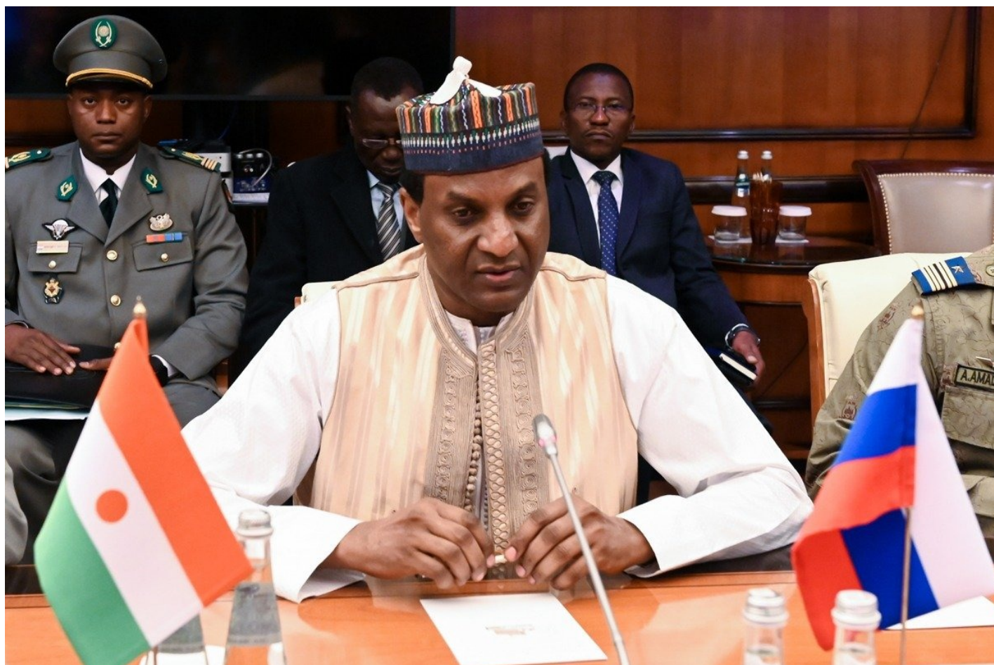
Премьер-министр, министр экономики и финансов Нигера Али Ламин Зейн во время встречи с вице-премьером РФ Алексеем Оверчуком. 16.01.2024.