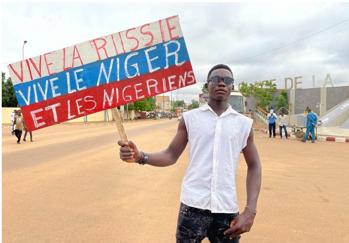
Сторонник государственного переворота в Ниамее, столице Нигера, во время акции в День независимости страны.

Информацию о переговорах подтвердили и «несколько официальных западных и нигерских источников» Le Monde. По данным газеты, «в первом квартале 2024 г.» доказательства таких переговоров добыли спецслужбы США. Возможно, эти доказательства были приведены в ходе упомянутых выше американо-нигерских переговоров 12–14 марта в Ниамее, которые с американской стороны возглавляла помощник госсекретаря по делам Африки Мэри Кэтрин Фи. По данным источника Le Monde, она предлагала хунте возобновление «приостановленного» после путча военного сотрудничества и возможность увеличения помощи со стороны Вашингтона — но только в том случае, если нигерцы «дадут гарантии», что не будут поставлять уран иранцам и, по крайней мере, «не будут размещать российских наемников на той же территории, что и американские военные». Такую же информацию сообщали и источники Reuters , более развернуто: «По словам чиновника,