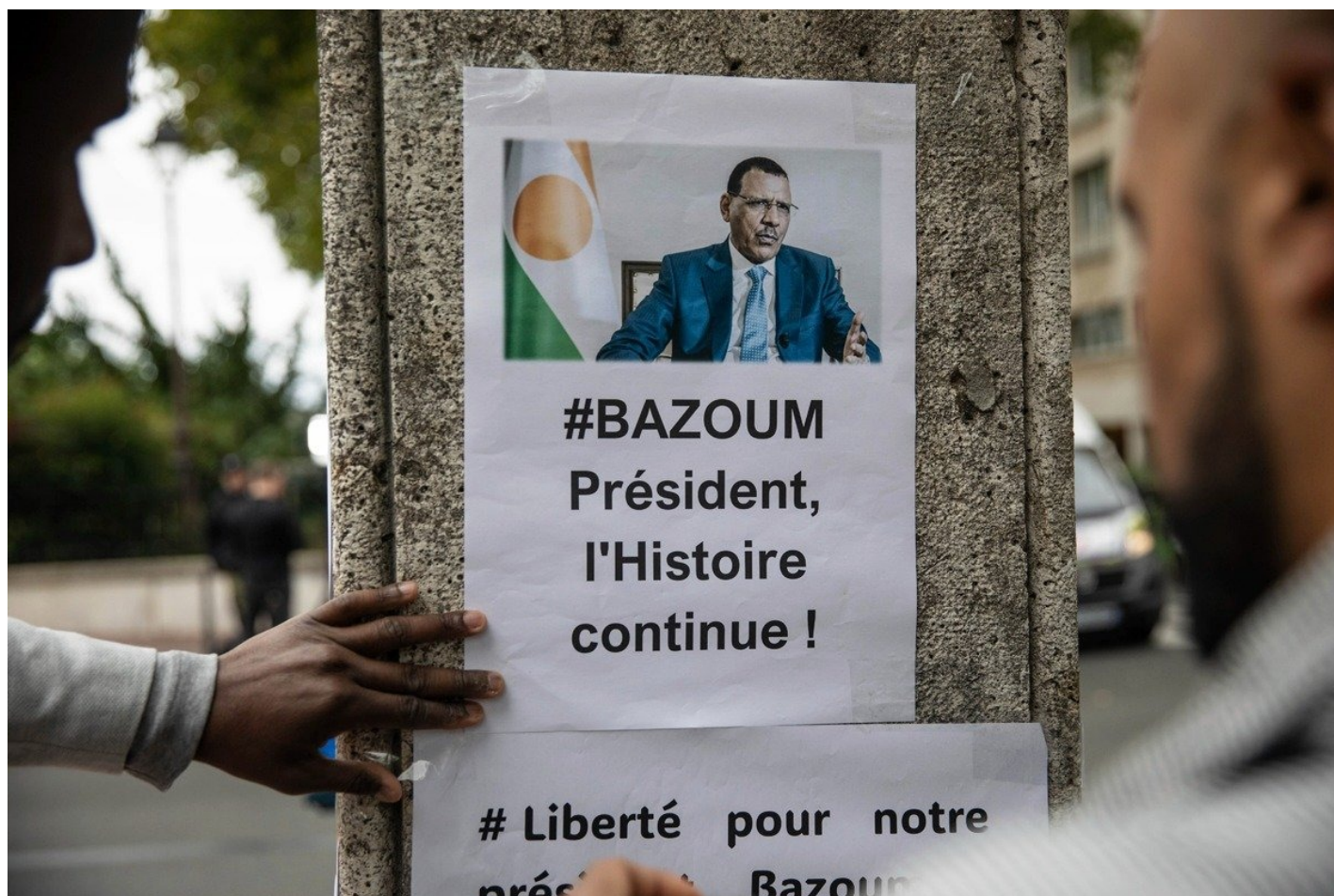
Париж, акция в поддержку президента Нигера Мохамеда Базума и ЭКОВАС.

джихадистскими группировками на юго-востоке страны, недалеко от Нигерии, также отмечает АФР.)