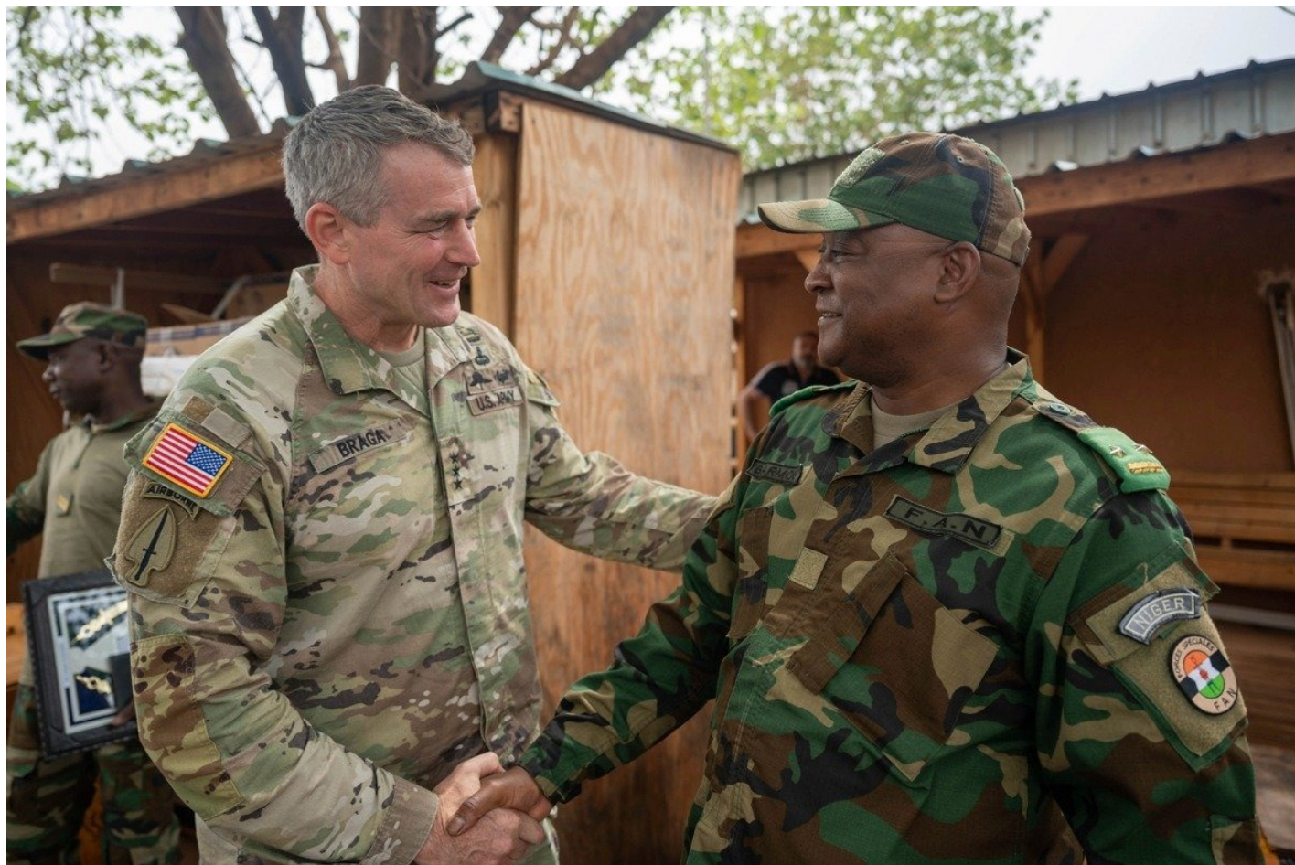
Вывод американских войск из Нигера «не влияет на продолжение американо-нигерских отношений в области развития».

войск из Нигера не влияет на продолжение американо-нигерских отношений в области развития»; «Соединенные Штаты и Нигер обязуются вести постоянный дипломатический диалог для определения будущего двусторонних отношений».