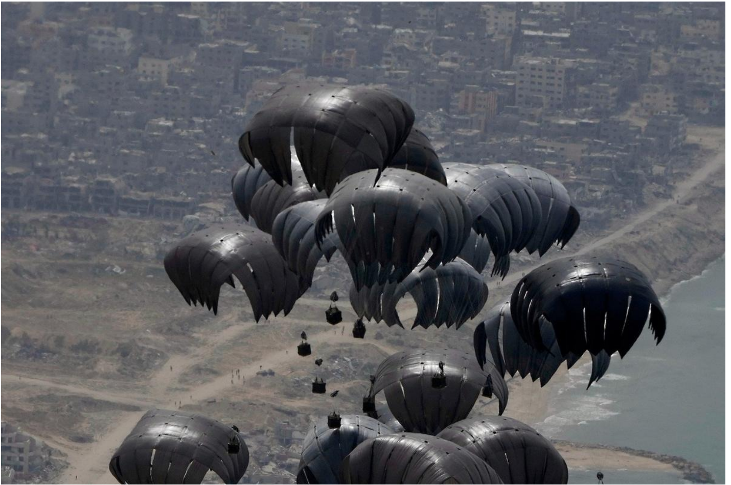
Сброс гуманитарной помощи с самолета ВВС США в секторе Газа.

— Может быть, цены падают потому, что людям не на что покупать продукты? Деньги у них откуда? Раньше ведь многие зарабатывали на территории Израиля.