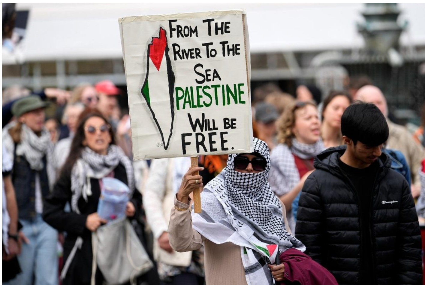
Массовая пропалестинская акция во время второго полуфинала музыкального конкурса «Евровидение 2024» в Мальме.