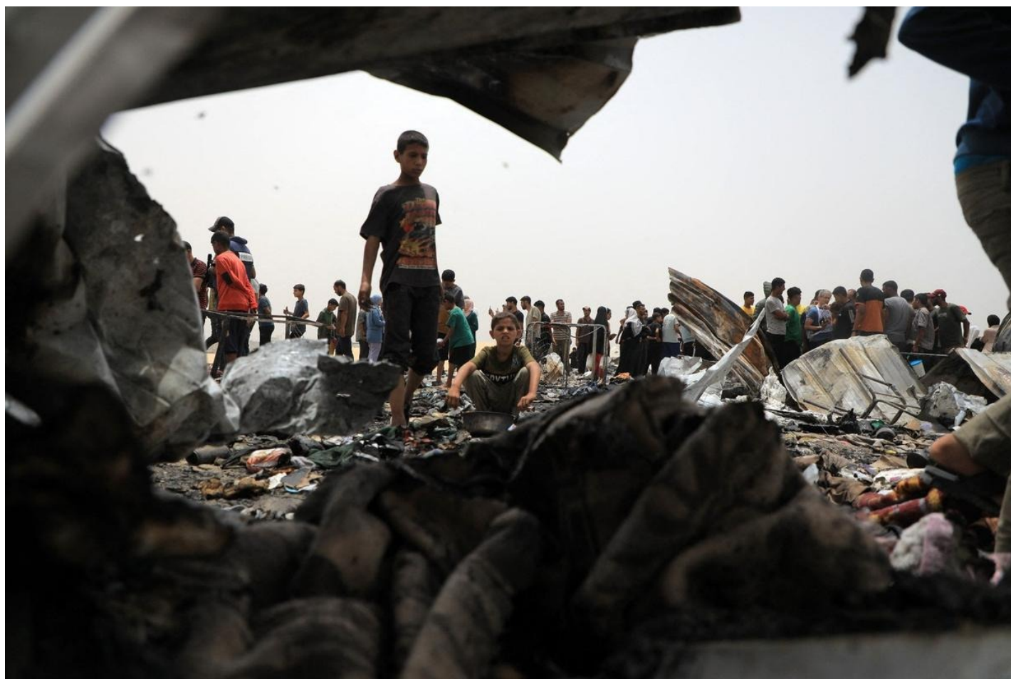
Сектор Газа.

— К счастью, это решаю не я. Но сейчас для ХАМАС нет смысла возвращать заложников: они заложниками прикрываются, главарей боевиков не уничтожают, продовольствие к ним поступает, в их тоннелях есть электроэнергия, там работают вентиляционные системы, у них все хорошо. Им остается просто пересказывать свое вранье этим придуркам в американских и европейских университетах.