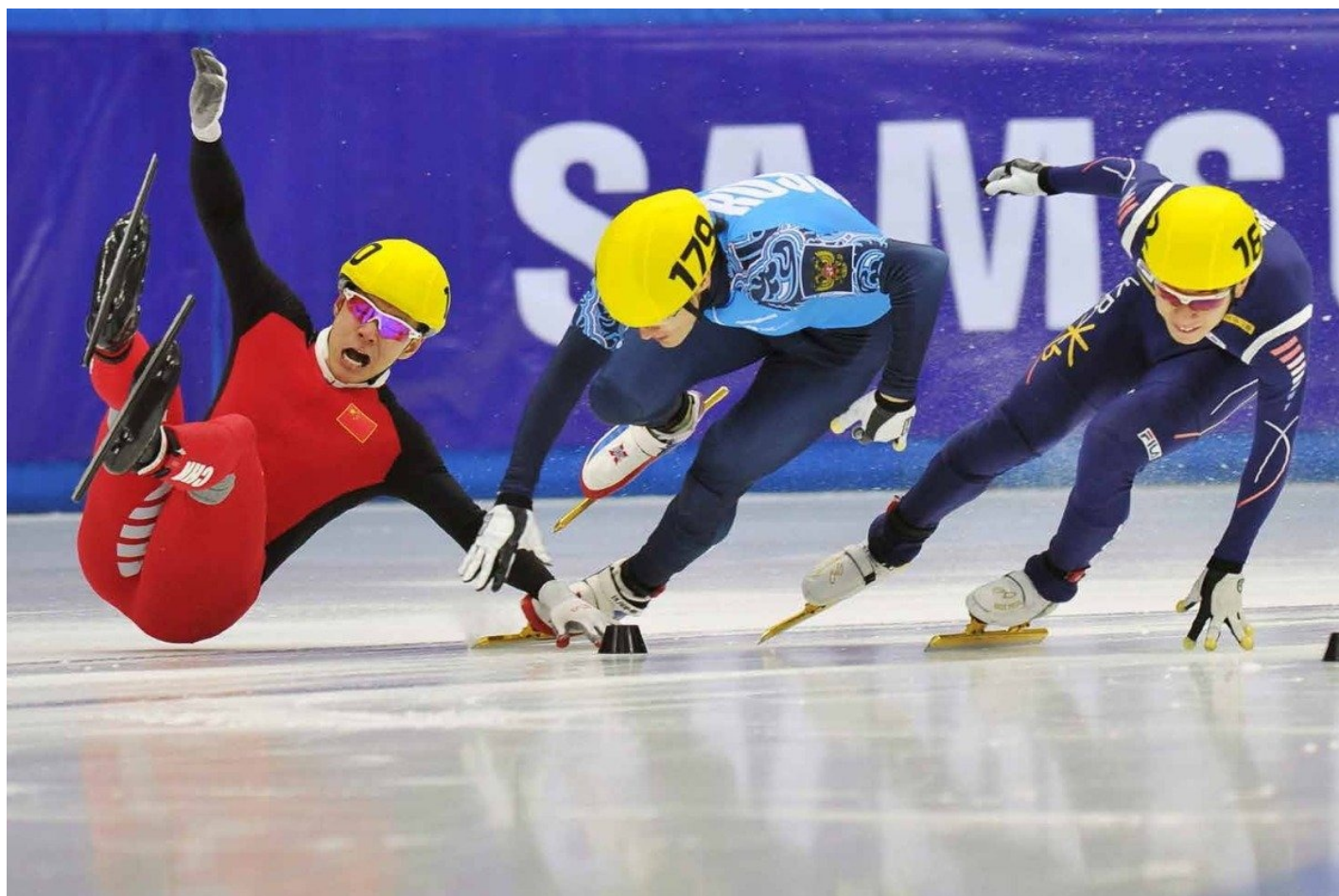
Фото с выставки в МАММ. Автор: Владимир Песня

...Спорт я любил с детства. Однажды я попал в боксерский зал — не умел давать сдачи, и туда меня отвела мама. Этот странный и сложный запах до сих пор кружит мне голову, эти огромные зеркала в человеческий рост и «бой с тенью», упругие канаты и бесконечный ритм ударов.