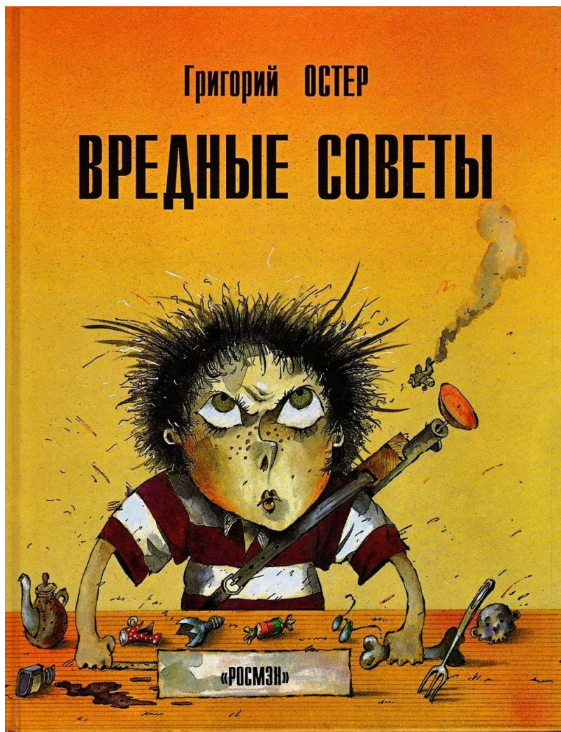
Обложка книги «Вредные советы»

И ведь не просто изъять произведение и убрать куда-то в хранилище — а уничтожить! Ассоциации с уничтожением книг у нас слишком очевидные и слишком страшные. В общем, «пройти мимо» я не мог, опубликовал скрины документов, новость повсеместно подхватили, дошла она даже до таких «небожителей», как сенатор Клишас, а потом началось не менее увлекательное.