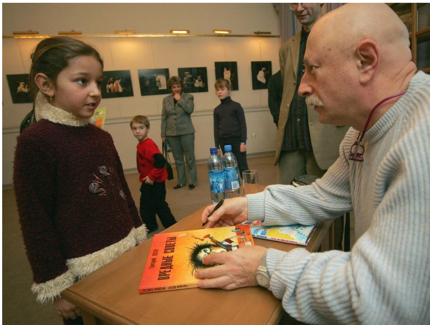
Писатель Григорий Остер подписывает свои книги для детей.

Так уж получилось, что я приложил некоторые усилия к тому, чтобы одна новость минувшей недели на сутки стала всероссийским событием. Но я вернусь к этой истории не потому, что пережил немного странную секунду славы, а потому, что в истории с попыткой запрета классической книжки Григория Остера сплелись невероятным образом вообще все сюжеты.