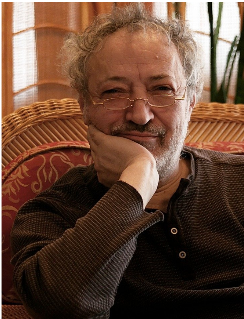
Бахыт Кенжеев.

В ночь на 26 июня 2024 года в одной из нью-йоркских больниц, немного не дотянув до своего 74-летия, умер Бахыт Кенжеев. Замечательный, сказочно талантливый русский поэт, с прирожденной гармонией в стиховой крови, весело-артистичный товарищ и иронично-прекрасный собеседник, героический выпивоха (не пьянел!) и неутомимо-обаятельный бабник и сибарит.