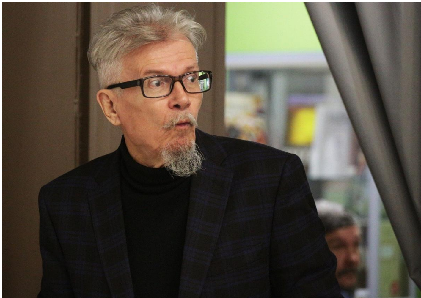
Эдуард Лимонов.

иное, как эстетический ремейк троцкизма.