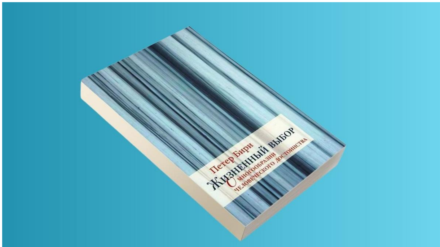
Обложка книги «Жизненный выбор»

На примере книги Петера Бири «Жизненный выбор»