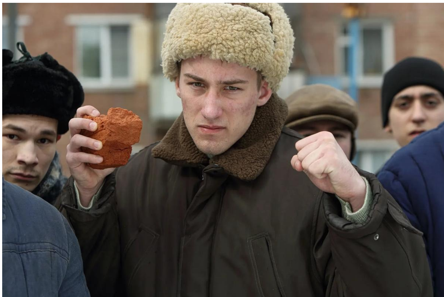
Кадр из сериала «Слово пацана. Кровь на асфальте»