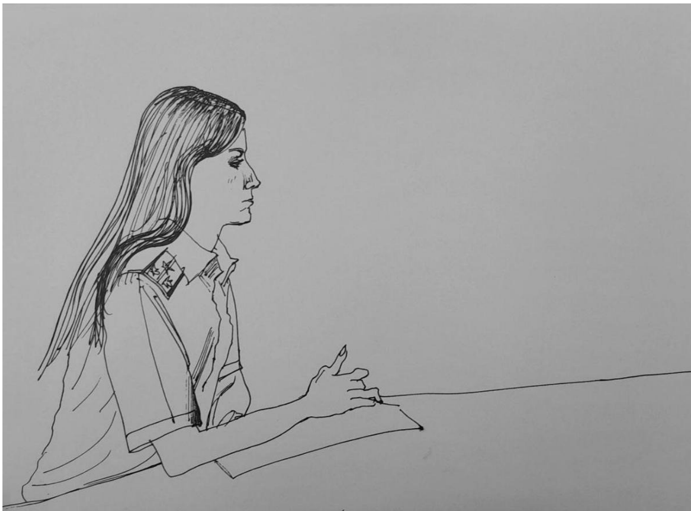
Прокурор Потаскуева. Рисунок: Екатерина Галактионова

Хараидзе просит раз в неделю иметь возможность подышать воздухом, или прогуляться за покупками, или выбрасывать мусор самостоятельно — тяжело все время в заточении и без солнца. Ее задержали летом 2021 года, сейчас лето 2024 года.