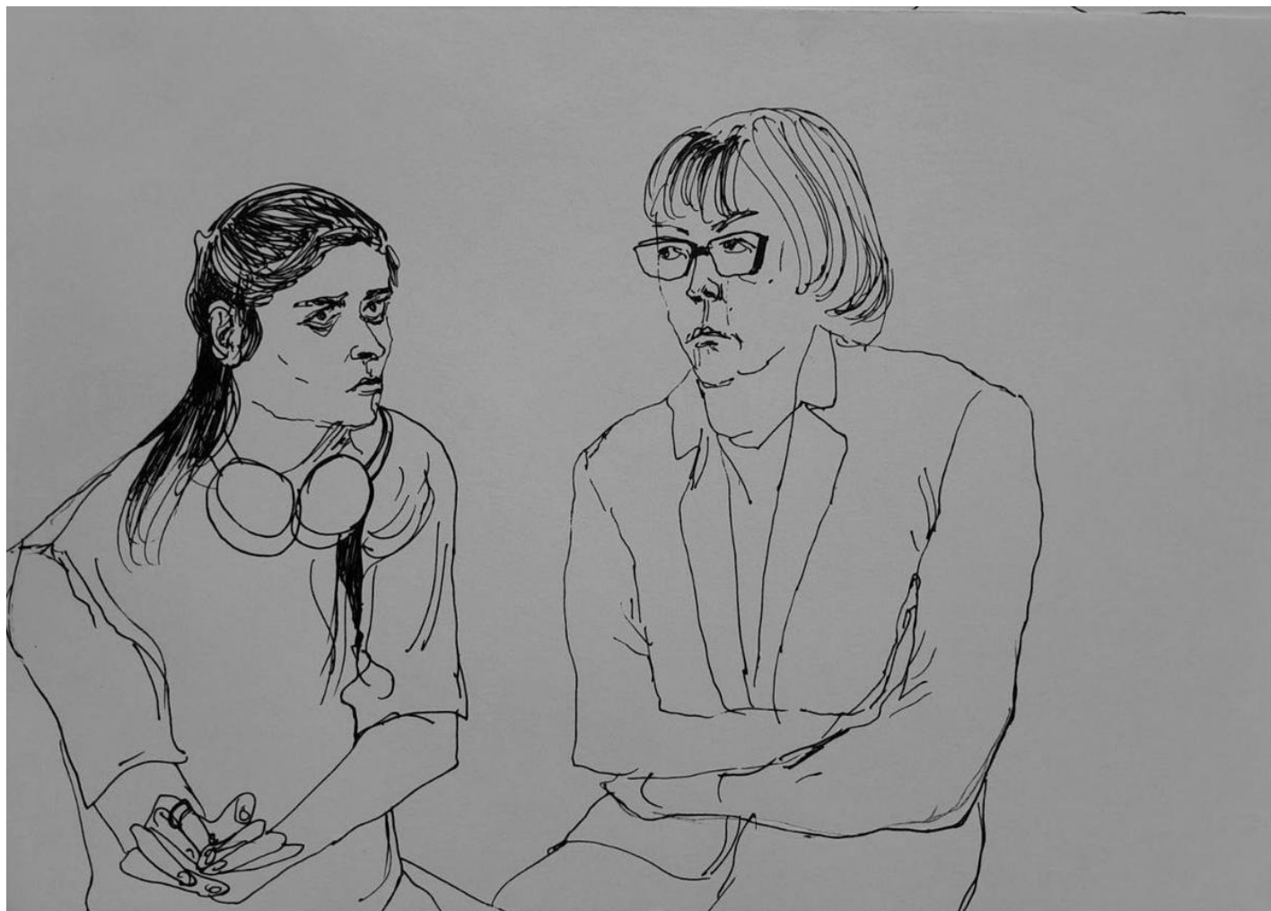
В суде. Рисунок: Екатерина Галактионова

Перед оглашением решения в паузе сразу вырубает звук трансляции, слушатели пробуют освоить язык жестов. Прокурор смотрит в потолок, прислонившись к стене.