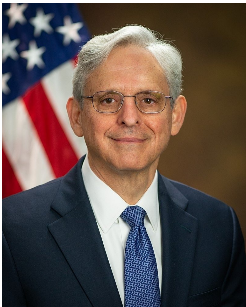
Меррик Гарланд.

«Нью-Йорк таймс» сообщила, что у американцев, сотрудничающих с российской госпропагандой, будут новые обыски.