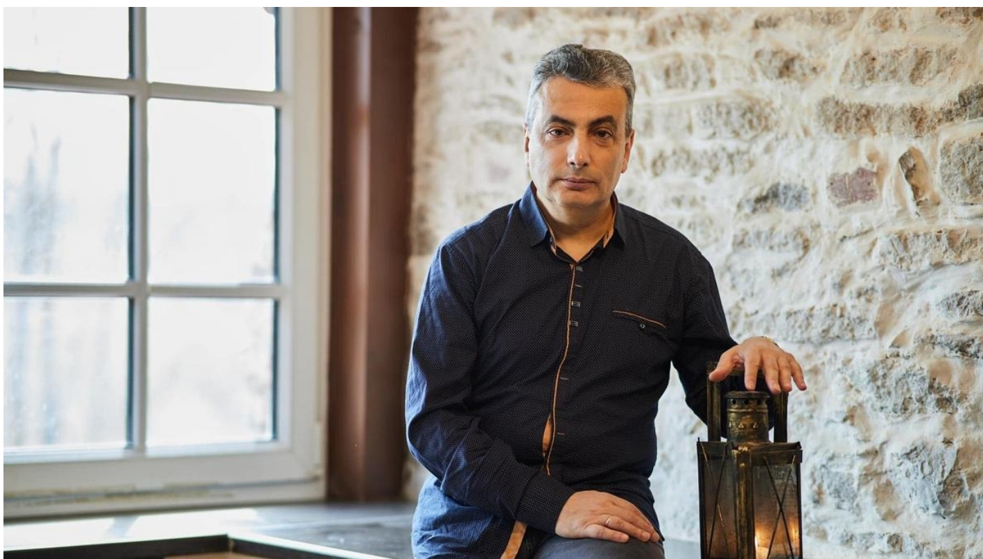
Лев Шлосберг.

У Льва Шлосберга* и его 95-летнего отца прошли обыски. Известному псковскому политику грозит 2 года тюрьмы за то, что он не выглядит как «иноагент»