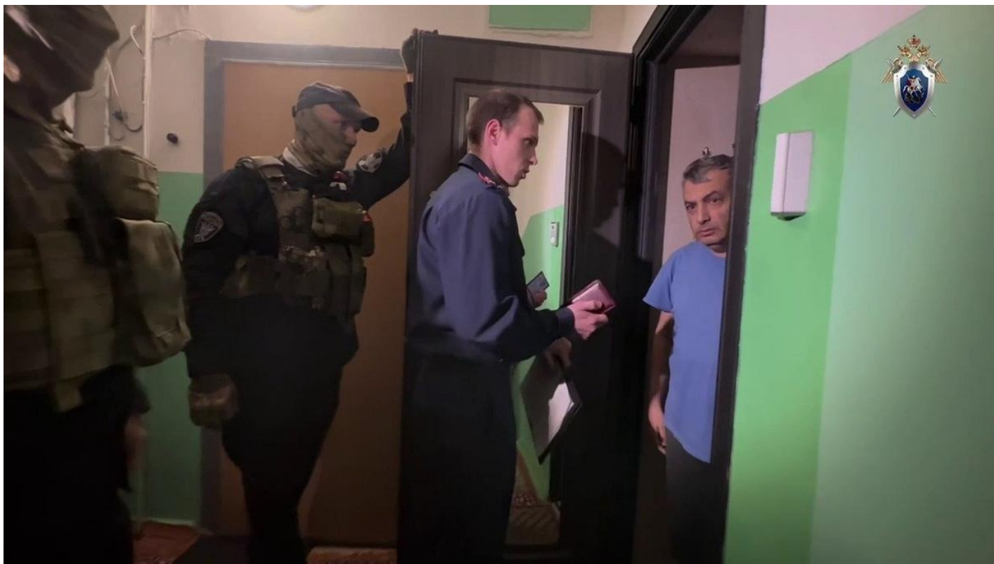
Обыск у политика и журналиста Льва Шлосберга.

«Я не признаю себя виновным в совершении преступления, в котором меня подозревают, состав преступления в моих действиях отсутствует, — написал Шлосберг в социальных сетях после обыска и допроса, поблагодарив всех, кто беспокоился, сопереживал и поддерживал. — Безусловно, я не считаю себя и не являюсь ничьим «иностранным агентом». Это понимают все, даже участвующие в моем преследовании. Я считаю федеральный закон «об иностранном влиянии» полностью неправовым, предназначенным исключительно для недобросовестной политической борьбы и политических преследований.