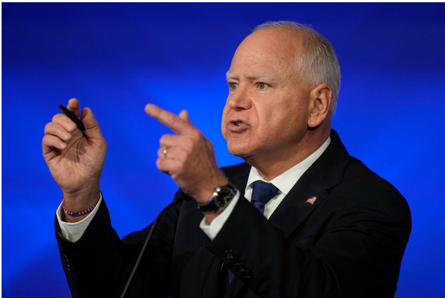
Тим Уолц.

предоставить впервые покупателям жилье до 25 тысяч долларов помощи, налоговые кредиты семьям, растящим детей, и напомнил, что Трамп вообще не платил федеральные налоги в течение 15 лет (факт-чекинг уточнил: тот не платил в течение 10 из 15 лет).