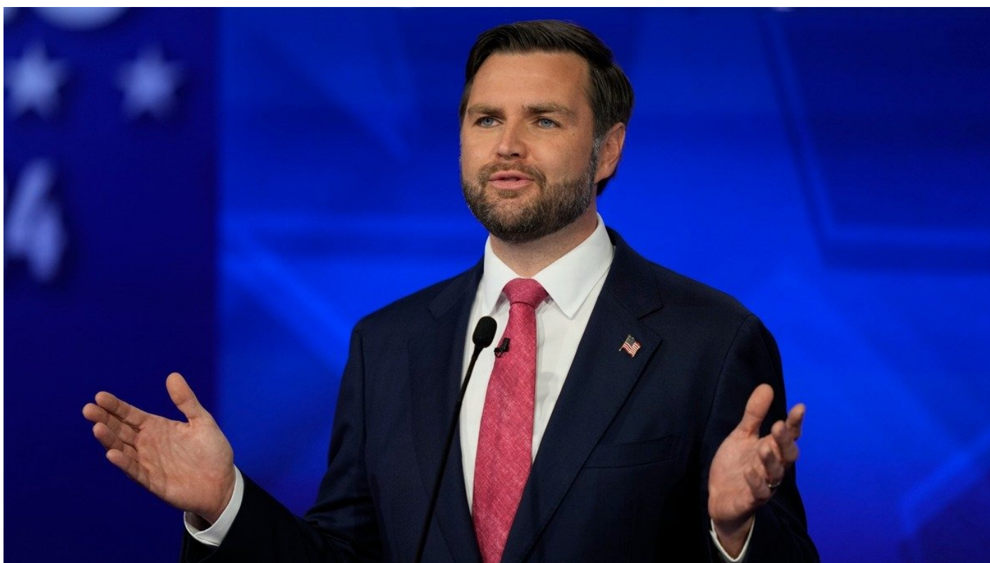
Джей Ди Вэнс.

Вэнса, который в преддверии выборов 2016 года называл Трампа «непригодным» и говорил, что тот «может стать новым Гитлером», спросили, как же он так сумел радикально измениться и могут ли американцы верить, что он в роли вице-президента даст Трампу советы, которые ему нужно услышать, а не те, которые он «хочет услышать». «Я был неправ», — ответил сенатор, обвинив СМИ в распространении ложных историй о Трампе, в которые он «верил».