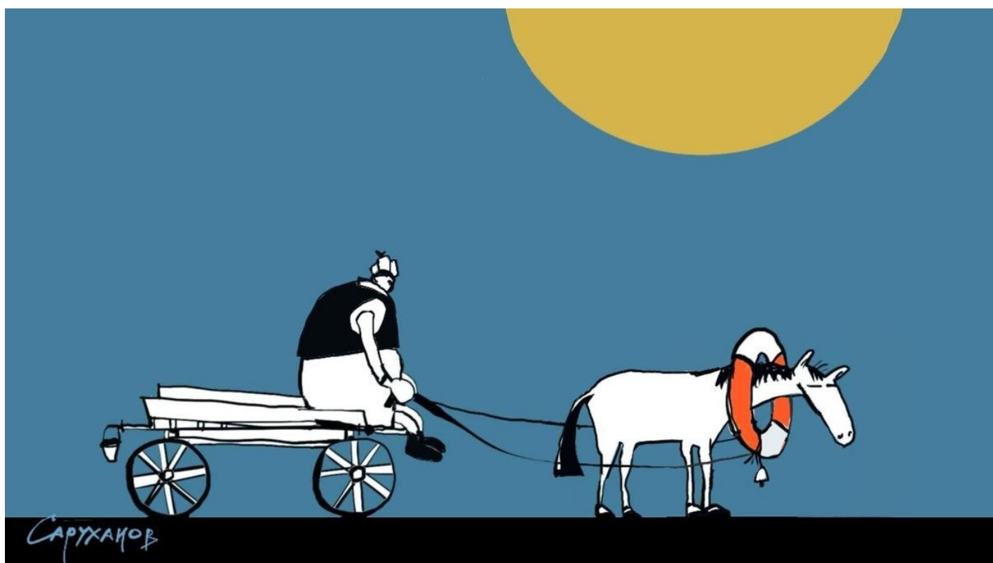
Иллюстрация: Петр Саруханов / «Новая газета»

Как в России формируется неофеодальное общество, которое может удержаться только на принципах современного крепостничества