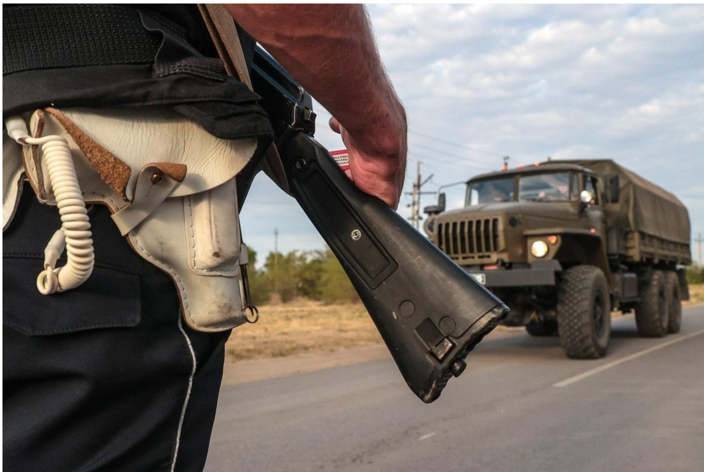
Суровикино. Обстановка у ИК-19 в Волгоградской области.

Те же, кто захватил заложников в Суровикино, не были осуждены за терроризм, скорее всего, они объединились, обозлившись на то, что никто не обращает внимания на их проблемы, их никто не слышит.