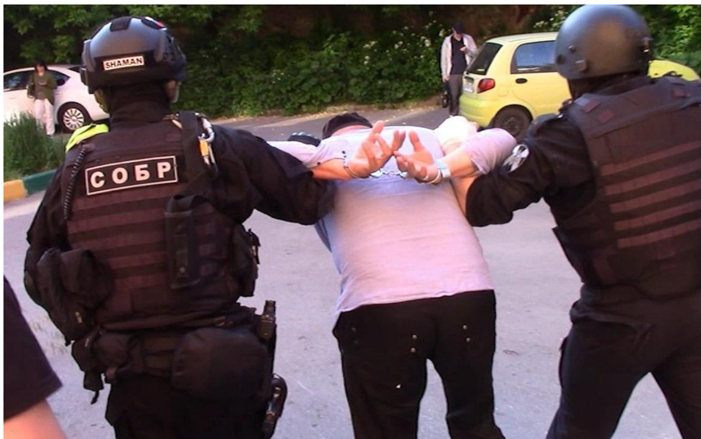
Задержание участника ячейки запрещенной в стране экстремистской организации исламистов «Таблиги Джамаат». Снимок с видео.