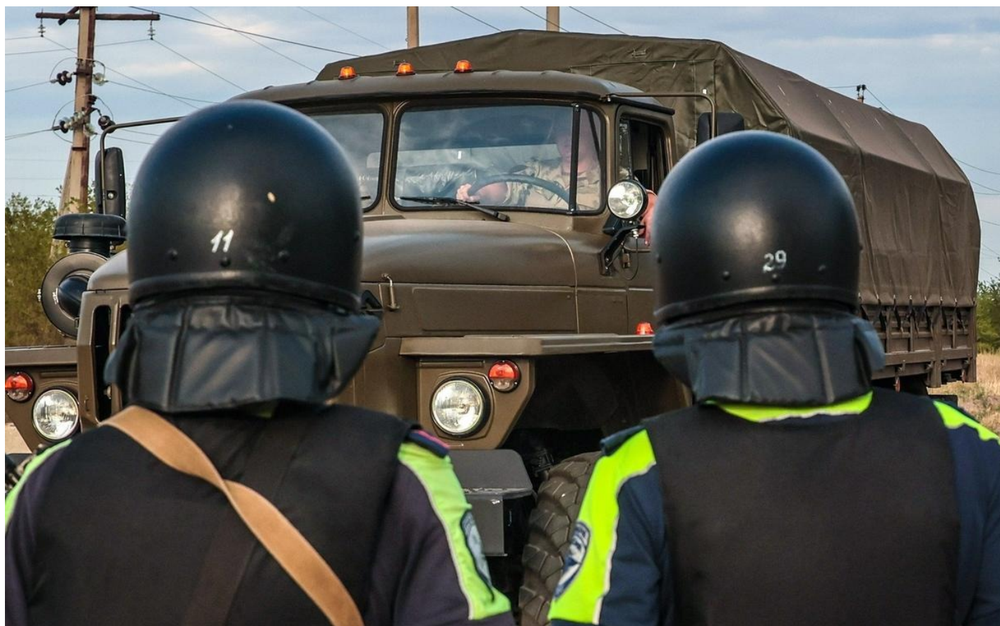
Суровикино. Обстановка у ИК-19 в Волгоградской области.