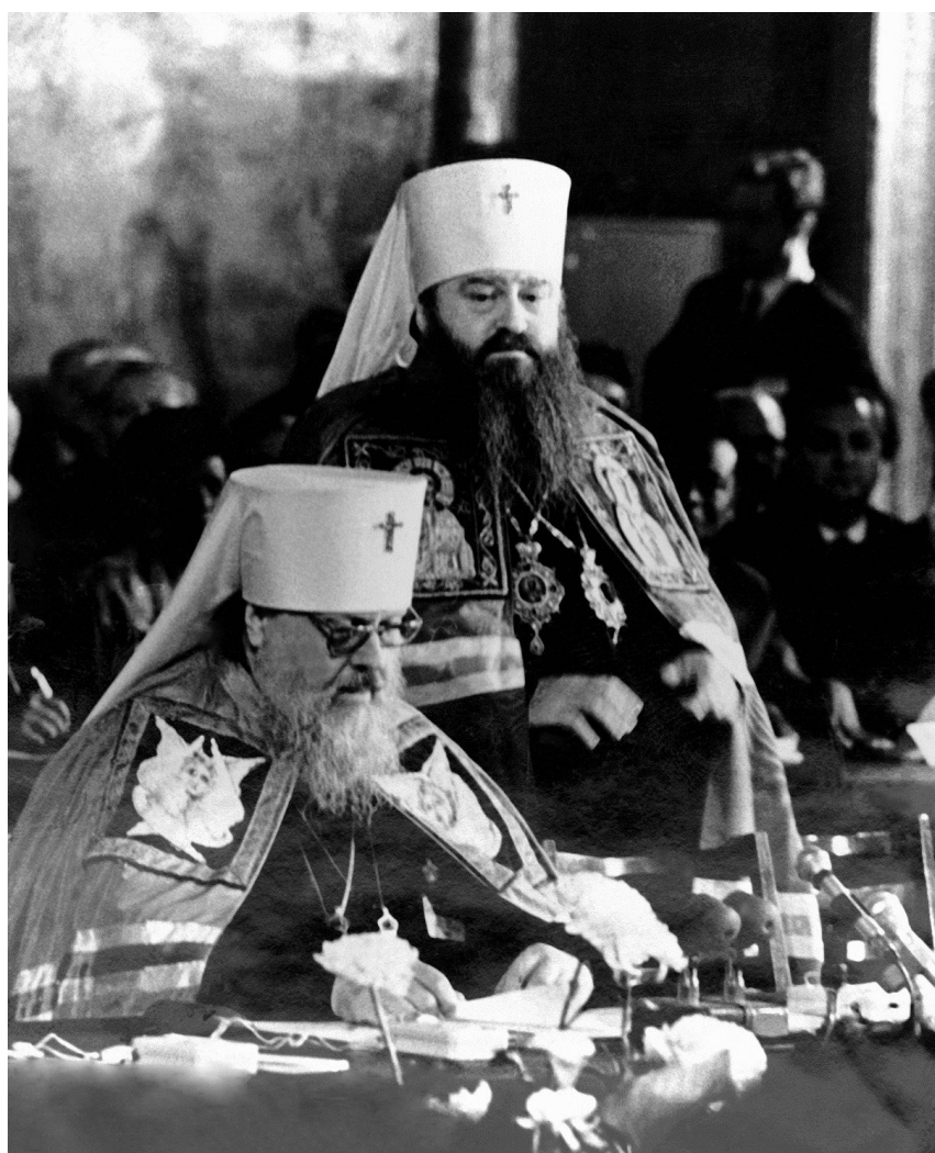
Митрополит Пимен и Митрополит Ленинградский и Ладожский Никодим.

сближении с католической церковью — наставник будущего патриарха скончался в 1978 году на приеме у папы. А в 1969 году по инициативе Никодима Синод РПЦ разрешил католикам принимать православные таинства, если у них нет доступа к священнику своей церкви. Логично, что именно Кирилл стал первым в истории московским патриархом, который встретился с папой римским (в 2016 году в Гаване). Кирилл и Франциск подписали тогда вполне экуменическую декларацию , в которой говорится об «общем духовном Предании» и «согласном свидетельстве истины» двух церквей.