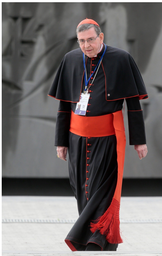
Кардинал Курт Кох.

Кардинал рассказал о своем контакте в первые дни СВО с митрополитом Иларионом (Алфеевым), тогда возглавлявшим отдел внешних церковных связей Московского патриархата. Обсуждалось совместное миротворческое заявление папы Франциска и патриарха Кирилла, но идея была отвергнута Москвой. Вместо этого Кирилл в середине марта 2022 года провел полуторачасовой диалог с папой, убеждая понтифика в обоснованности СВО ссылками на события в Одессе 2 мая 2014 года и на подлетное время ракет НАТО до Москвы. По итогам той беседы папа назвал Кирилла «алтарным мальчиком» Путина. С тех пор экуменических контактов РПЦ с католической церковью на высшем уровне не было. Все, что созидалось трудами еще митрополита Никодима с 1960-х, оказалось ненужным.