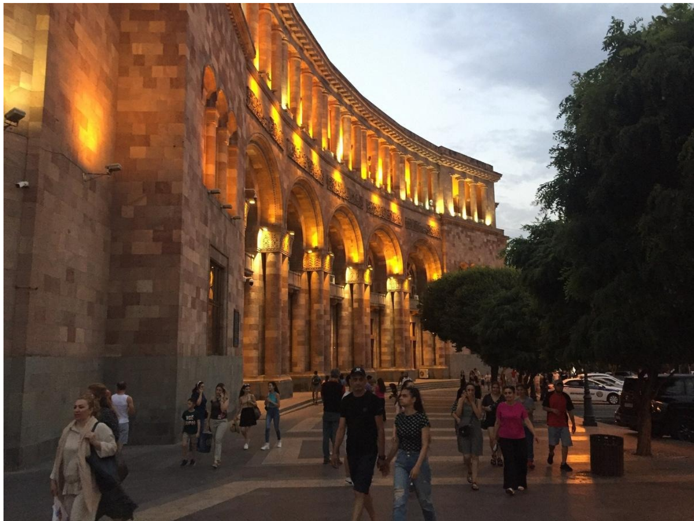
Ереван. Площадь Республики.

очень расслабленно относятся к бытовой коммуникации, видя, что практически всегда и везде местные жители понимают по-русски. Стимула учить местный язык у релокантов нет. Мне доводилось слышать раздражение из-за этого со стороны пары журналистов, с которыми я общался, но, по моим ощущениям, это все-таки скорее проблема низшего порядка.