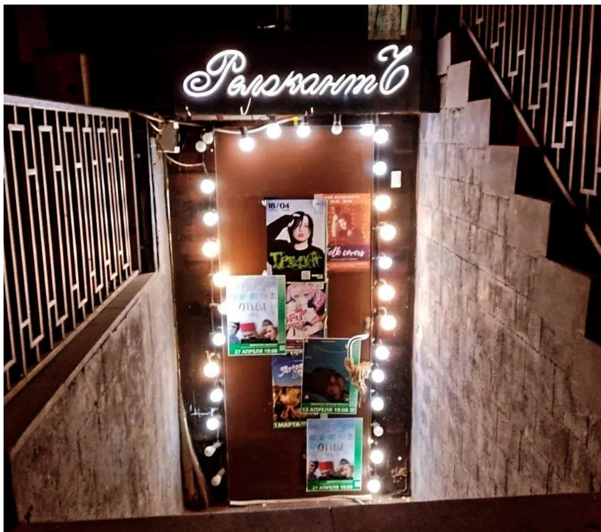
Бар «Релокант» в Ереване.

— Кто эти россияне, которые остались в Армении?