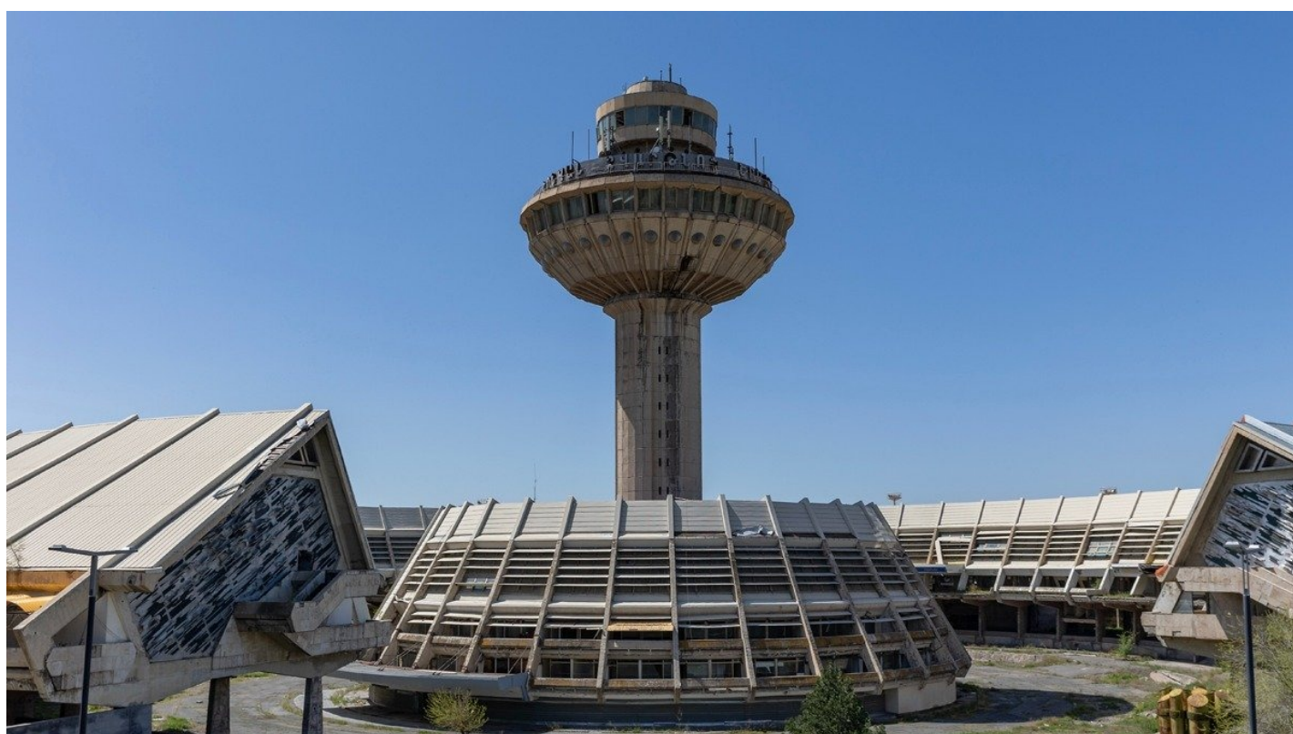
Аэропорт «Звартноц».