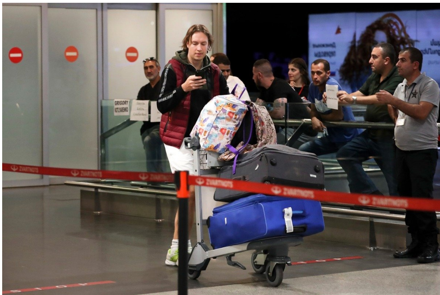
Аэропорт «Звартноц». Зона прилета.

— Да, стало намного выгоднее иметь его. Плюс, насколько я понимаю, была распространена ситуация, когда сюда переезжали семьи, но один из членов семьи — чаще жена — продолжал жить на две страны, то есть продолжительное время ездить между Россией и Арменией, потому что переехать полноценно сразу обоим сложно из-за бытовых вопросов. Такой член семьи мог очень долго находиться в некоей «серой» зоне. Не очень понятно, как считать для статистики таких людей.