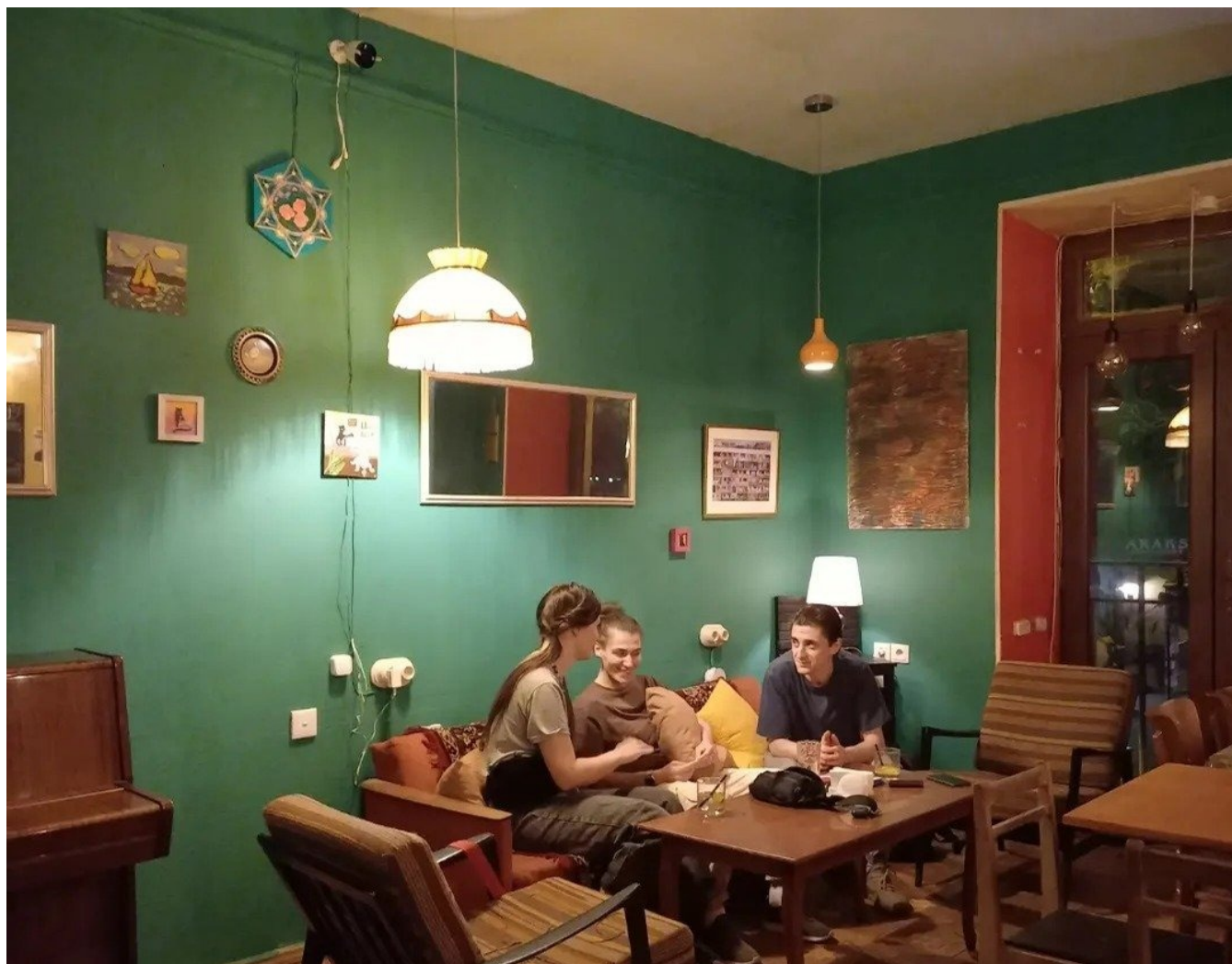
Кафе «Мама Джан» с начала 2022 года стало очень популярным местом для эмигрантов.

правительству, но при этом там очень четко прослеживалась такая логика, что претензии направлены к Путину, к Кремлю, Москве, но они не направлены против россиян, против владельцев российских паспортов. И несмотря на очень сложный политический кризис в отношениях между Москвой и Ереваном, армянское общество не стало относиться к россиянам хуже.