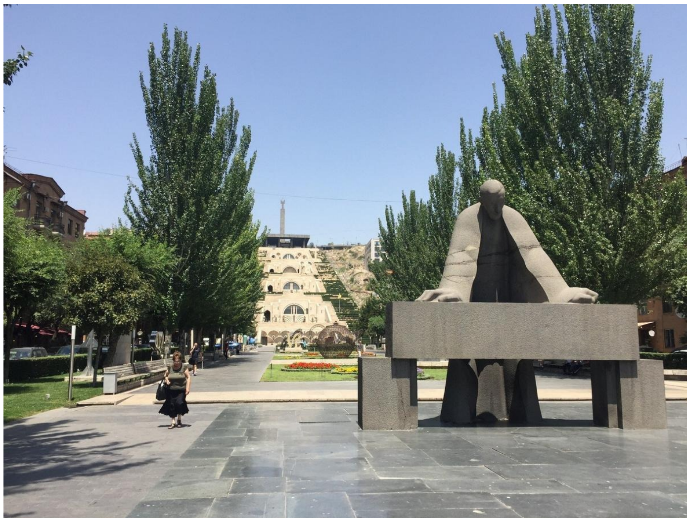
Ереван. Каскад.

бытовых проблем, с которыми сталкиваются люди.