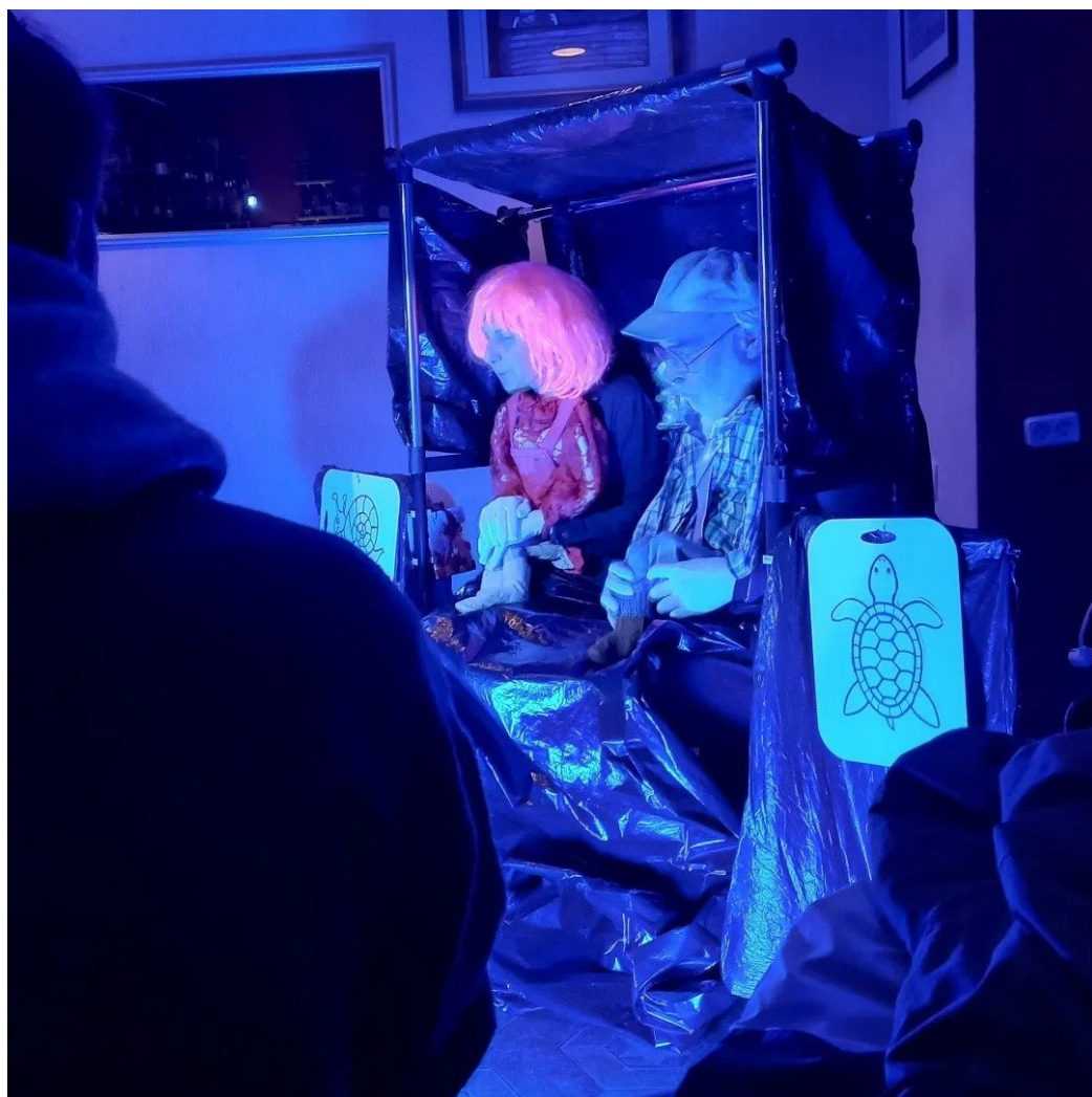
Спектакль для детей в кафе «Мама Джан».

— А изменилось ли отношение армян к россиянам за эти два года?