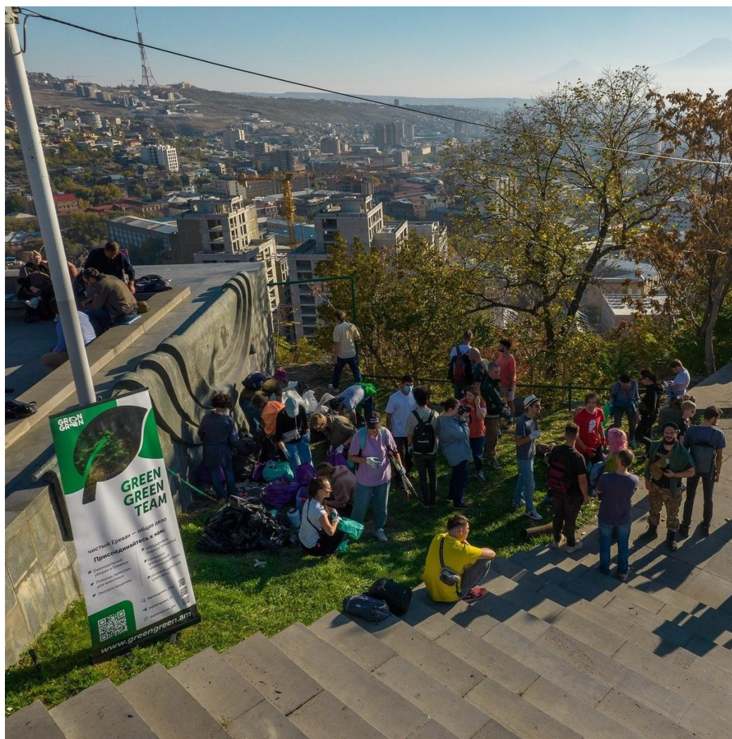
Инициатива эмигрантов — сделать Ереван чище.

— Насколько по-прежнему сильно настроение «просто переждать»?