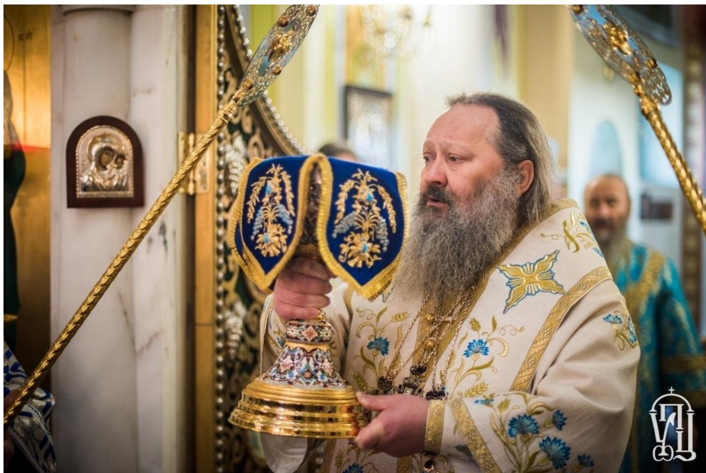
Митрополит Павел (Лебидь).

какой эти структуры занимаются собственно религиозной деятельностью. В той же степени, в какой они заходят на чисто политическое поле, да еще и в условиях военного времени, приходится вести разговор не в категориях религиозных свобод, а в категориях политической пропаганды.