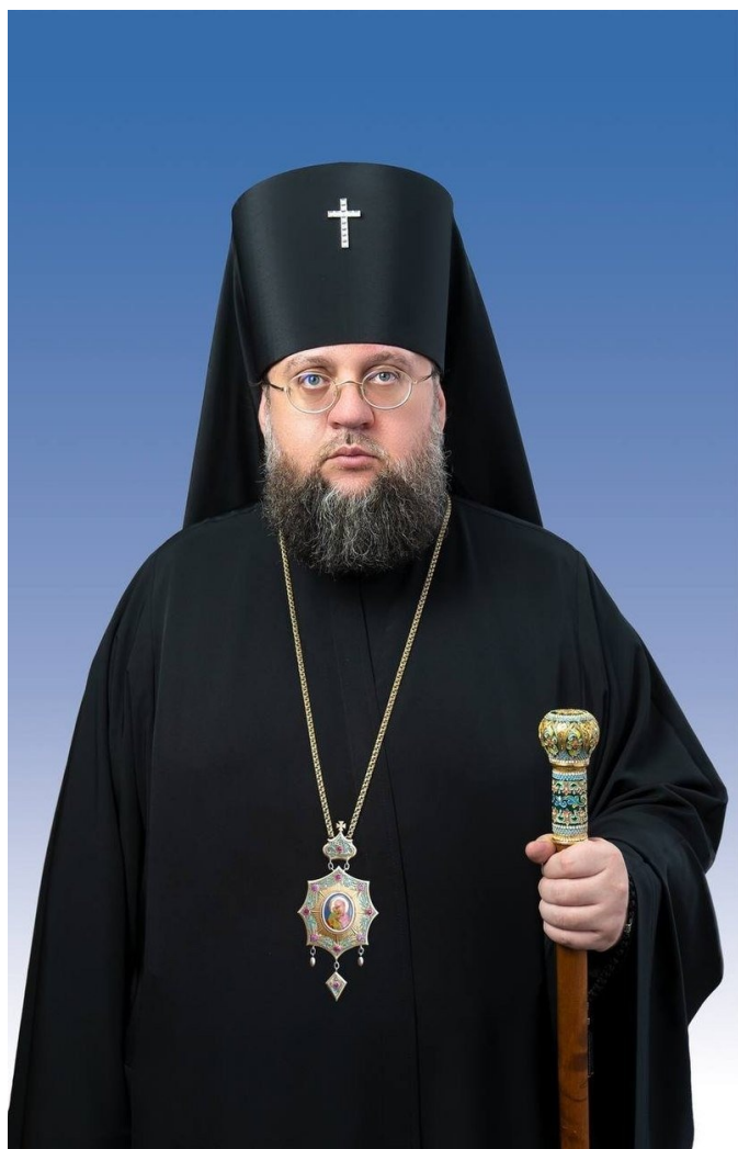
Архиепископ Сильвестр (Стойчев).

В тот день, когда ПЦУ пыталась занять соборы в Черкассах и Кременчуге, УПЦ провела в Киеве международную конференцию «Духовное и светское образование». Несмотря на нейтральное название, в центре внимания форума был поиск выхода из тупика, в котором оказалась УПЦ из-за СВО. Программный доклад произнес ректор Киевской духовной академии УПЦ архиепископ Сильвестр (Стойчев). Он назвал мудрым решение киевского собора 2022 года не провозглашать автокефалию, а выбрать, так сказать, «переходный статус» — ожидания автокефалии УПЦ. Однако просить ее надо не у Москвы, которая по-прежнему считает себя высшей инстанцией для УПЦ и автокефалии не даст, а у всего мирового православия. Так сказать, консенсусно. Самый очевидный с точки зрения властей Украины и Константинопольского патриарха путь — присоединение к уже имеющейся автокефальной ПЦУ — для УПЦ неприемлем. Переход на