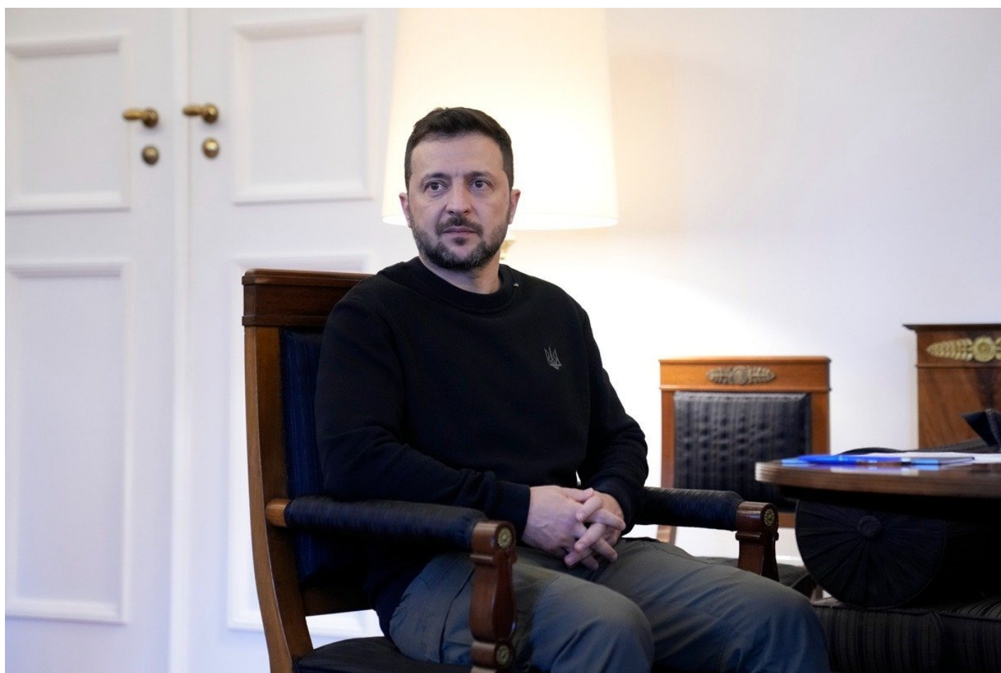
Владимир Зеленский.

Как рассказал «Новой» источник, близкий к Константинопольскому патриархату, в послании было предложение о начале переговоров на условии прекращения перехода храмов из УПЦ в ПЦУ. В августе для уточнения деталей в Киев приезжали экзархи (посланники) Константинопольского патриарха, которым Зеленский предлагал повысить статус Украинской церкви до патриархата.