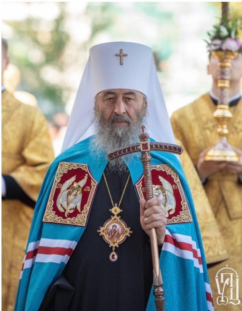
Митрополит Онуфрий (Березовский).

чисто политическую структуру, которая исполняет диверсионные функции. Произошло размежевание и внутри самой УПЦ, в епископате которой отчетливо выделились три фракции: сторонники полного разрыва с Москвой и сближения с Константинополем; сторонники обострения и «мученического венца»; неопределившееся «болото».