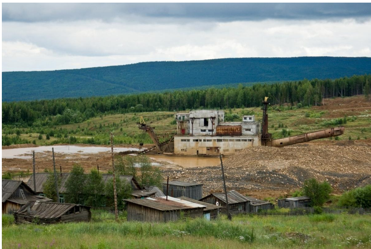
Партизанск. Драга. Домов на переднем плане в документах нет. Значит, можно мыть золото.

Пришло новое руководство с теми же примерно подходами и результатами. Подобных обращений по Сисиму и Сейбе незадолго до катастрофы в красноярский Росприроднадзор было шесть.