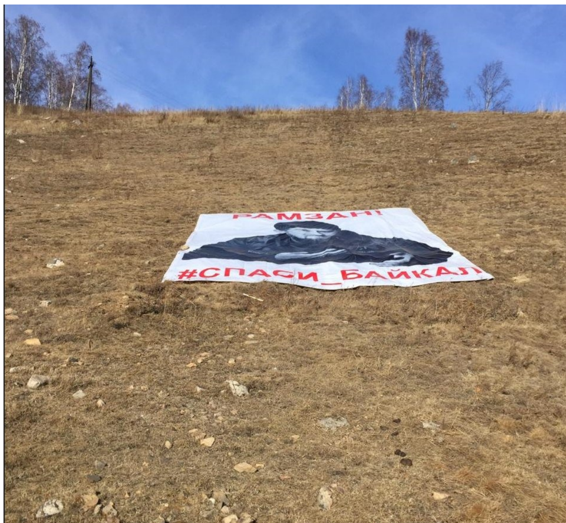
Байкал, пос. Култук, 2019.

Что без Колотова они будут делать? Зачем эти выстрелы себе в ногу? Кому как не красноярцам понимать правоту эколога Колотова?