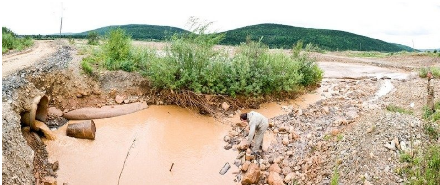
Речка Большая Мурошная, приток Ангары. Раньше здесь водились таймень, ленок, хариус.