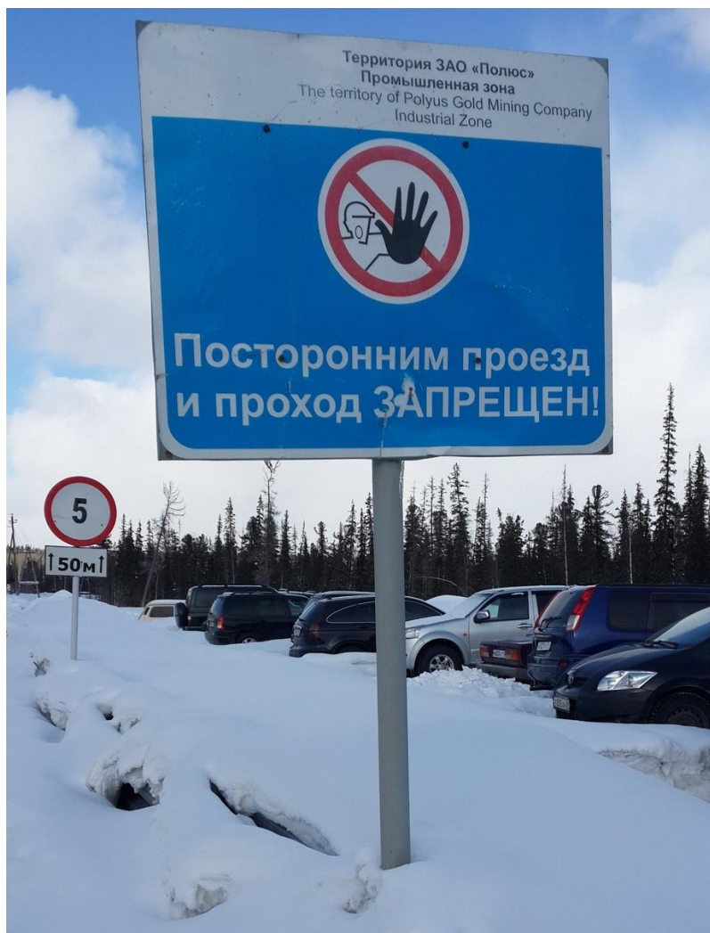
Территория золотодобывающей промышленности. Северо-Енисейский район Красноярского края.

В случае с Колотовым, однако, чтобы сомнения не терзали, издание подчеркивает: оно получило «материалы» на эколога из прокуратуры и других правоохранительных органов.