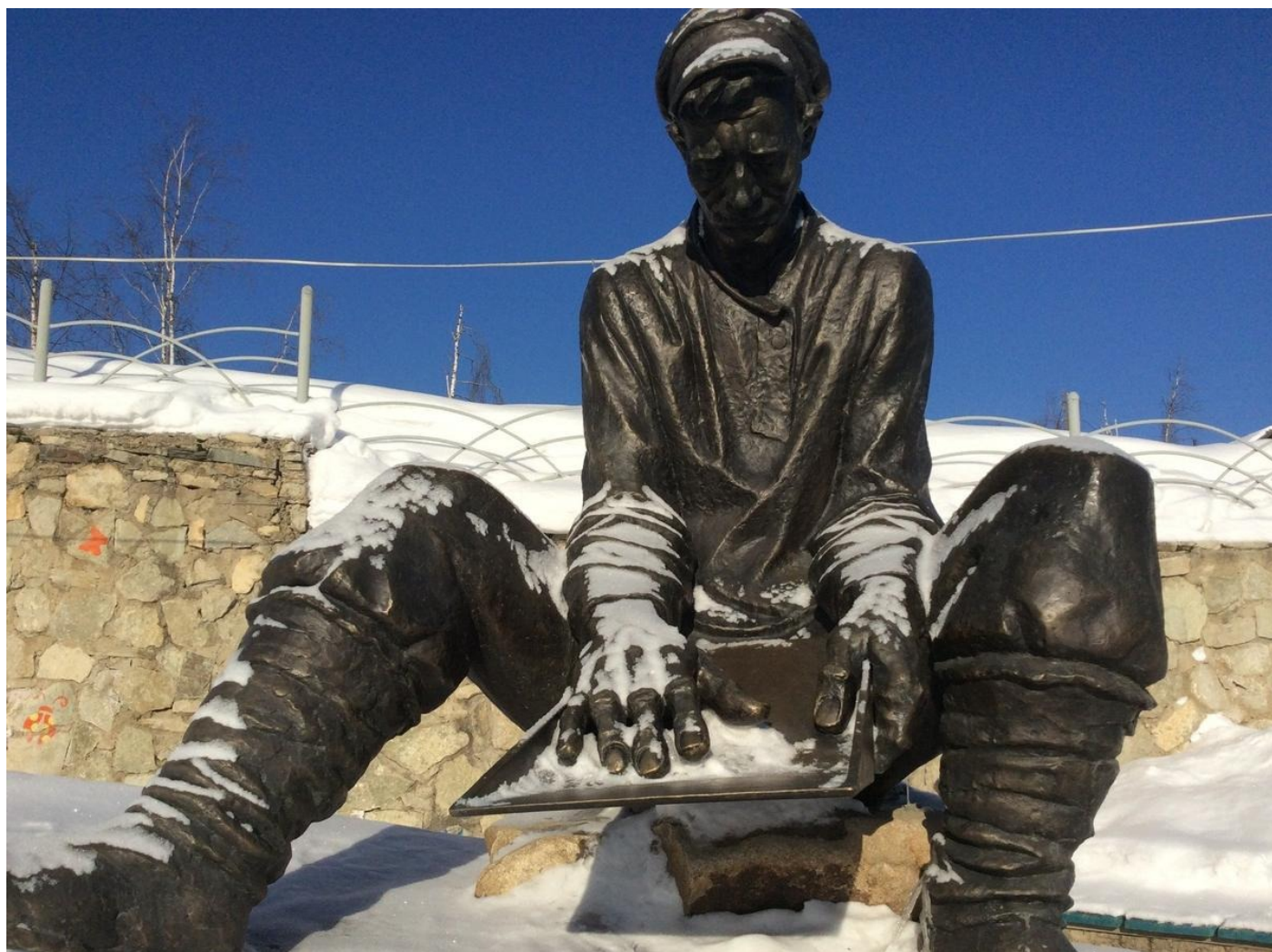
Старатель в поисках золота. Главный монумент в центре Северо-Енисейского. Красноярский край.

Дамба отсутствовала в реестре Ростехнадзора, поэтому не проверялась, но вообще сооружение значительное и вовсе не невидимое. Ее отлично видели все вокруг, ее было видно на космоснимках, Колотов с коллегами, как и местные жители, начали предупреждать власти, вплоть до президента России, о неминуемой катастрофе за год до того, как она разразилась.