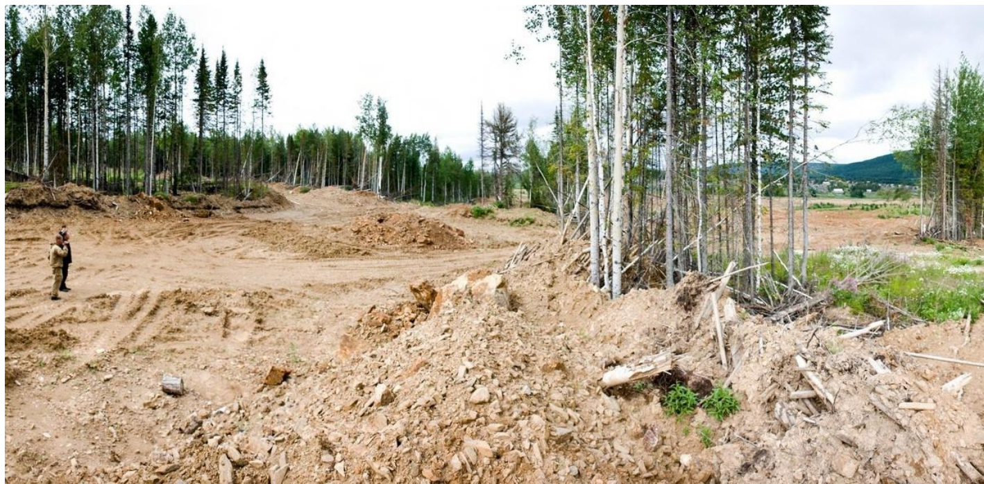
Беда Партизанска (Красноярский край) в том, что стоит на золоте. С золотодобытчиками боролась Плотина.

ему все по полкам, совместил с интерактивной электронной картой недропользования РФ, чтобы сомнений не оставалось: вероятные источники загрязнения — вот здесь, это месторождения россыпного золота, находящиеся в пользовании ООО «Сисим» (чью дамбу и прорвало, чьи рабочие погибли).