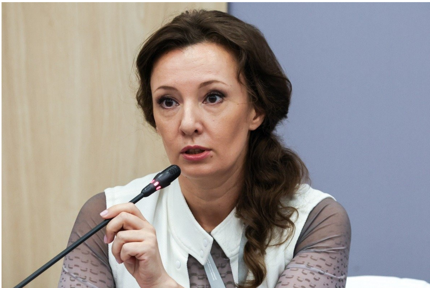
Вице-спикер Госдумы РФ Анна Кузнецова во время сессии «Защита традиционных ценностей. Свои и чужие».

Сам по себе перечень «традиционных ценностей», в общем, не вызывает никаких возражений: