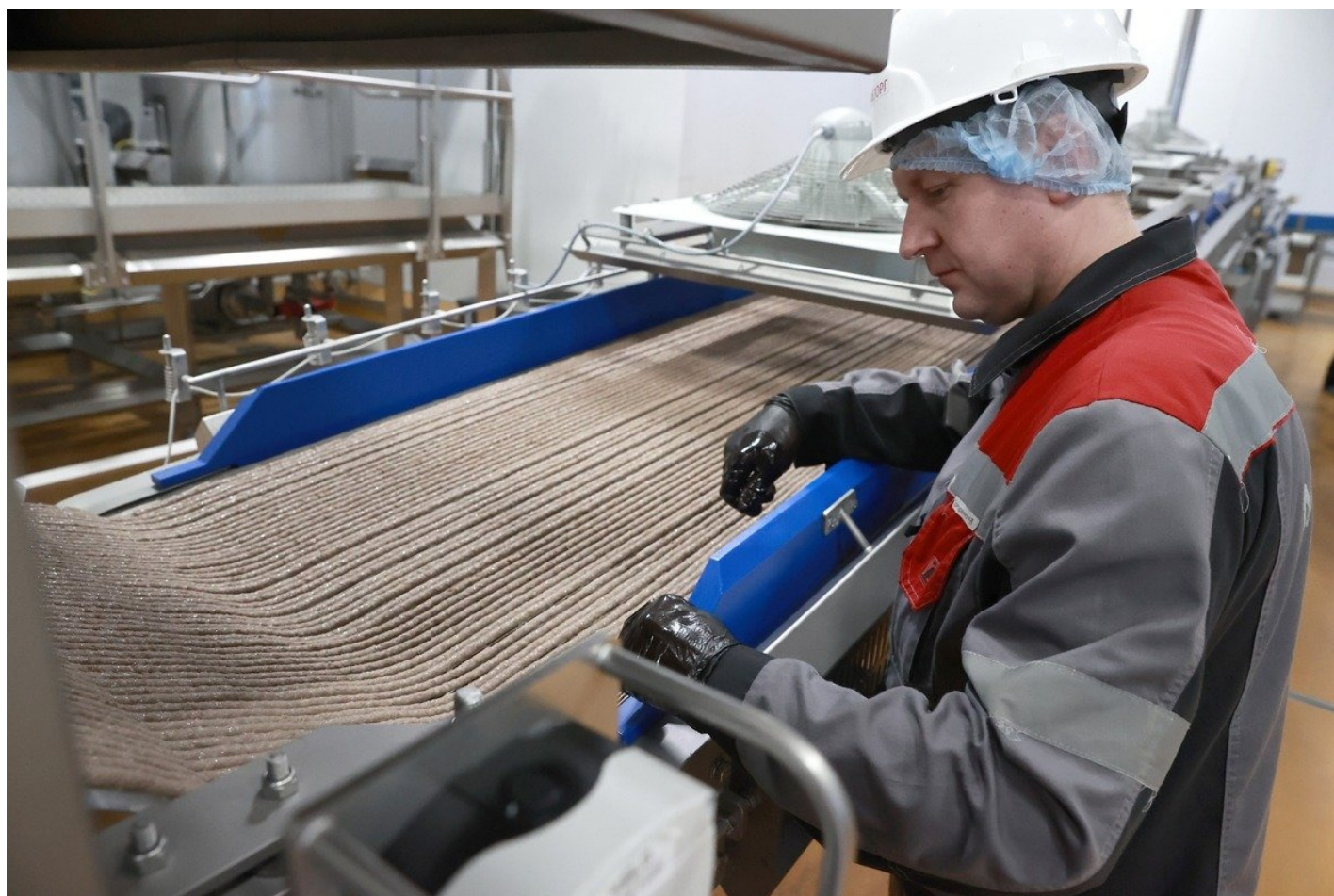
Производство кормов для домашних животных на заводе «Мираторг» в Курской области.

— Кошатники, обсуждая эту ситуацию между собой, выдвигают разные версии. В том числе такую, что некоторые корма якобы сознательно выдавливаются с рынка для того, чтобы освободить нишу для «Мираторга» (компания начала производить корма для домашних животных в 2019 году, а в 2023-м анонсировала трехкратное увеличение производства влажных кормов. — И. Ж.). Мы люди взрослые, умные — представляем, кому принадлежит «Мираторг» ( Forbes писал , что компания может быть связана с семьей бывшего премьер-министра, а ныне зампреда Совета безопасности РФ Дмитрия Медведева, в правительстве РФ это опровергали . — И. Ж.), — говорит Анна.