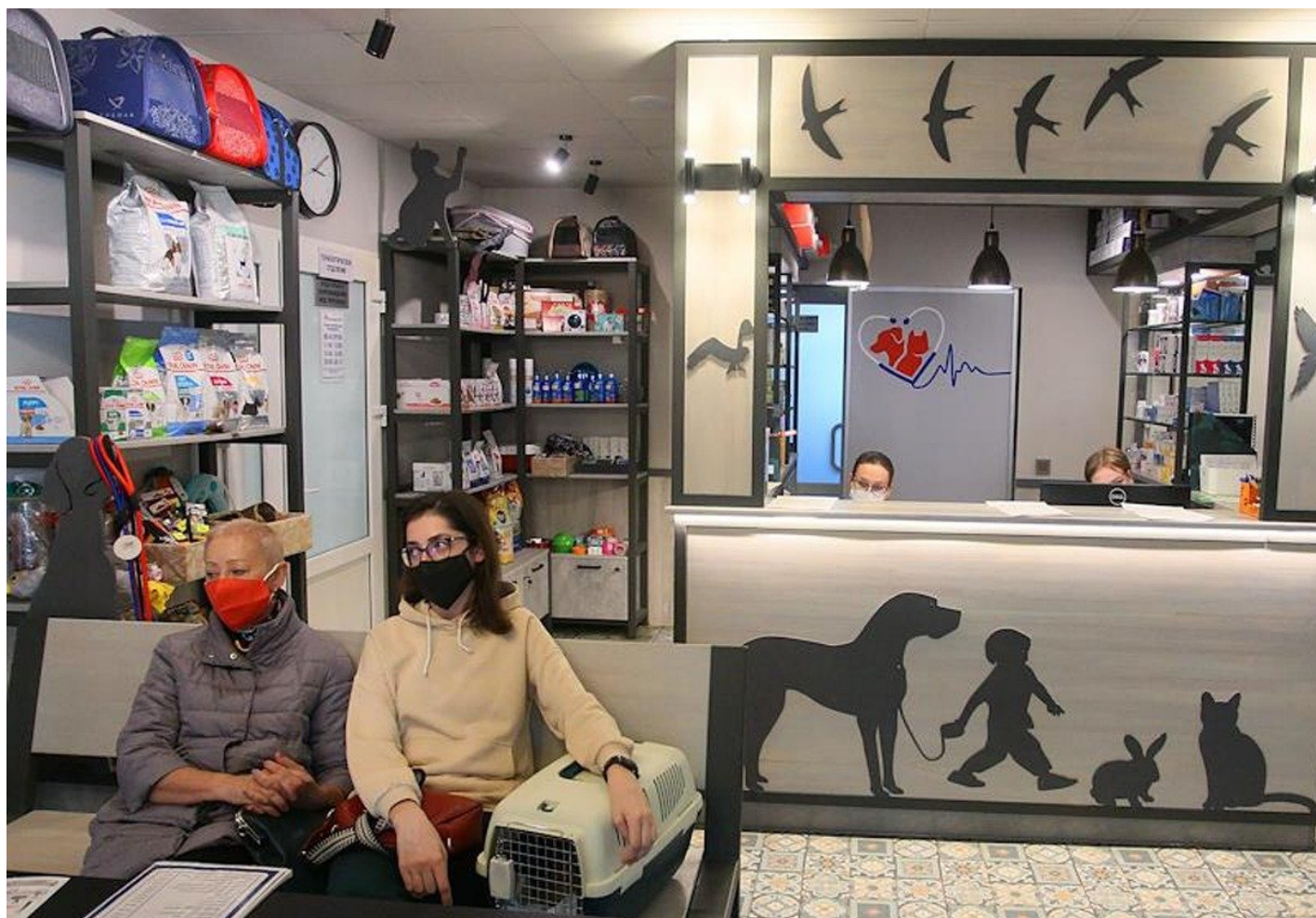
В ветеринарном госпитале.

Но бывает и так, что мошенники не исчезают, продав «воздух», а присылают поддельные препараты.