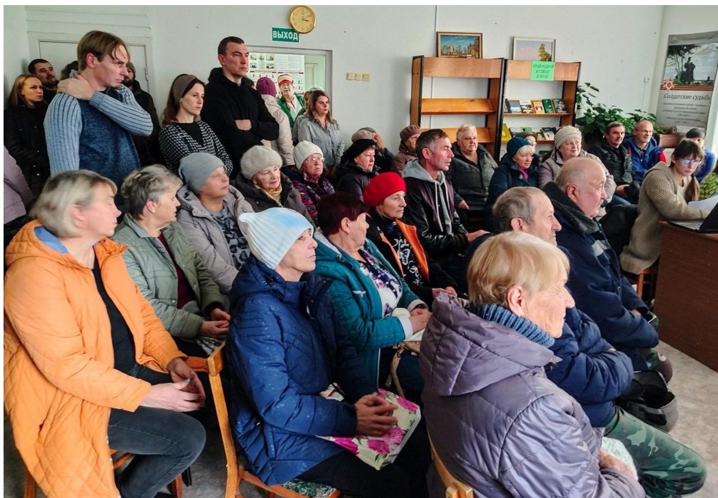
На слушаниях.

Публичные слушания по проекту нового Генплана и Правил землепользования и застройки Шелтозерского веппского сельского поселения Карелии собрали полный зал в местной библиотеке. Жители старинного села Шелтозера не скрывали: они пришли защитить от застройки свой берег Онежского озера, где находятся объекты культурного наследия и территория традиционного природопользования коренного малочисленного народа, которым являются веппсы. И хотя представители администрации Прионежского района Карелии, которая подготовила проект нового Генплана и Правил землепользования и застройки муниципального образования, уверяли, что этот проект является только «черновиком», а регламент слушаний не предусматривает голосования, собравшиеся в сельской библиотеке настояли на голосовании по всем своим предложениям.