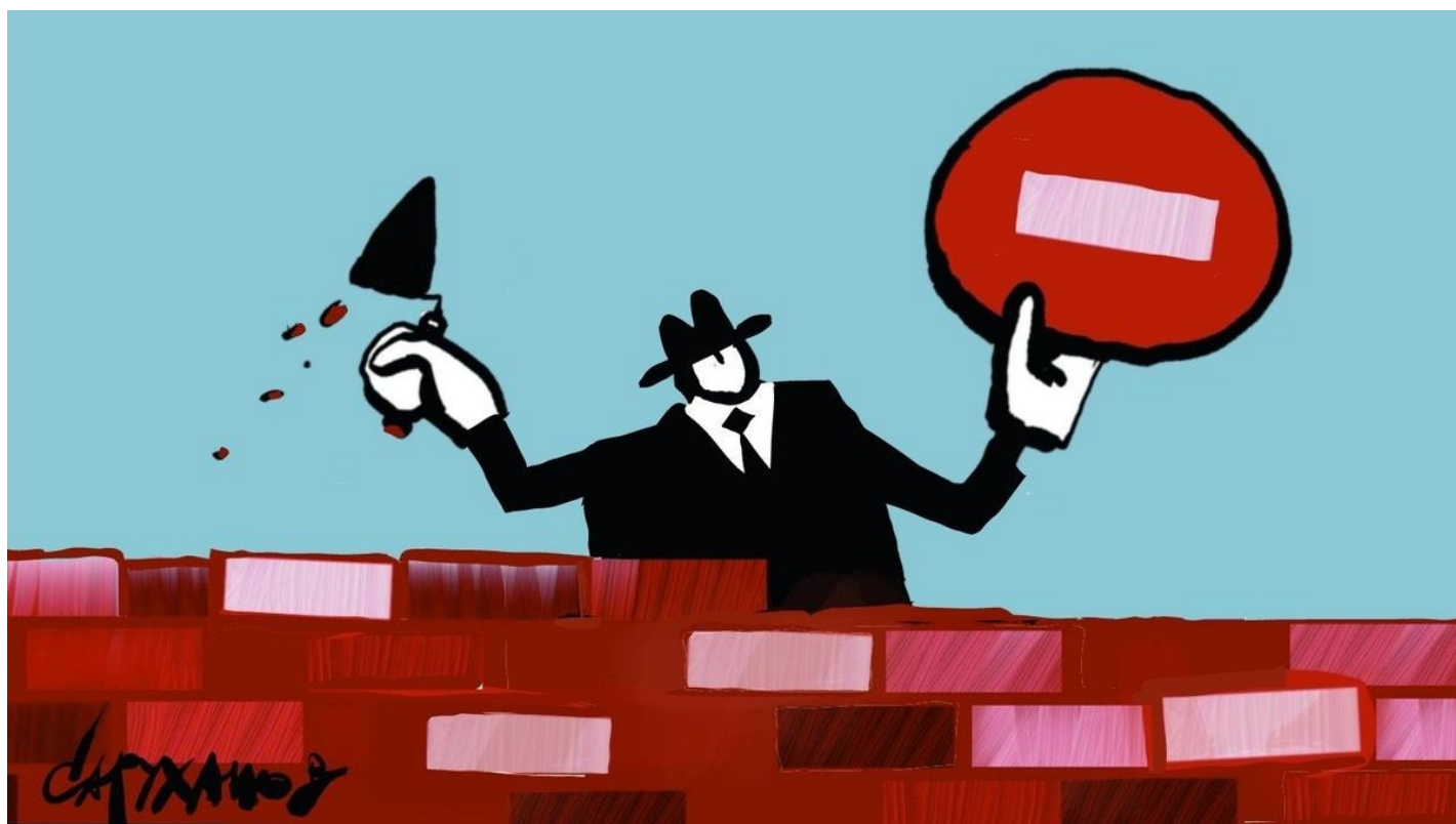
Иллюстрация: Петр Саруханов / «Новая газета»

Откуда и как берутся запреты и почему их становится все больше. Антрополог Роман Шамолин — о двух типах культуры