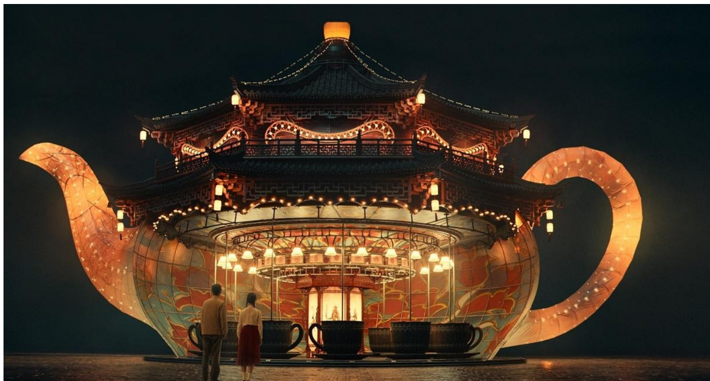
Кадр из фильма «Декодер. Игра гения»

Сценарий довольно сумбурный. Сцены снов в духе «Облачного атласа» с нолановским размахом: красные пески, киты, морское дно, спирали лестничных пролетов, двери, не ведущие никуда, гигантские светящиеся шахматы, получеловек-полуморж, стреляющий яйцами. И поднебесное чертово колесо, которое разрушается так же, как сознание декодера. Говорят, разгадка шифра довела до безумия многих гениев.