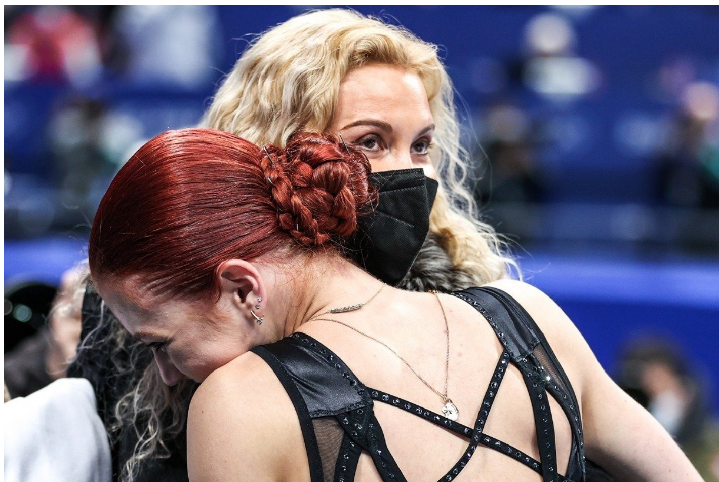
Пекин. Олимпиада-2022. Этери Тутберидзе и Александра Трусова.

план. Во-первых, из-за скандала, связанного с дисквалификацией всеобщей любимицы Камилы Валиевой. Во-вторых, из-за шоу, устроенного Александрой Трусовой.