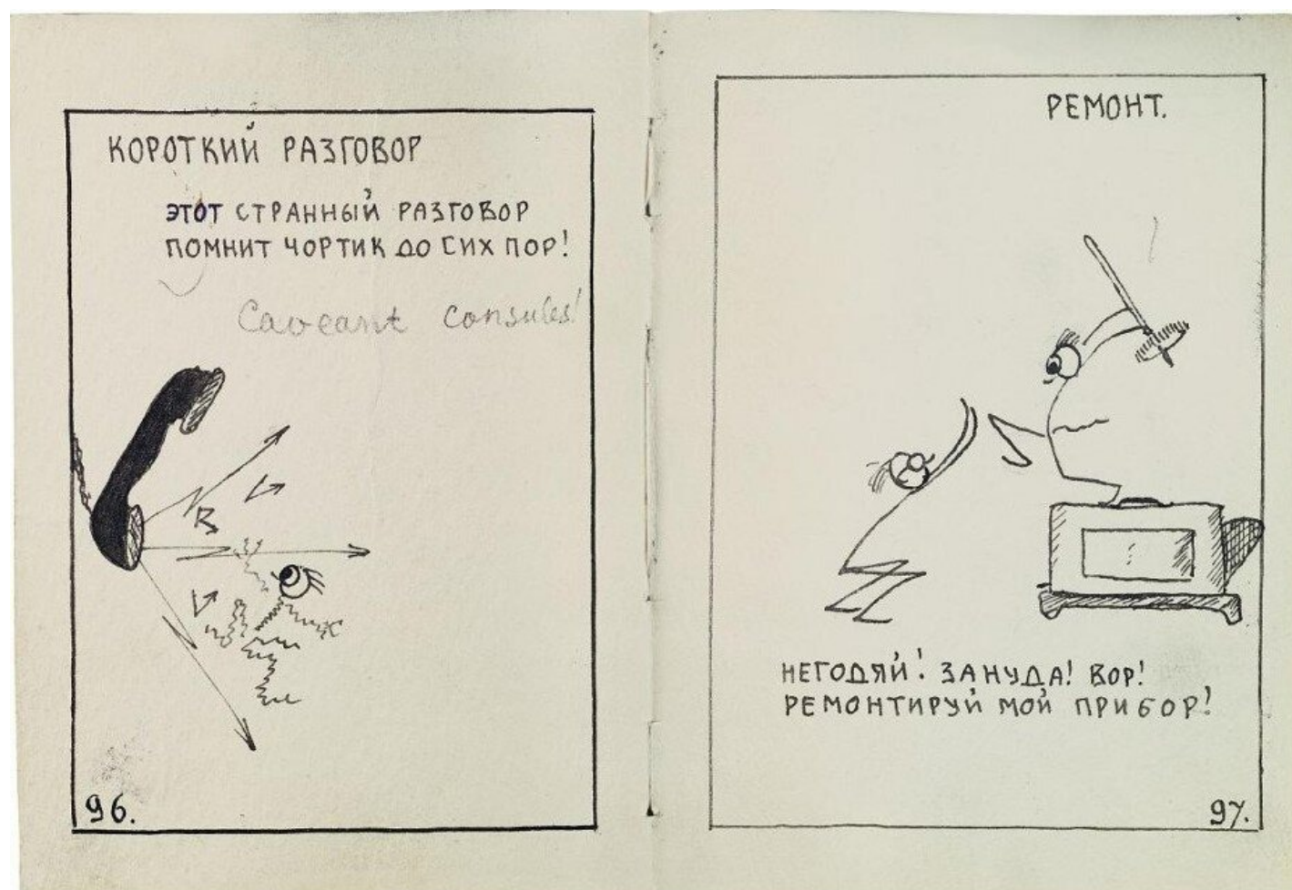
Страницы книги «Метео-Чертик. Труды и дни. 1941»

вместе с братом пришедшем в редакцию «Новой» после публикации «Книжечки», есть эпизод о жизни на поселении вместе с их мамой, дружившей с Раницкой. «Мы с братом ловили тушканчиков, сусликов, хомяков. Никогда не забуду: попадутся в капкан, и так «пшшшшш», бросаются — испугать нас хотят». Вот и нас страшат изо всех сил и загонов, но, согласитесь, как-то стыдно пугаться мелких хищников. Посмотрите на неунывающего чертика!»