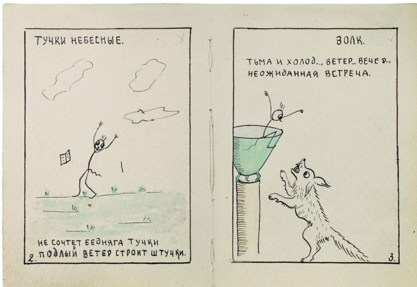
Страницы книги «Метео-Чертик. Труды и дни. 1941»

Это стало главной задачей и для Музея истории ГУЛАГа с момента его открытия в 2001 году: дать представление о том, какое множество народу не выжило на этой стройке коммунистического рая. Сохранить личный опыт заключенных и память о них стало не просто работой, а делом жизни сотрудников музея. Личные травмы, личные страдания складывались музейщиками в картину невероятных испытаний, ужас перед которыми заставлял посетителей задуматься о нашей истории, губительной и для страны, и для человека.