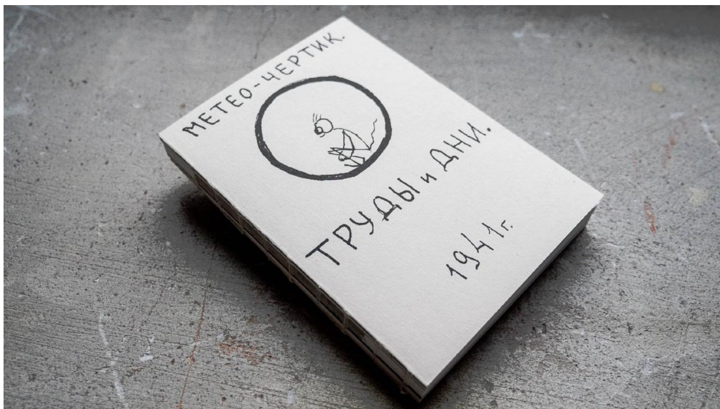
Обложка книги «Метео-Чертик. Труды и дни. 1941»

Может ли властное устранение «Музея истории ГУЛАГа» скрыть правду о репрессированных? История необычной публикации