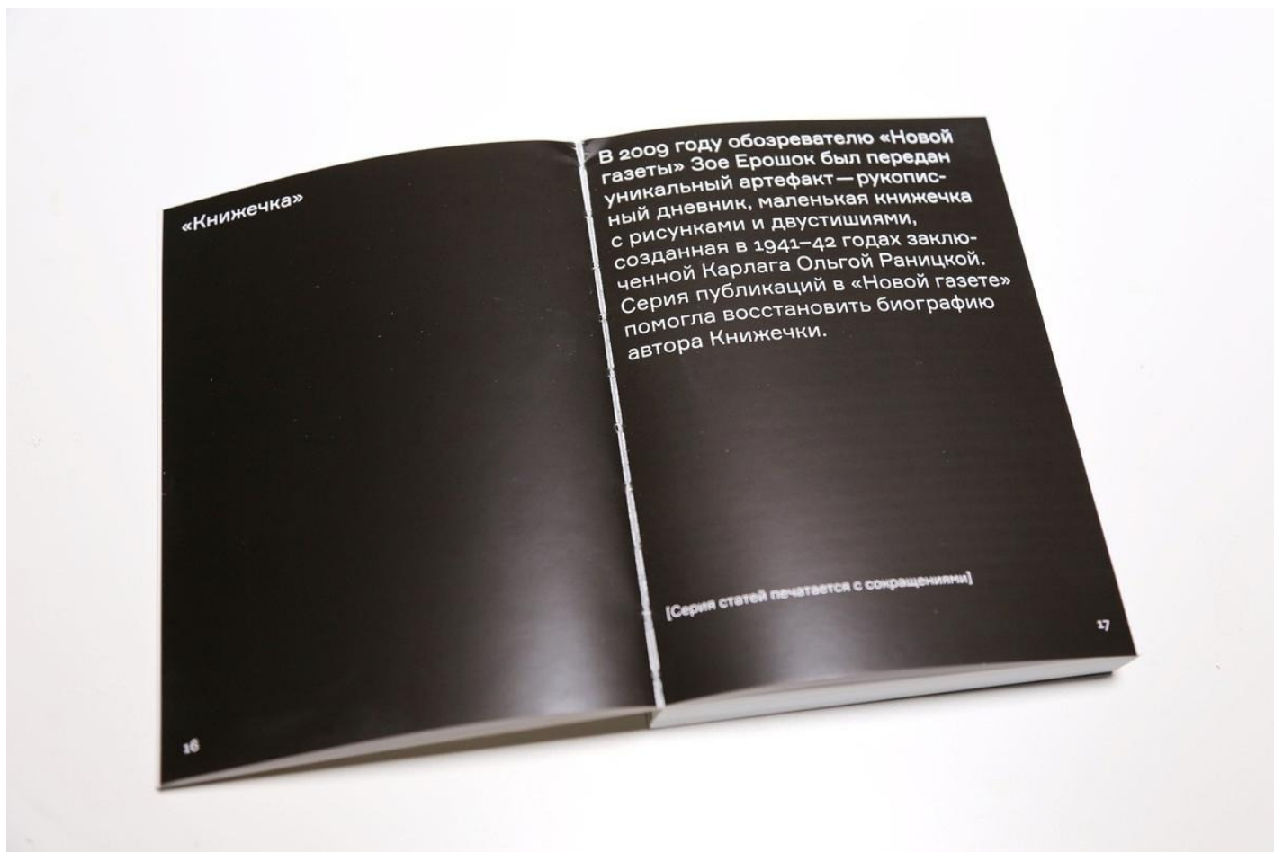
Страницы книги «Метео-Чертик. Труды и дни. 1941»