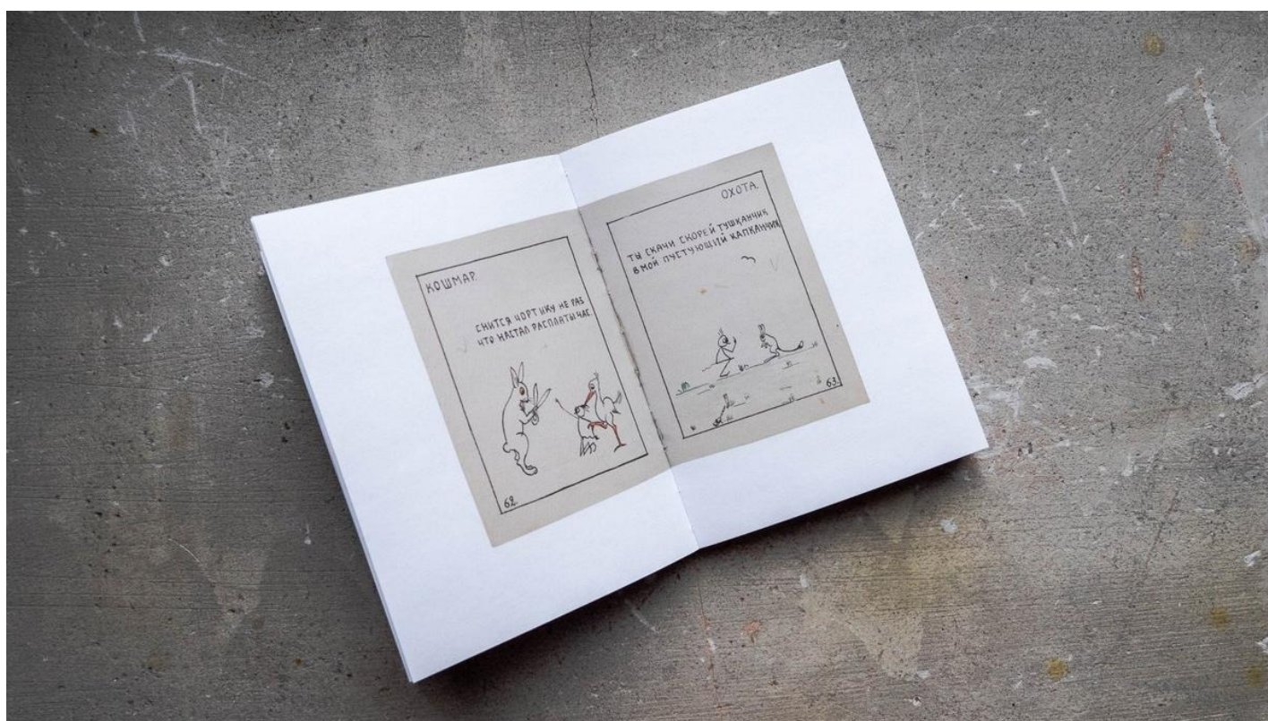
Страницы книги «Метео-Чертик. Труды и дни. 1941»

Кроме лагерного дневника напечатаны ее стихи — утешение и отдушина для ее талантливой и деятельной натуры.