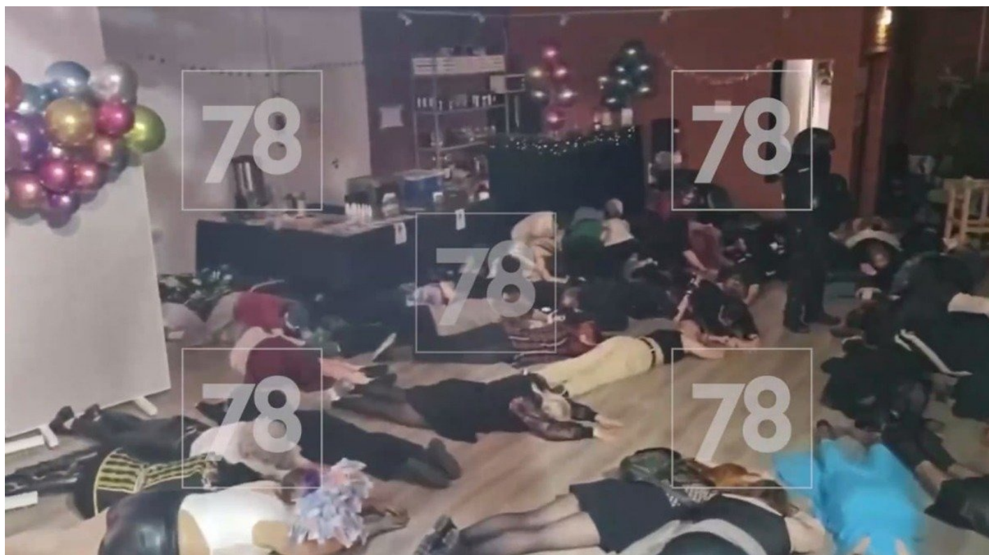
Полицейские также ворвались на закрытую вечеринку в ДК Крупской.

Мероприятие «Круги свободы» проходило в лофте «Явление», его не анонсировали в интернете. Там присутствовало около 50 человек. «Это было закрытое мероприятие для близких по духу людей, междусобойчик, адрес не знал никто, кроме этих близких», — рассказала «Бумаге»** одна из участниц.