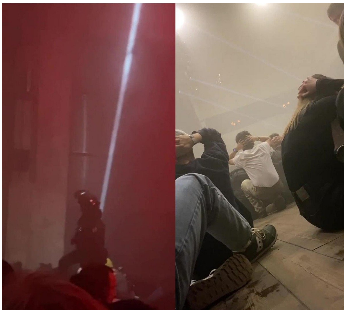
Рейд в одном из клубов.

Аналогичные рейды прошли и в московских клубах. В ночь на 30 ноября силовики пришли с рейдами в клубы Арма и Моно. Посетителей Арма сначала заставили лечь лицом в пол. Потом им велели сидеть на полу, это продолжалось как минимум полтора часа. Кроме этого, как пишет MSK1, гостей клуба стали выборочно досматривать. Участники вечеринки в Моно сообщают, что их уводили в автозаки.