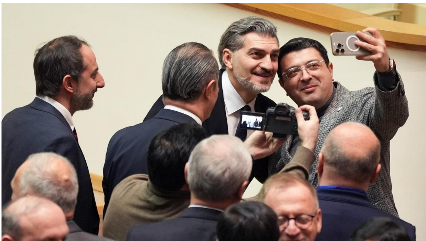
Михаил Кавелашвили (второй справа) и члены коллегии выборщиков в парламенте Грузии.

В субботу в Грузии прошли выборы президента из одного кандидата. Намечается схватка за президентский дворец