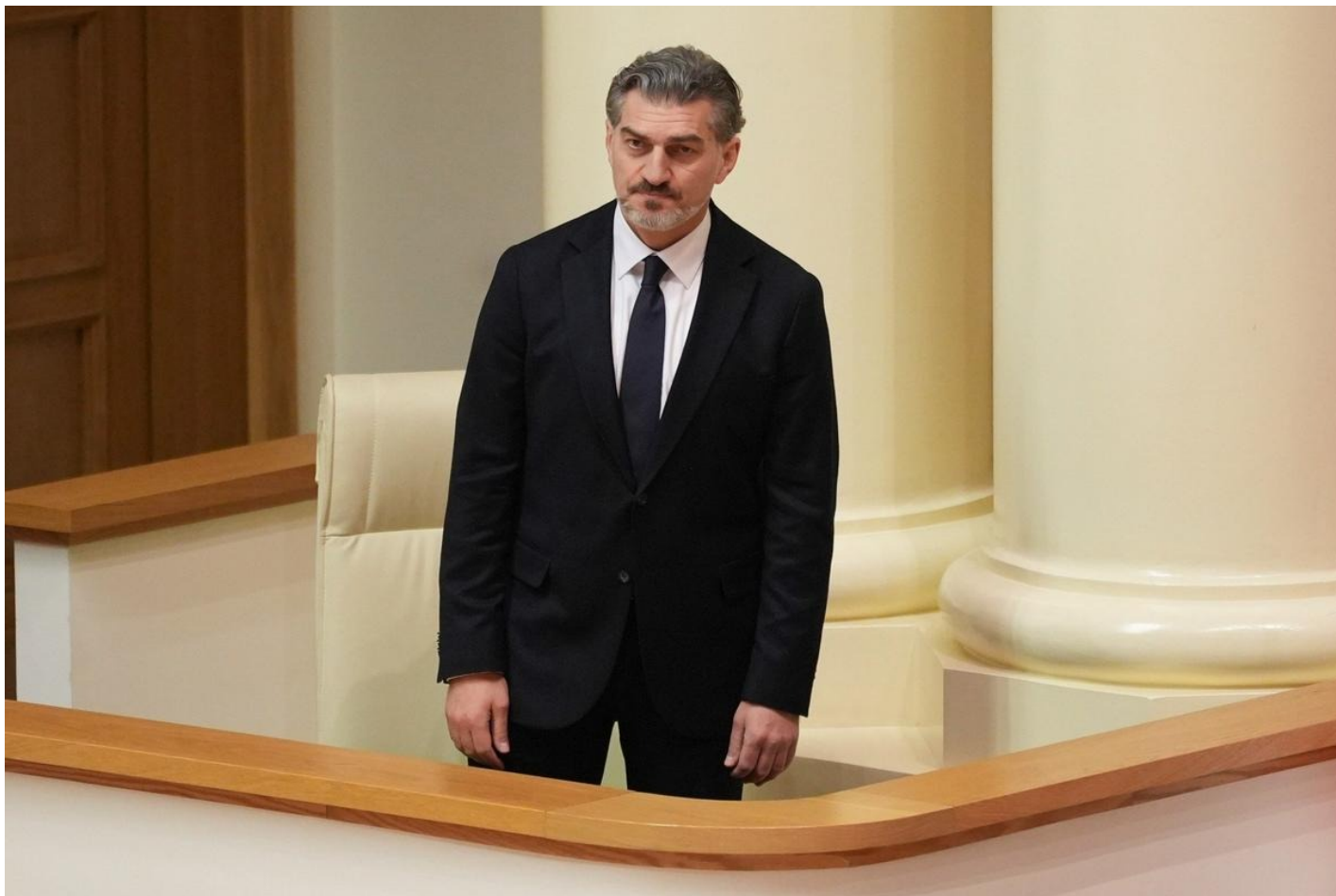
Михаил Кавелашвили в парламенте Грузии.

Возможно, если бы Кавелашвили и в мыслях своих предполагал, что когда-либо будет выдвинут на пост президента, то вел себя по-другому на заседаниях парламента. Будучи депутатом законодательного органа нескольких созывов от ГМ, он часто ругал оппозиционеров самыми нелитературными выражениями, влезал в драки и потасовки, а выступая с трибуны или участвуя в ток-шоу на проправительственных телеканалах, примерно в тех же выражениях отзывался о некоей «Глобальной партии войны», которая якобы захватила США и ЕС, а сейчас пытается «открыть на Кавказе второй фронт против РФ».