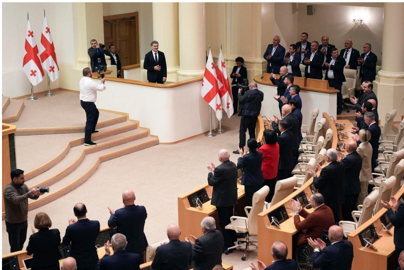
Михаил Кавелашвили и члены коллегии выборщиков в парламенте Грузии.

А если учесть, что все происходило не в Северной Корее, а в стране — официальном кандидате в члены ЕС, то событие трудно охарактеризовать иначе, чем историческую катастрофу.