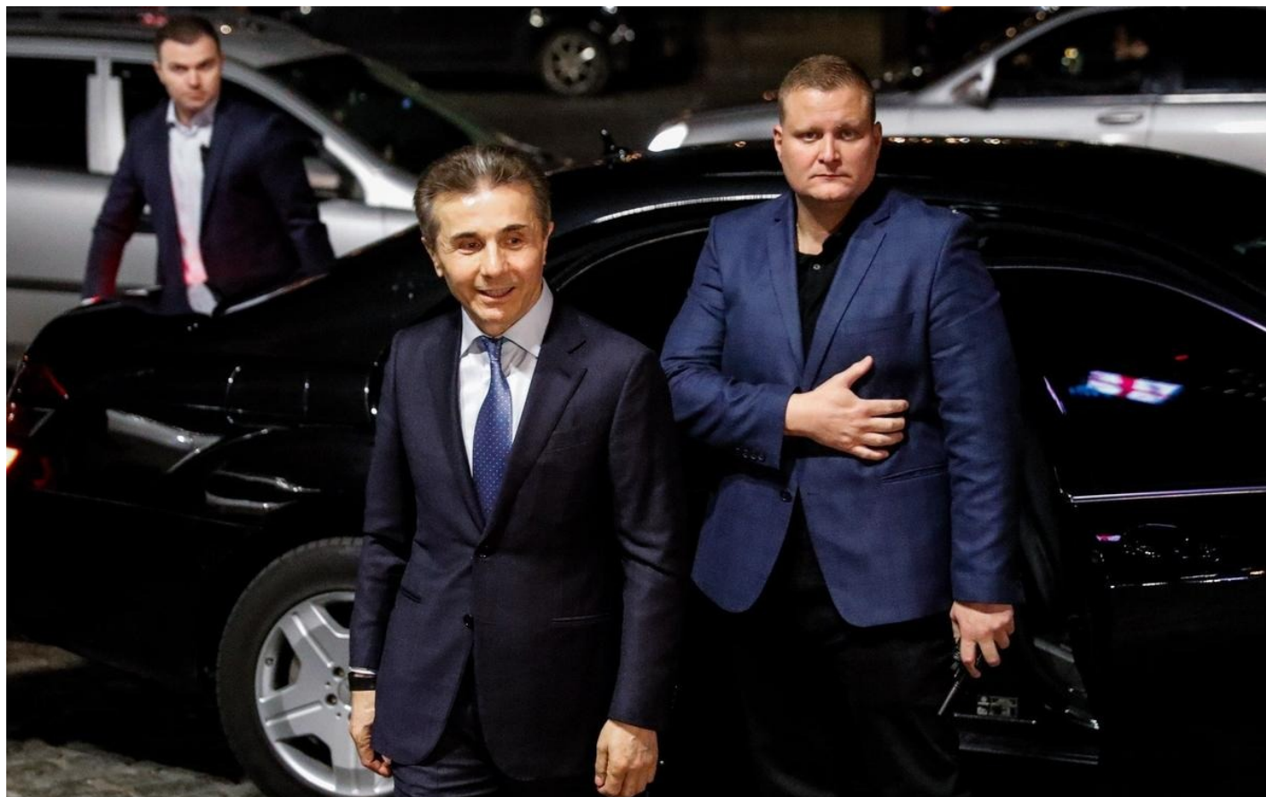
Бидзина Иванишвили.

Впрочем, Бидзина Иванишвили — также французский гражданин с 2009 года и даже кавалер высшего ордена Пятой республики — ордена Почетного легиона за вклад 80 млн евро в восстановление собора Нотр-Дам в Париже.