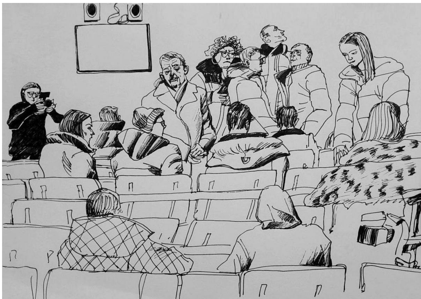
Рисунок: Екатерина Галактионова

судья первой инстанции нарушил закон: во время слушаний он отказался осмотреть главное вещественное доказательство — видео спектакля.