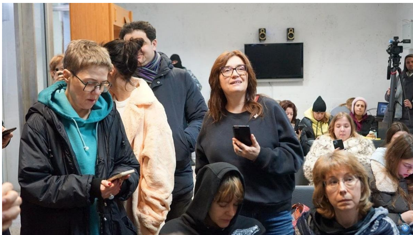
Журналисты и слушатели в ожидании начала трансляции.