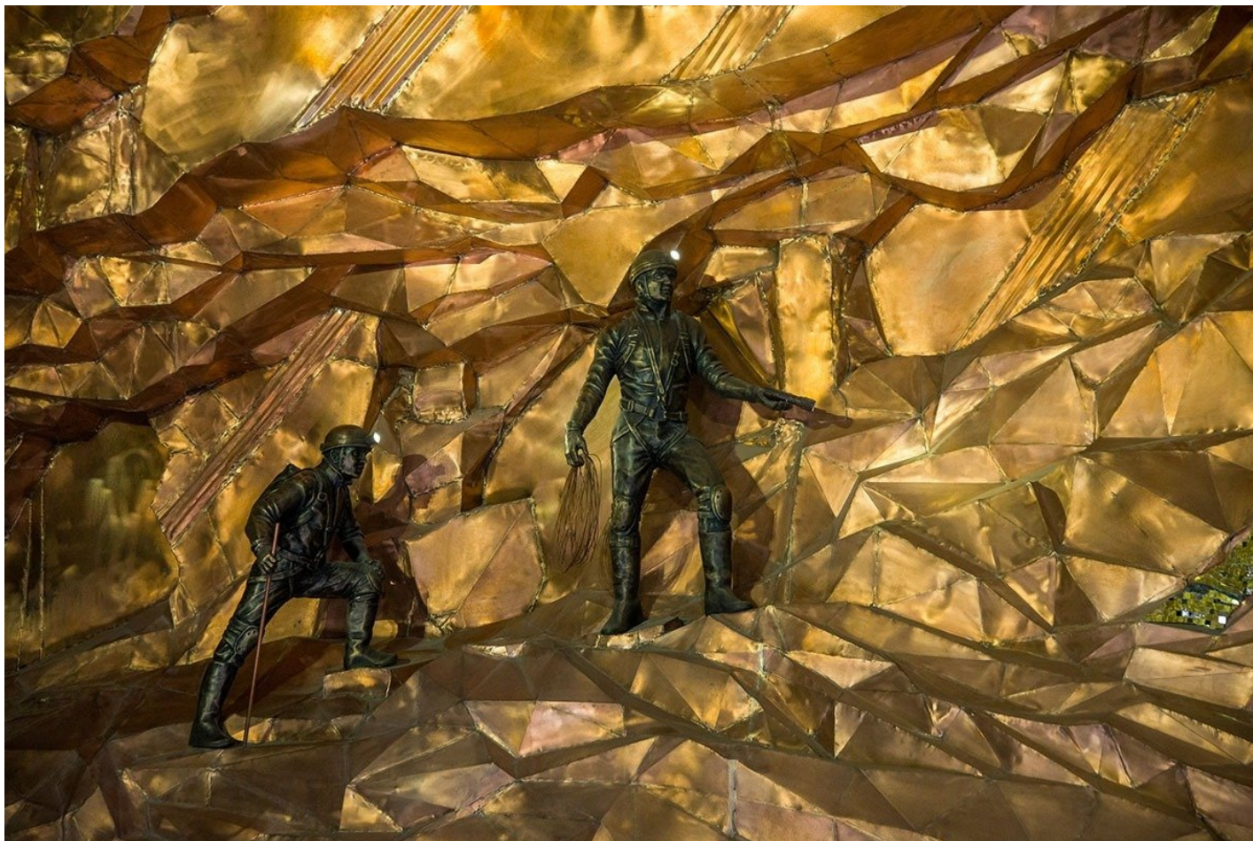
Станция «Горный институт» в Петербурге.

Еще год назад Беглов пообещал, что «Горный институт» введут не просто до конца 2024 года, а к сентябрю. После этого началась гонка: до станции дошел первый рабочий состав, появились фото из вестибюля, на углу Косой линии и Большого проспекта Васильевского острова начали благоустройство, «Спасскую» закрыли для подключения к ней нового участка линии и т.п.