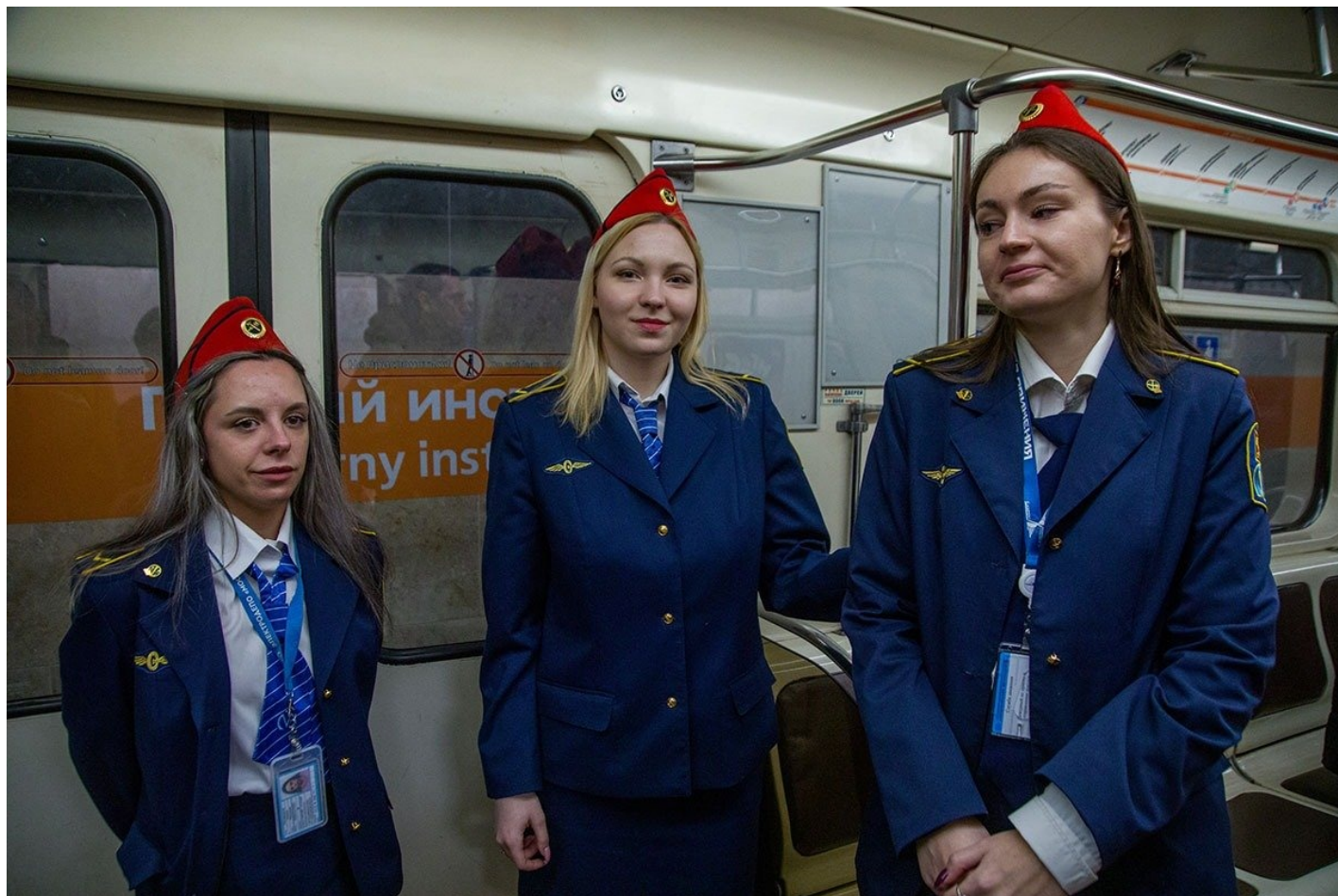
Открытие станции «Горный институт» в Петербурге.

«Шушары») запускали с существенными недоделками, которые устраняли уже в процессе эксплуатации.