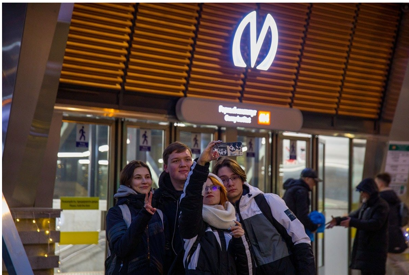
Открытие станции «Горный институт» в Петербурге.

«Горному институту» предстоит пройти тестирование в последнюю неделю декабря и праздничные январские дни. Но с первой неполадкой станция столкнулась уже сегодня около 9:30 утра, после того как приняла первых пассажиров. Часть эскалаторов, работающих на подъем и спуск, внезапно остановилась. По громкой связи в подземке тут же объявили: «Приносим свои извинения. Все бывает, эскалаторы новые». Но заминка оказалась долгой. В итоге люди, находившиеся на эскалаторах, были вынуждены подниматься и спускаться пешком. При том что «Горный институт» — одна из самых глубоких станций петербургского метро, она расположена на уровне 70 метров под землей. И пока это единственная точка городской подземки, где нет мобильной связи.