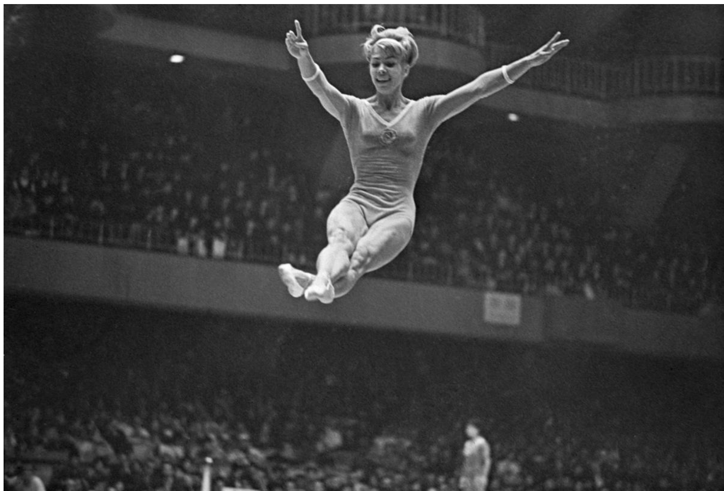
Лариса Латынина. XVIII летние Олимпийские игры в Токио. 1964 год.

А чуть позже одна известная компания устроила двум неподражаемым олимпийским лауреатам шикарную фотосессию. На той изумительной картинке не потерявшая шарма 77-летняя дама и 27-летний чудаковатый, но милый американец пьют чай на диванчике и смотрят друг на друга с неподдельной симпатией. Правда, не уверен, будет ли улыбаться старенький Фелпс, если падет его рекорд... Впрочем, не это меня волнует. Куда больше поражает (до сих пор) тот факт, что девчушка из Херсона в принципе могла и не попасть на свою первую Олимпиаду.