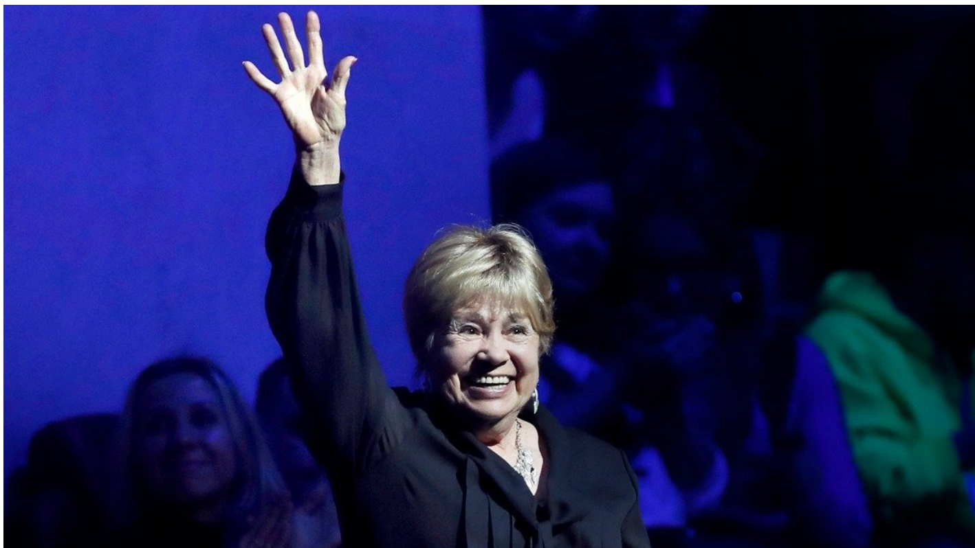
Лариса Латынина.

Ларисе Латыниной 27 декабря исполняется 90 лет