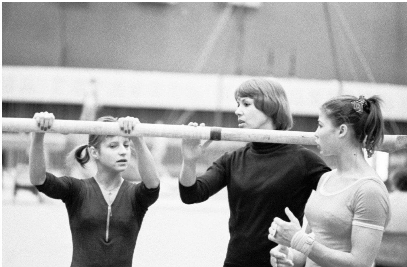
Лариса Латынина (в центре). 1976 год.