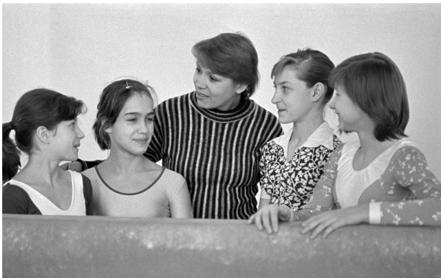
Девятикратная олимпийская чемпионка гимнастка Лариса Семеновна Латынина с юными гимнастками.