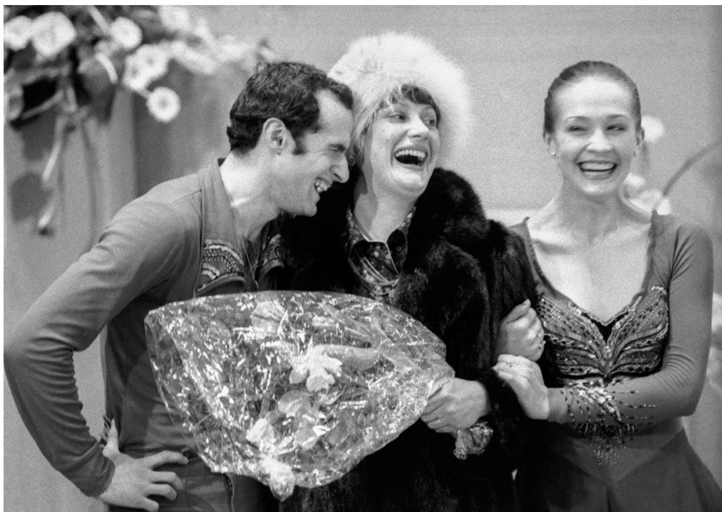
Фигуристы Геннадий Карпоносов и Наталья Линичук, победившие в соревнованиях по танцам на льду на

А как прекрасны были Наталья Линичук и Геннадий Карпоносов — двукратные чемпионы Старого Света и мира, олимпийские триумфаторы Лейк-Плэсида-1980. А кто не помнит блестящего и вдохновенного Владимира Ковалева — первого советского чемпиона Европы (1975) в мужском одиночном катании и двукратного короля мировых ярмарок? А Владимир Котин — чемпион СССР и четырехкратный серебряный призер европейских слетов? Эти и другие ее ученики в неповторимых спектаклях преодолевали на льду силу земного притяжения и обретали славу.