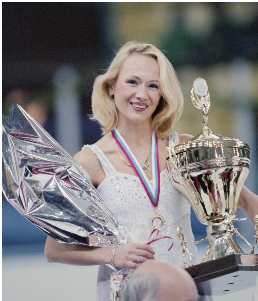
Кандидат в олимпийскую сборную России Мария Бутырская, 1997 год.

тренировках красотку и внушить ей, что она имеет все для того, чтобы волшебным образом кружиться при аншлагах в больших залах. Сама Бутырская секрет успеха объясняла так: «Чайковская научила меня катать короткую программу в любом состоянии. И неважно, выпалась — не выпалась, устала — не устала... Семь утра или двенадцать ночи — без разницы. Надо выскакивать на лед и выполнять все запланированное...»