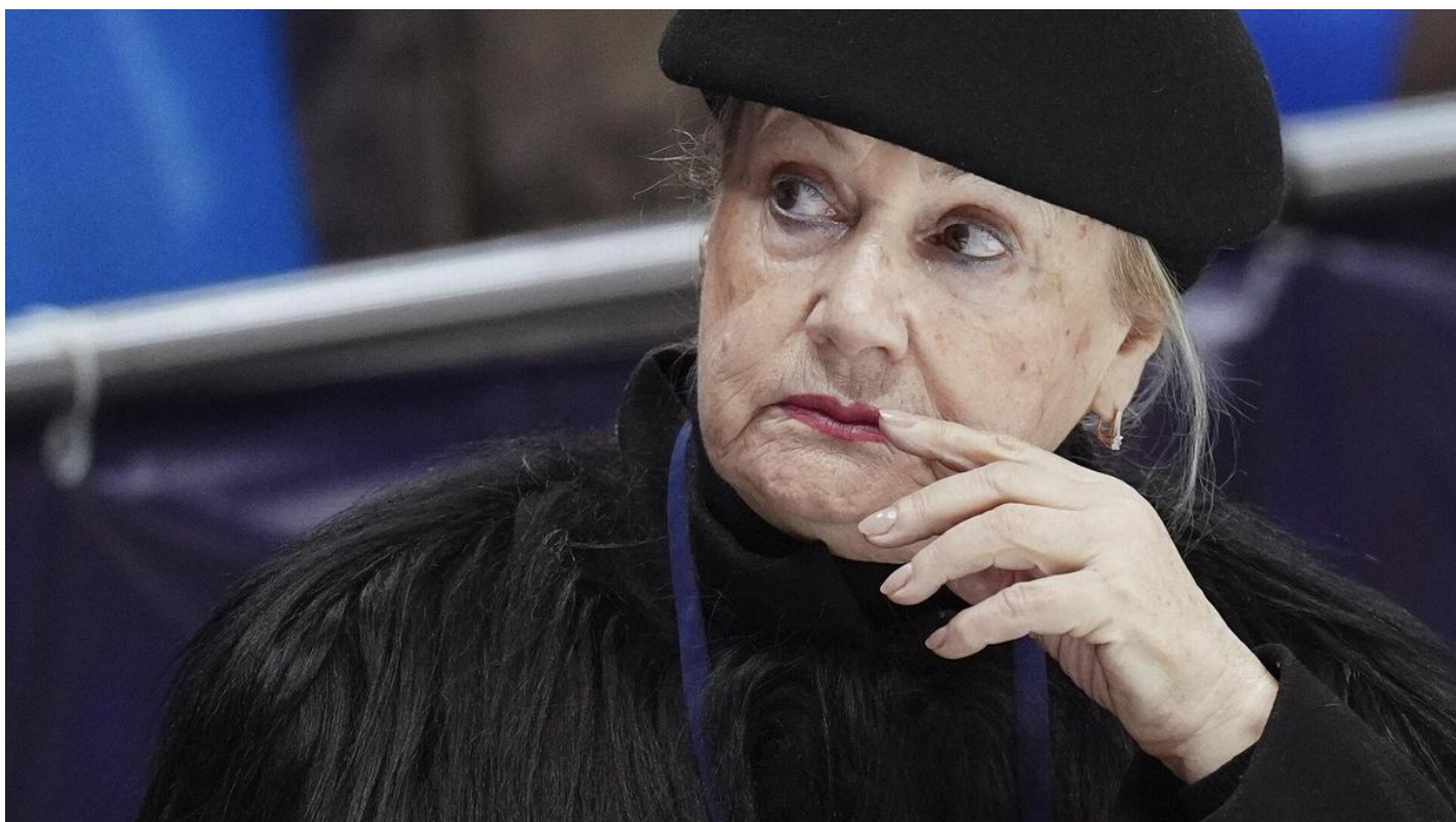
Елена Чайковская.

Легендарной Елене Чайковской 30 декабря исполнилось 85 лет