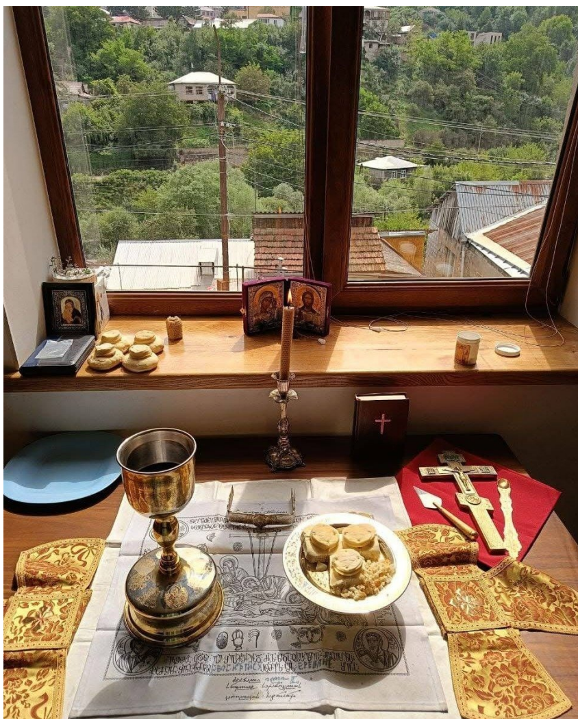
Вместо алтаря в Дилижане — стол и окно.

Недавно отец Андрей впервые крестил ребенка в городе Дилижане — там маленькая община открыла молельный дом. Вместо икон — распахнутое окно с видом на горы и небо. Больше ничего и не надо, чтоб Тот, Кому молишься, услышал.