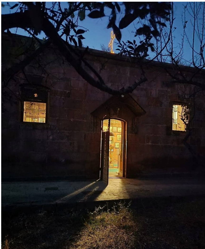
Церковь Сурб Геворг в Ереване.

Так что отец Андрей туда идти служить и не думал — из юрисдикции РПЦ он вышел сам, по доброй воле прервав служение в саратовском храме Серафима Саровского. Уже знал, что им в очередной раз интересовались люди из известной спецслужбы. В первый раз они приходили, когда Андрей подписал письмо священников в защиту фигурантов «московского дела». Тогда, в 2019 году, русская церковь пережила первое разделение по политическому поводу. На самом деле — по чисто религиозному. Разделивший ее вопрос был прост: