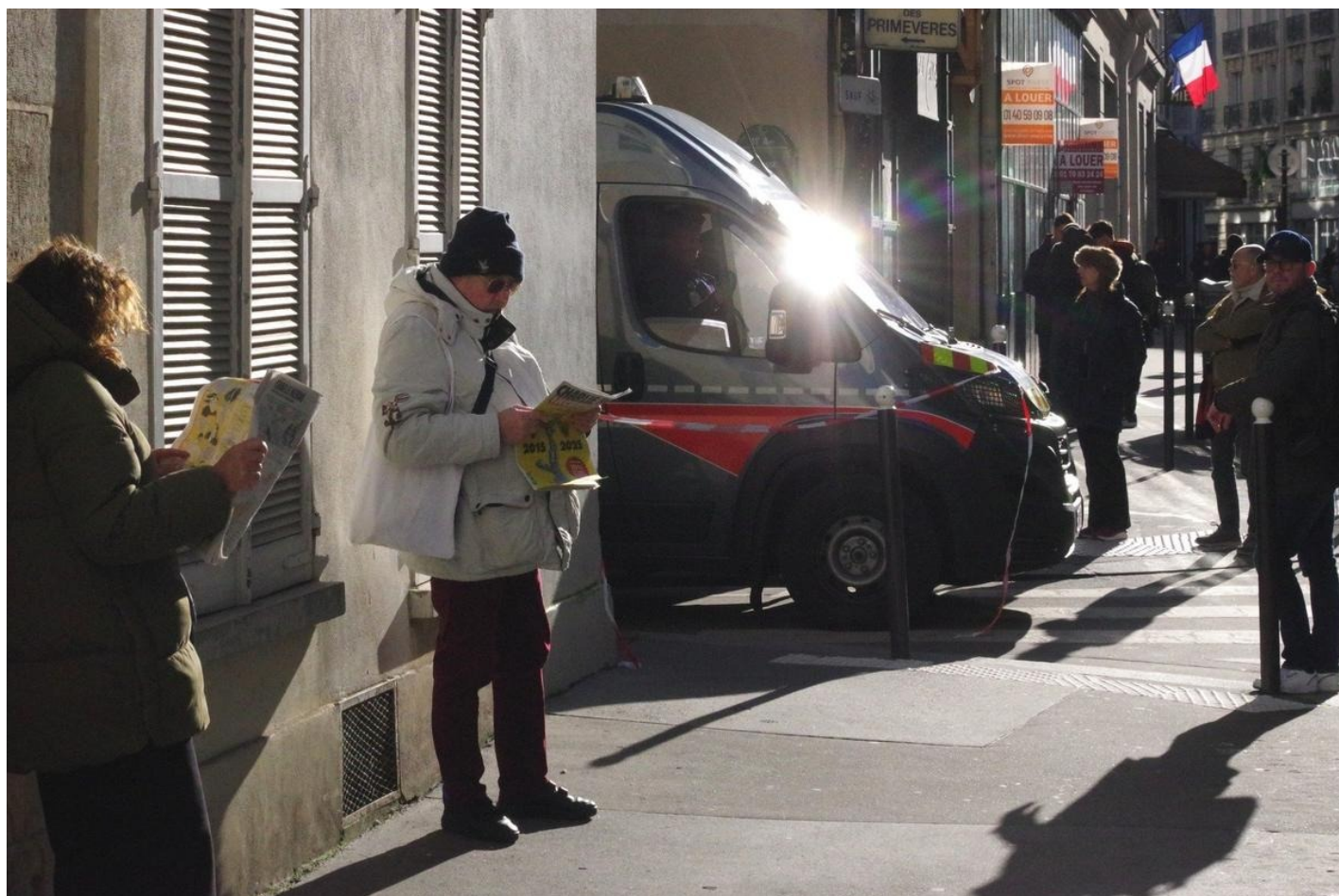
Люди читают сегодняшний номер Charlie рядом с реакцией в момент официальной церемонии памяти, на которую пускали только по приглашениям или аккредитации.