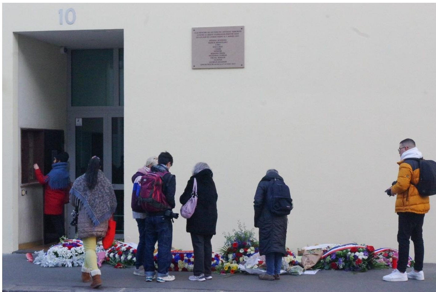
У входа в бывшее здание редакции. В 2020-м году здесь случился ещё один теракт: фанатик не знал, что Charlie здесь больше не работает.