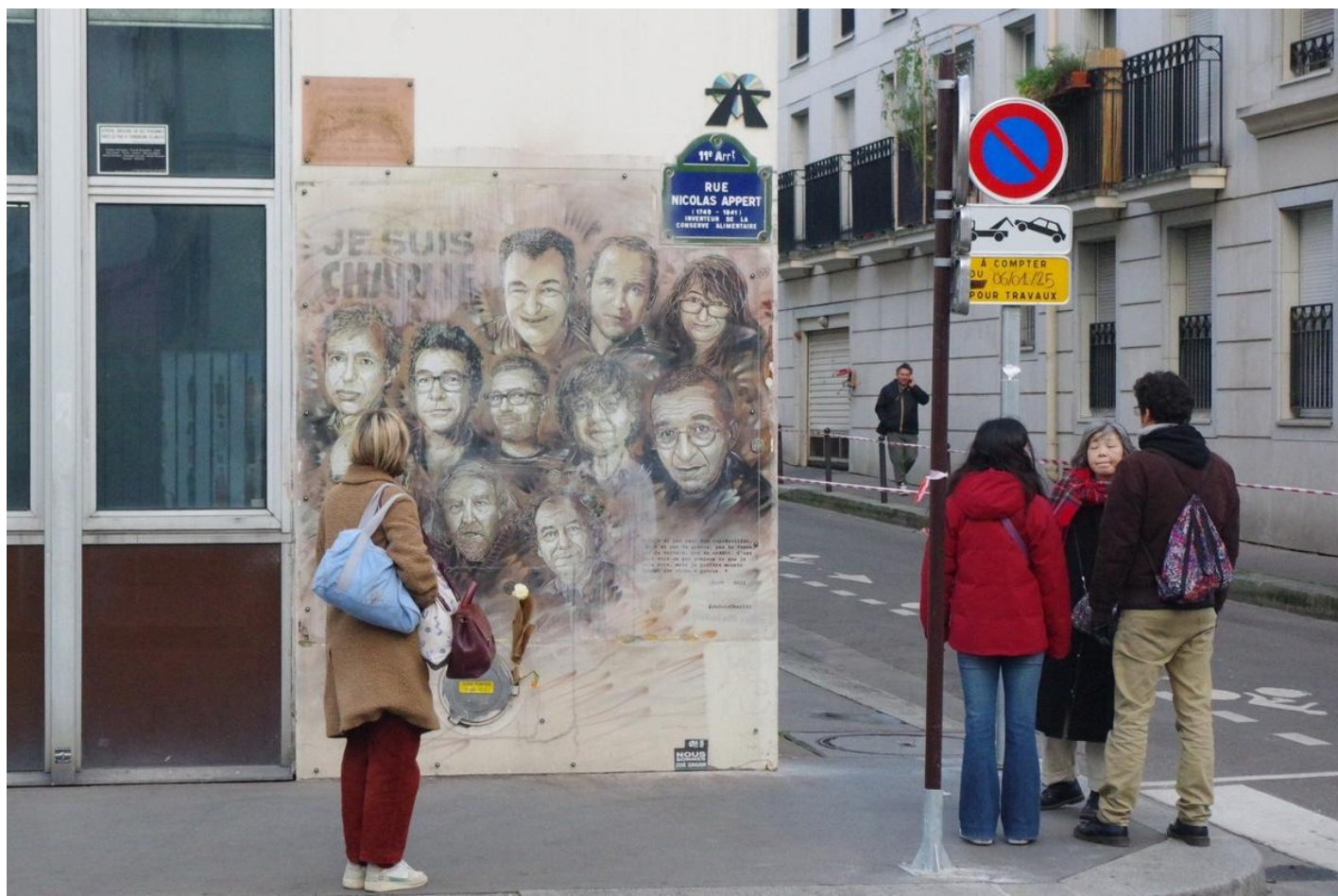
«Фреска» на углу бывшего здания редакции.

Накануне десятилетней годовщины январских терактов президент Макрон во время своего ежегодного обращения к французским послам сказал: «Мы знаем, что терроризм — это риск, который остается преобладающим в наших обществах и который подразумевает, что не должно быть никаких послаблений, должна сохраняться коллективная бдительность... В борьбе с терроризмом не должно быть никаких передышек».