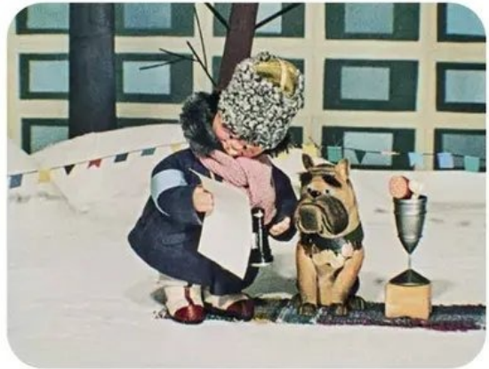
«Как лечить удава?», 1977