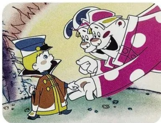
«Заколдованный мальчик», 1955