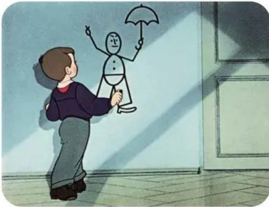
«Федя Зайцев», 1948