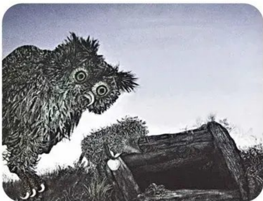
«Ёжик в тумане», 1975