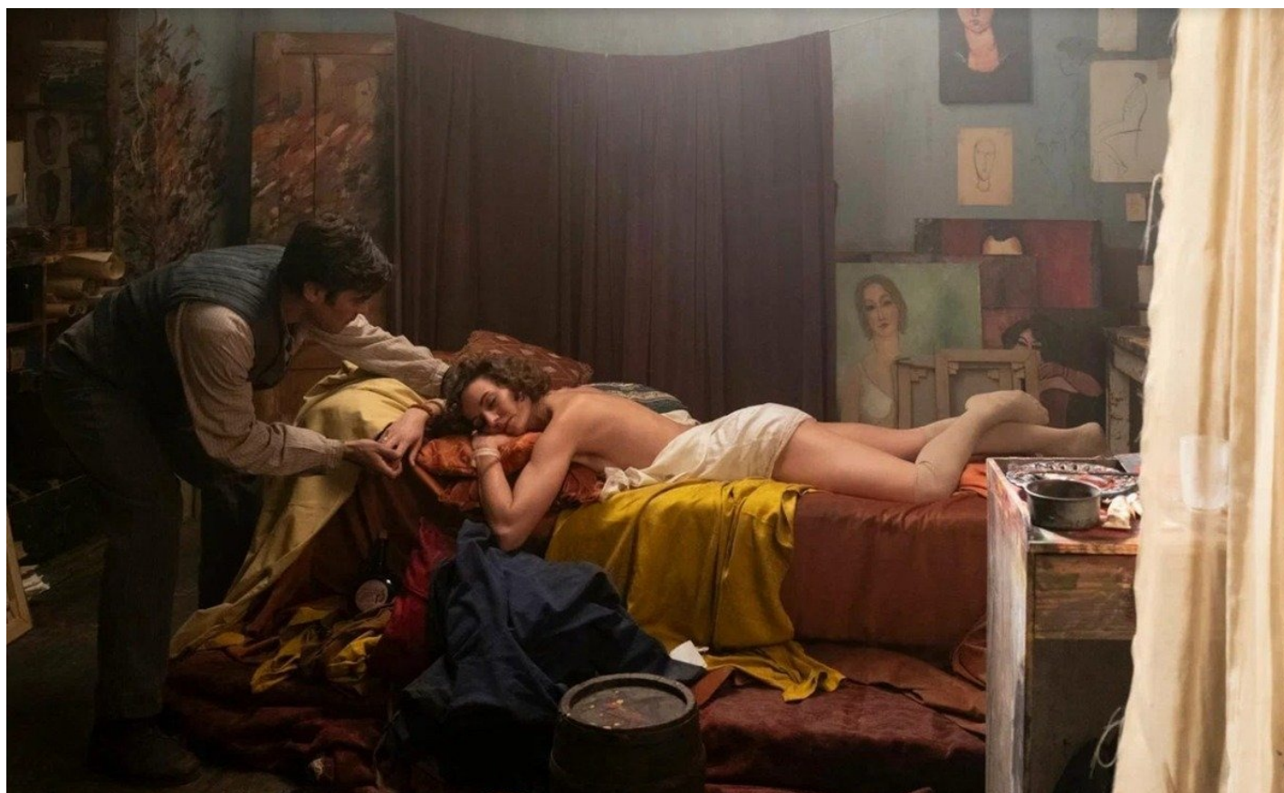
Кадр из фильма «Моди. Три дня на крыльях безумия».

Депп, похоже, хотел сделать зрительское кино под ядреный doodling Саша Путтнэма в духе Бреговича. Про проклятых художников, готовых гореть на алтаре искусства, не желающих лгать и приспособливаться. Ни в жизни, ни в искусстве. Про бражника и бродяжку, поклоняющегося Данте и готового разбить, уничтожить свои скульптуры в отсутствие понимания и любви. Про вечные взаимоотношения «поэта и книгопродавца».