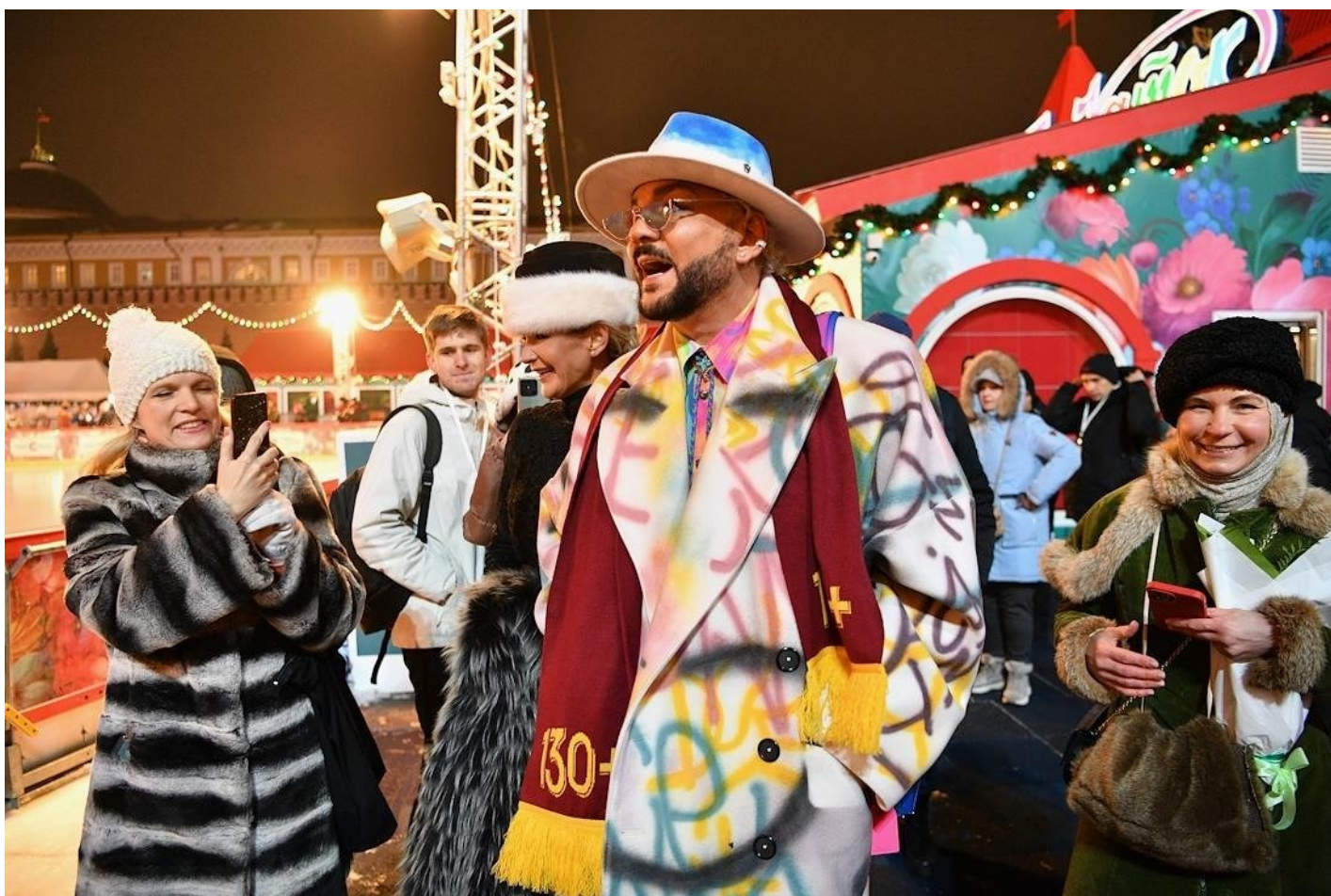
Филипп Киркоров на Красной площади.

У этого материала есть аудиоверсия на Youtube. Читает Ирина Петровская.