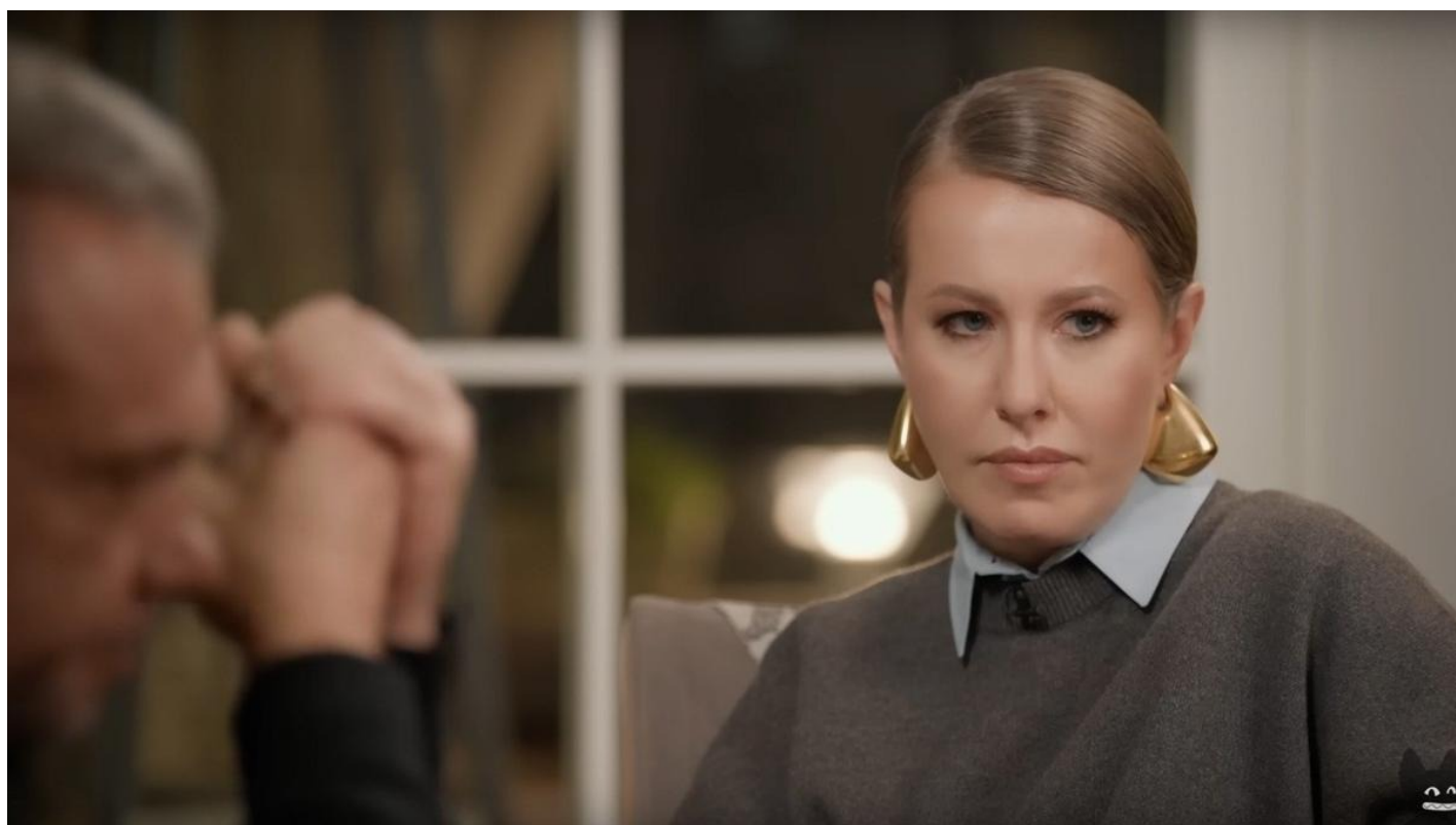
Игорь Мишин на интервью у Ксении Собчак. Скриншот

Собчак умеет травить душу своим героям. Вот и душу Мишина растравила до того, что этот сильный и властный мужчина заплакал в кадре, всхлипывая и закрывая лицо руками.