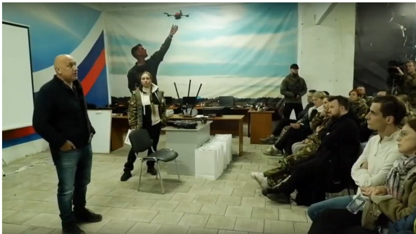
Обучение для участников программы «Высшая школа управления в сфере культуры». Скриншот из видео

Тем не менее около 80 звеньев кадровой цепи организаторам выковать явно удалось.