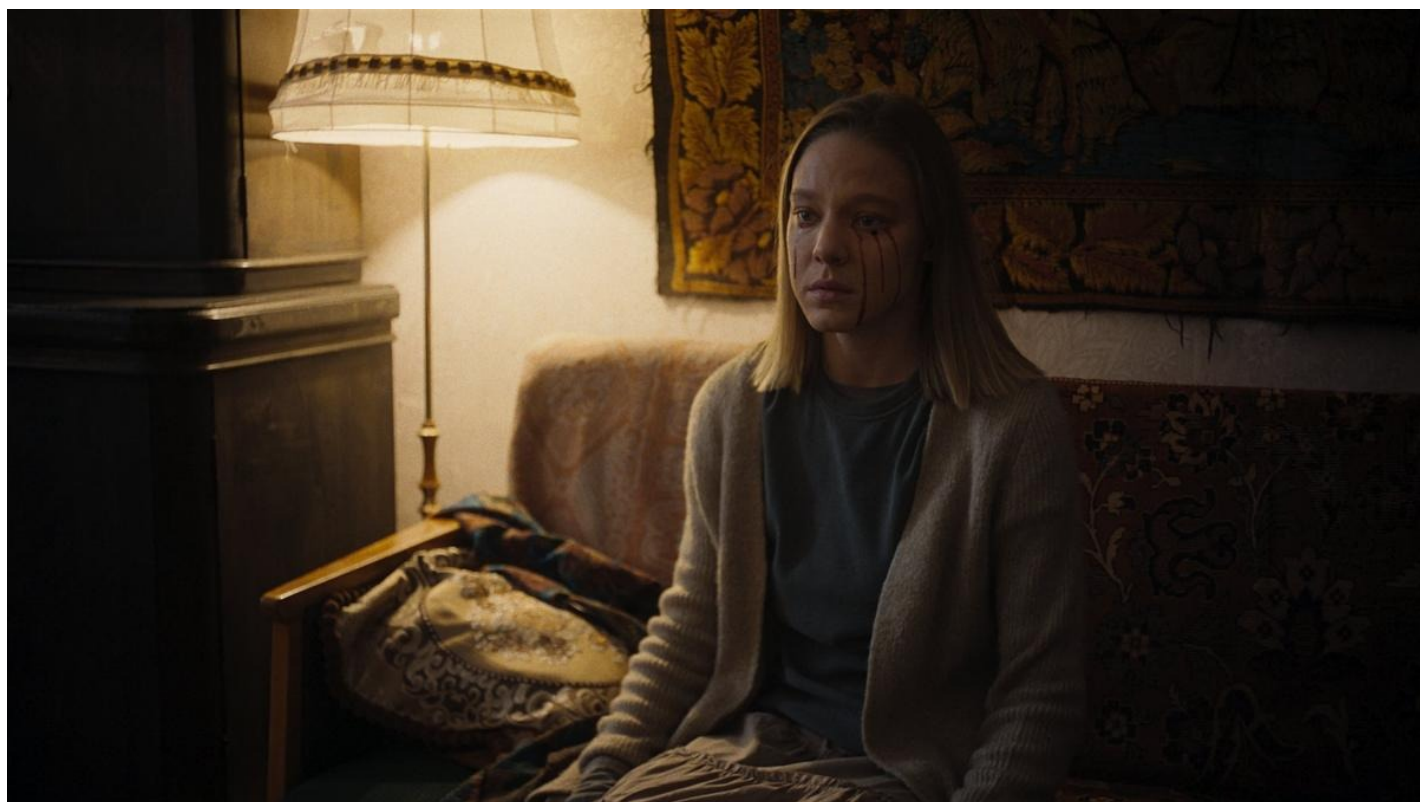
Кадр из сериала «Преступление и наказание».

В общем, смена эпохи в обоих проектах чисто формальна. Меняется скорее общая атмосфера: становится больше мистики, появляется новый герой — Черт, который является разным персонажам, оголяя их пороки. Мирзоев расставляет акценты иначе, чем Достоевский, ему одинаково интересны все его герои.