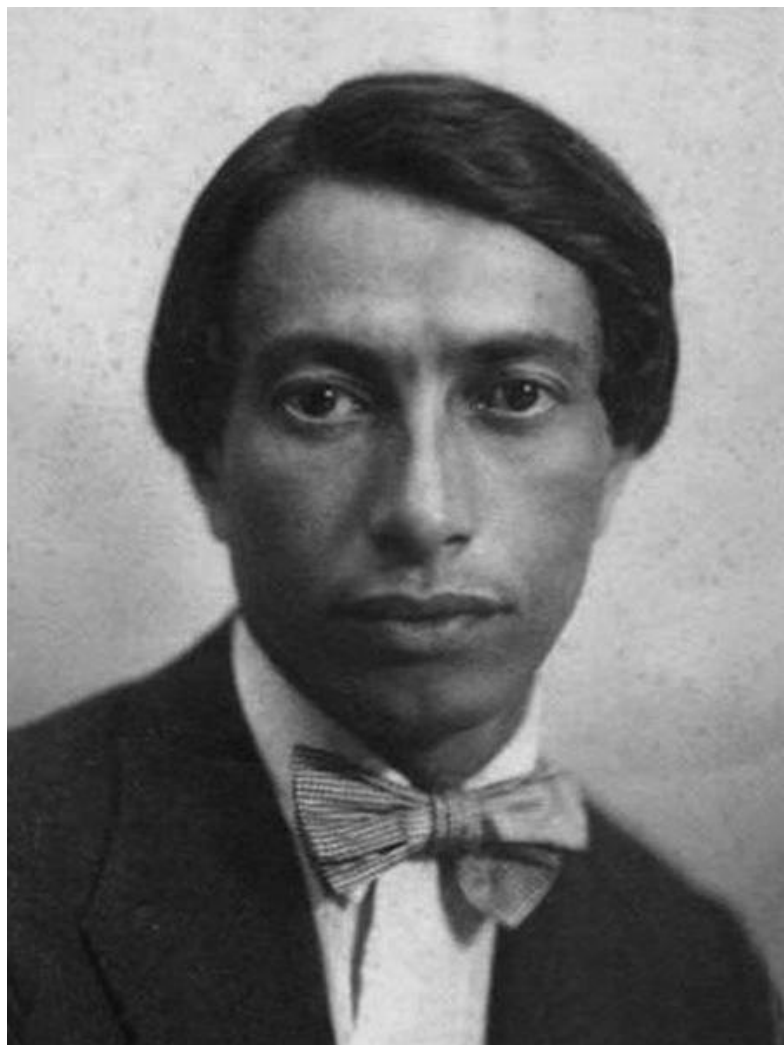
Натан Альтман. 1911 год.

Как рассказала искусствовед Станислава Малаховская, первая скульптура — «Девочка» — датируется 1953 годом.